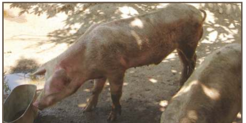
DISMINUCIÓN DEL APETITO

Los cerdos infectados con PPC se asemejan a aquellos animales infectados con varias enfermedades domésticas o exóticas tales como, la peste porcina africana (PPA), síndrome respiratorio reproductivo porcino agudo (SRRP), enfermedad asociada al circovirus porcino (PCVDs, por sus siglas en inglés), síndrome dermatitis y nefropatía porcino (SNDP), parvovirus, seudorabia, y enfermedades septicémicas tales como erisipela, salmonelosis, pasteurelisis, actinobacilosis e infecciones por Haemophilus parasuis . Cuando observe animales exhibiendo los signos clínicos mencionados arriba, sospeche de PPC y contacte a su médico veterinario.