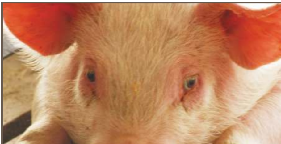
OJOS ENROJECIDOS Y CON CO