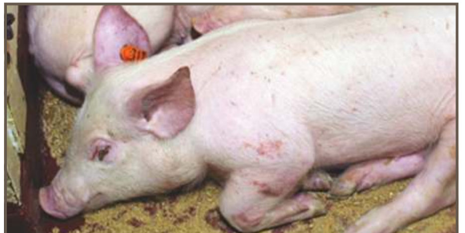
DECOLORACIÓN DE LA PIEL