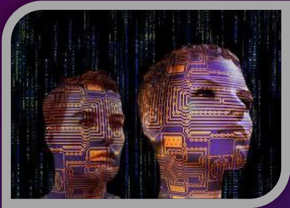
NUEVAS INTERFACES DIGITALES