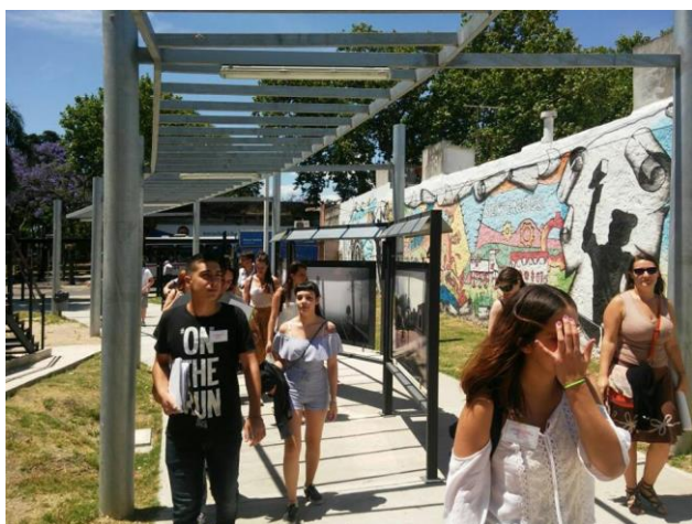
Llegando al Centro del Barrio Peñarol