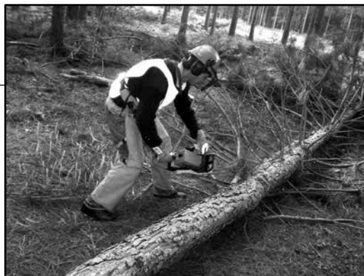
Curso de trabajadores forestales, Piedras Coloradas

Amaneció un precioso domingo de sol. Nos encuentra en plena ruta 3 llegando a Young. La ruta 3 nos engancha con la 25 que nos hará pasar por Menafra y después ya iremos entrando a tierras de forestación, llegando a Algorta, un enclave de la Caja Notarial, donde desarrolló un complejo forestal, muy anterior a la ley de estímulo a este monocultivo.