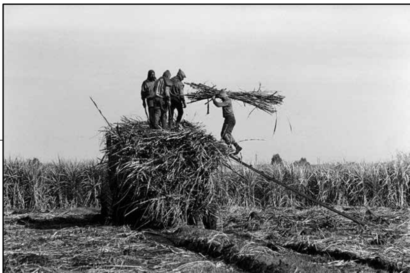
Cosecha de la caña de azúcar, Bella Unión, 2001. De la muestra "Bella caña, dulce unión" de Suci Viera