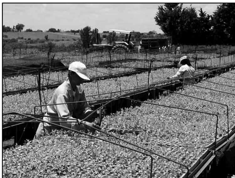
Hay un aumento del número demujeres en tareas rurales.

en las últimas décadas. Sin el acuerdo de la patronal, se logró una importante recuperación de estos salarios mínimos en las primeras negociaciones, pero luego, la rígida aplicación de las pautas del Ejecutivo limitó este proceso, mientras la producción aumentaba y los precios de los alimentos se iban a las nubes –no como consecuencia del aumento de los salarios, por cierto–. Así, crecieron las ganancias de los empresarios del sector