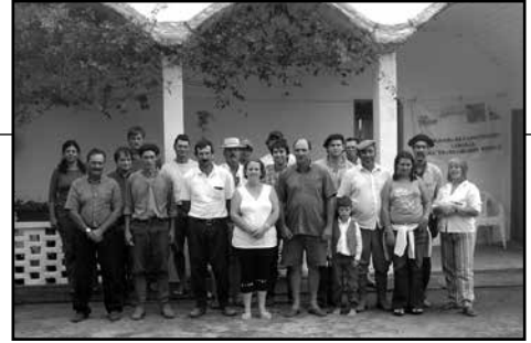
Participantes del curso en la escuela de Paso de la Armada, Cerro Largo

Cuando nos dijeron que íbamos para Paso de la Armada, departamento de Cerro Largo, busqué en los mapas, porque ya estamos acostumbrados a ir a poblaciones que no figuran en los mapas oficiales pero sí para la gente que vive allí. Lo más parecido que había encontrado, era una referencia de Paso de Almada. Luego, en el lugar, los vecinos me explicarán que se dice Paso de la Armada porque estaba tan cerca de la frontera, apenas a unos 700 metros del Yaguarón, que venía, en otro tiempo, la Armada a vigilar la frontera.