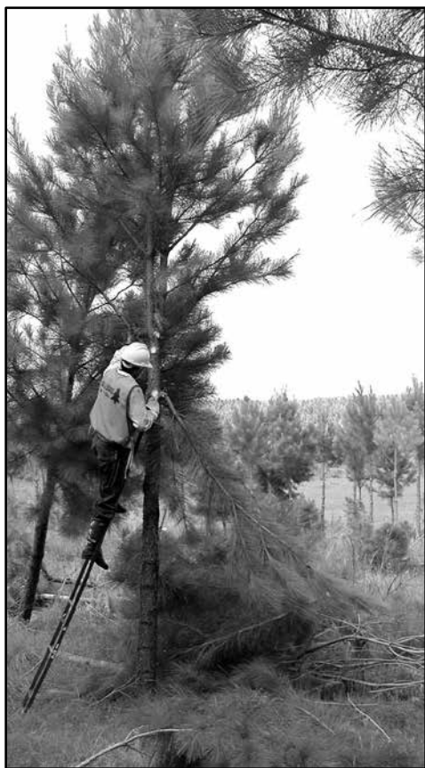
Podando pinos. En la forestación hay mucho trabajo tercerizado

Con los contratistas. La empresa, por ejemplo, Colonvade tiene, de ahí de la zona, siete u ocho personas con familia, los demás todos con los contratistas.