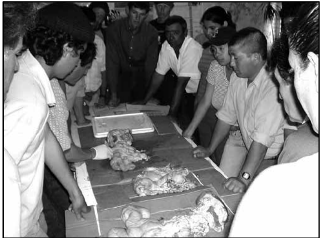
Aprendiendo sobre los organismos reproductores de los animales para la inseminación, en Campo de Todos y Laureles, Salto

Volvimos, con la alegría de saber que habíamos llegado a una parte de ese interior rural profundo, a cuyos habitantes queremos privilegiar con este Programa de Capacitación Laboral.