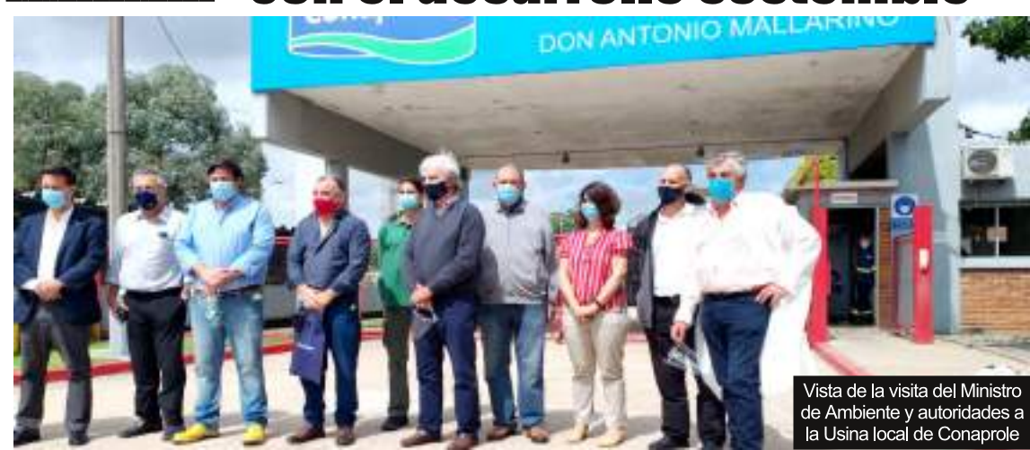
Ministro Ambiente Lic. Adrián Peña