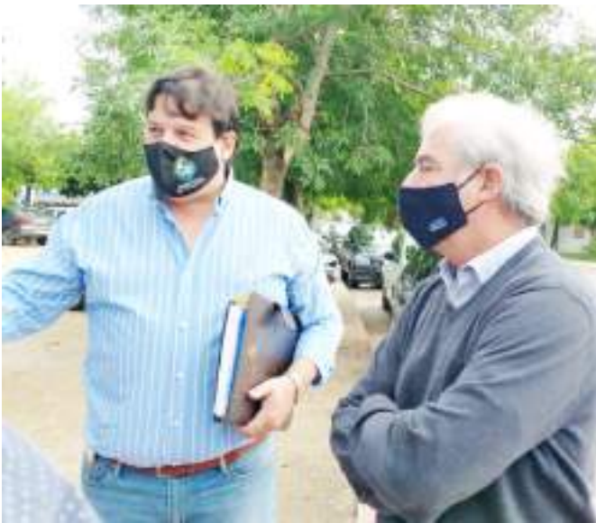
Ministro Peña y Psdte. Ambrois

P- Presidente, ingeniero Alvaro Ambrois, de visita en nuestra localidad, por un hecho significativo, mostrar al Minisetrío de Ambiente, la Planta de efluentes, de la Usina, algo muy importante ¿no es así?