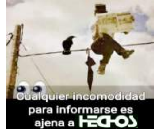
Cualquier incomodidad para informarse es ajena a HECOS

Cerrarán el módulo hasta el viernes e hisoparán a más de 500 reclusos.