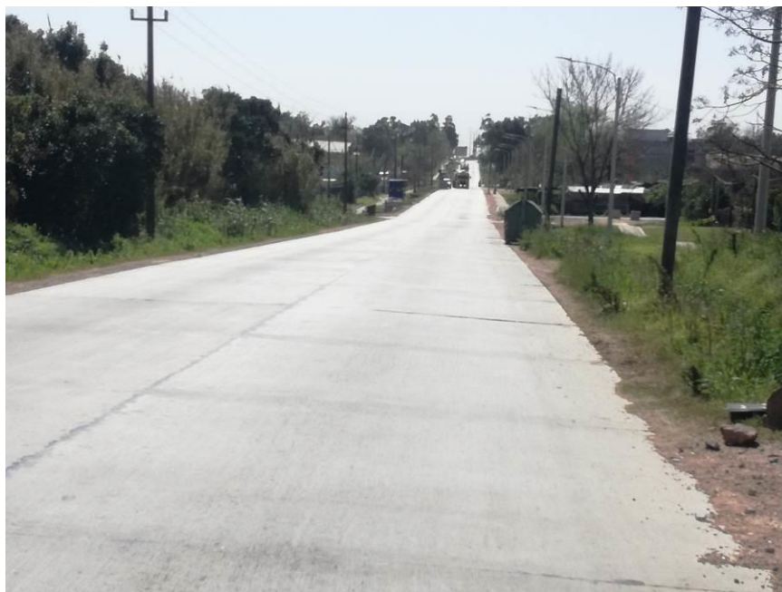
Foto 13.2-1 Vistas de tramo terminado