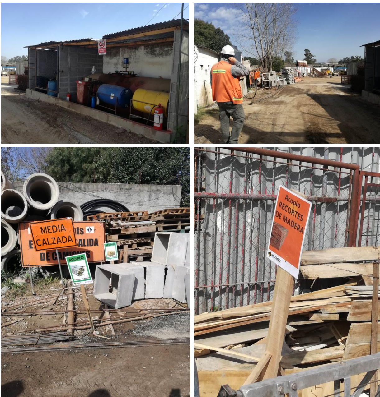
Foto 13.1-1 Vistas obrador