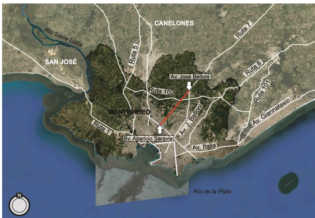
Figura 4.1-1 Ubicación de la obra.