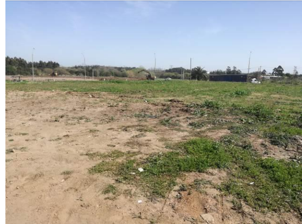
Foto 13.1-2 Recuperación ambiental