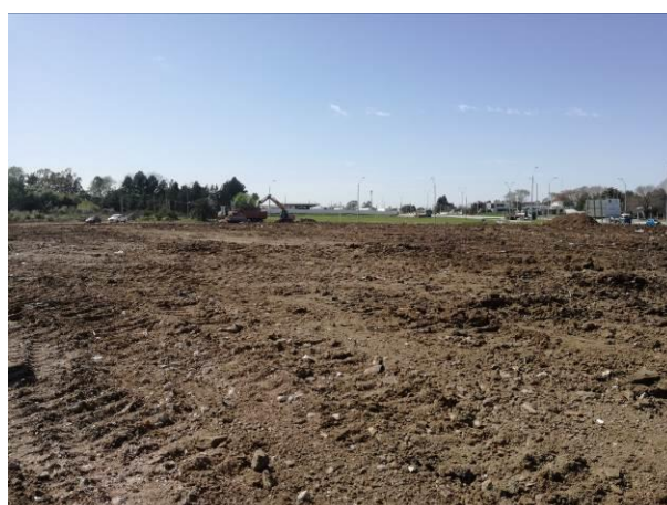
Foto 13.3-1 Vistas predio utilizado para disponer material de excavación