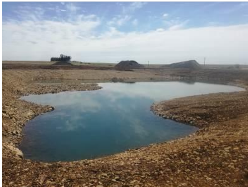
Foto 13.2-1 Vistas recuperación ambiental Cantera