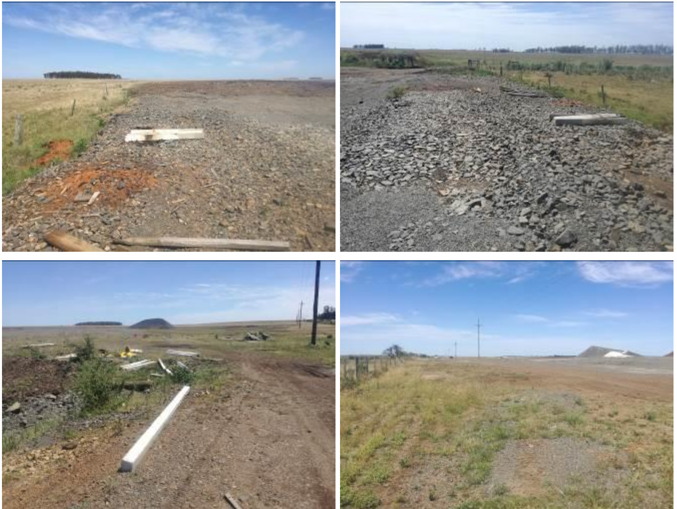
Foto 13.1-1 Vistas del predio obrador