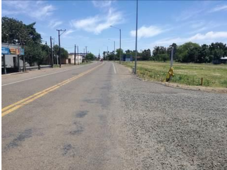
Foto 13.3-1 Vistas tramo terminado.