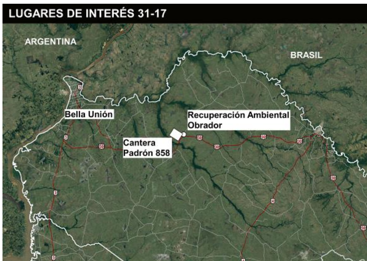
Figura 4.2-1 Lugares de interés