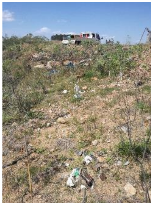
Foto 13.1-1 Residuos en el entorno del obrador