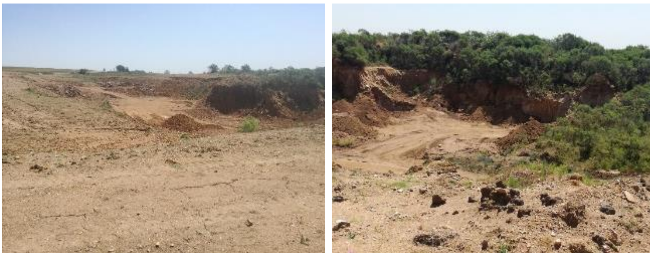
Foto 13.3-1 Vistas zona de préstamo