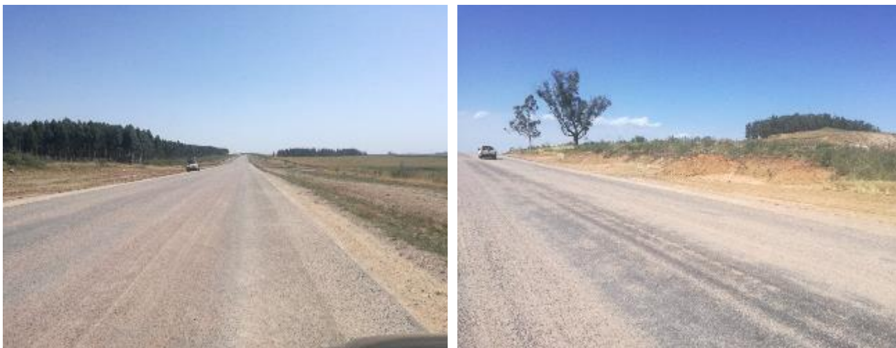
Foto 13.4-1 Vistas recorrido por el tramo