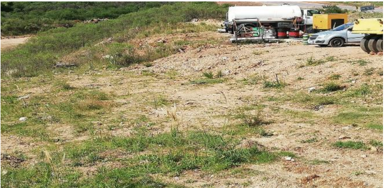
Foto 13.5-1 Recuperación Ambiental zonas de préstamo y entorno del obrador