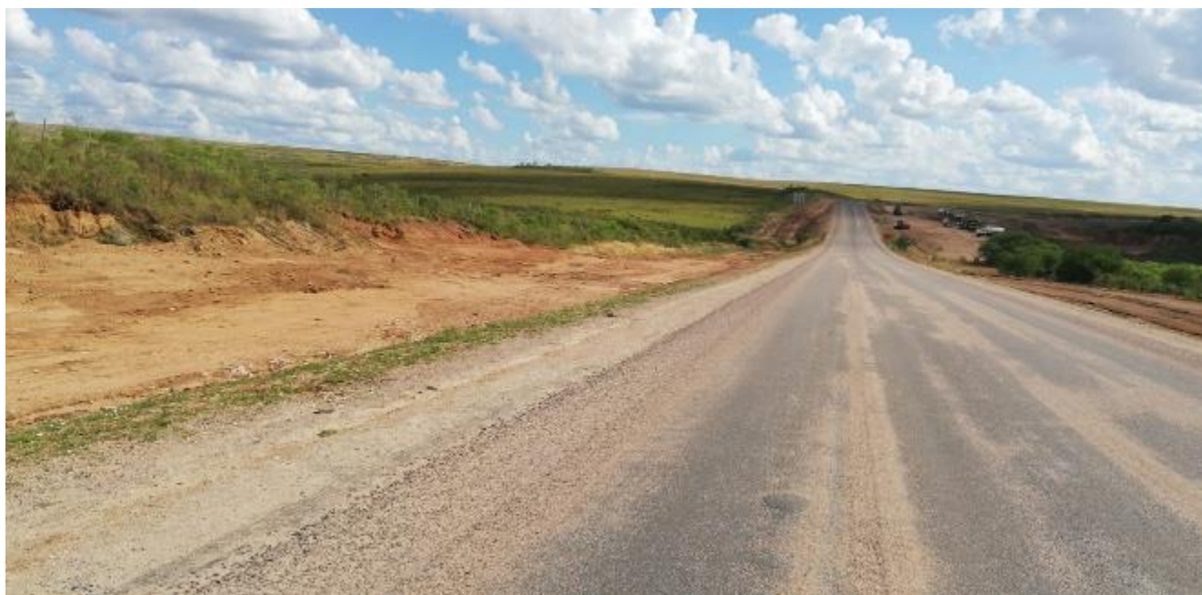
Foto 13.5-2 Recuperación Ambiental faja y entorno zona de préstamo