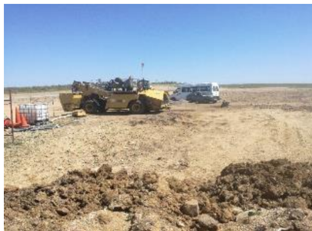
Foto 13.2-1 Vistas del Obrador