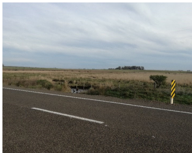
Foto 13.3-3 Vista 3 - Alcantarilla - R 30