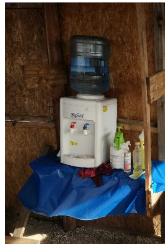
Foto 13.2-2 Medidas de prevención COVID - 19