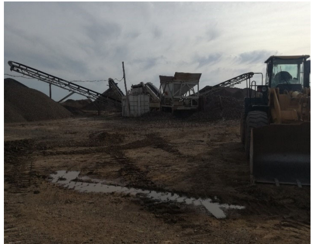
Foto 13.2-1 Vistas instalaciones en predio de la Cantera