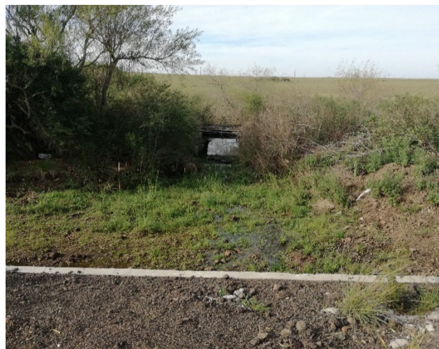
Foto 13.3-2 Vista 2 - Alcantarilla - R 30