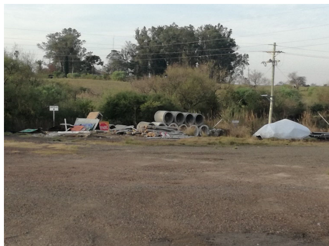
Foto 13.4-1 Vistas Obrador