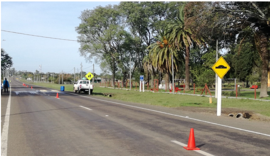
Foto 13.3-1 Vista 1 - Escuela Rural - R 30