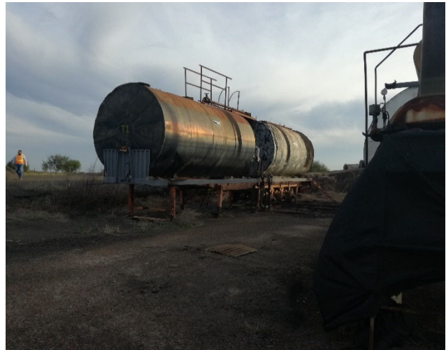
Foto 13.1-1 NC 1 Planta de Asfalto - Obrador