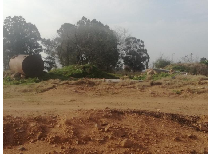
Foto 13.1-2 Vta.1 – Restos de materiales en torno a la alcantarilla en nuevo trazado.