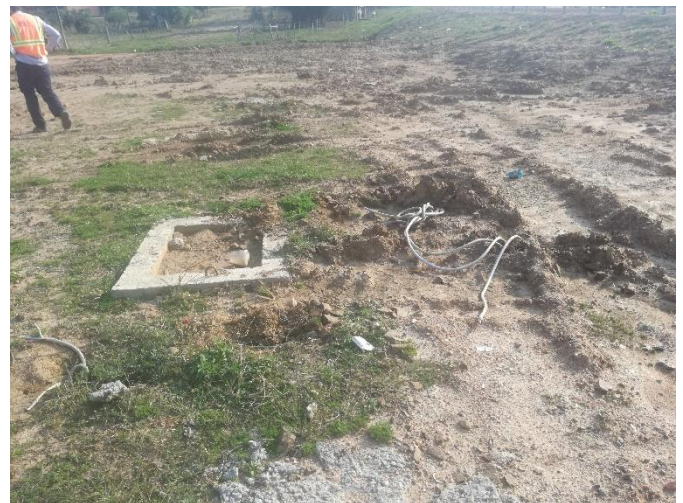
Foto 13.1-1 Residuos en predio donde estuvo ubicado el Obrador