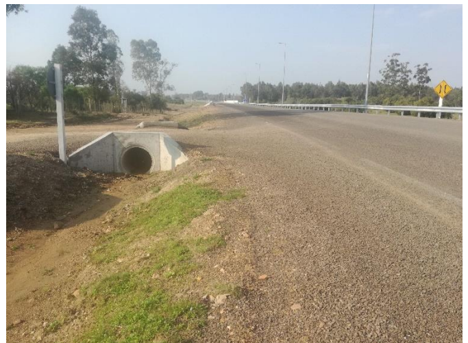
Foto 13.2-1 Vistas acceso Oeste del Puente