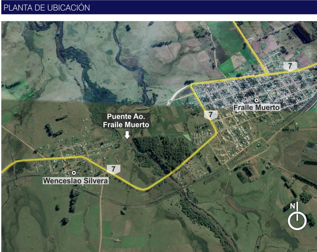
Figura 4-1 Ubicación general de la obra

La obra se desarrolla en la Ruta 7 (departamento de Cerro Largo) en el pasaje por Fraile Muerto.