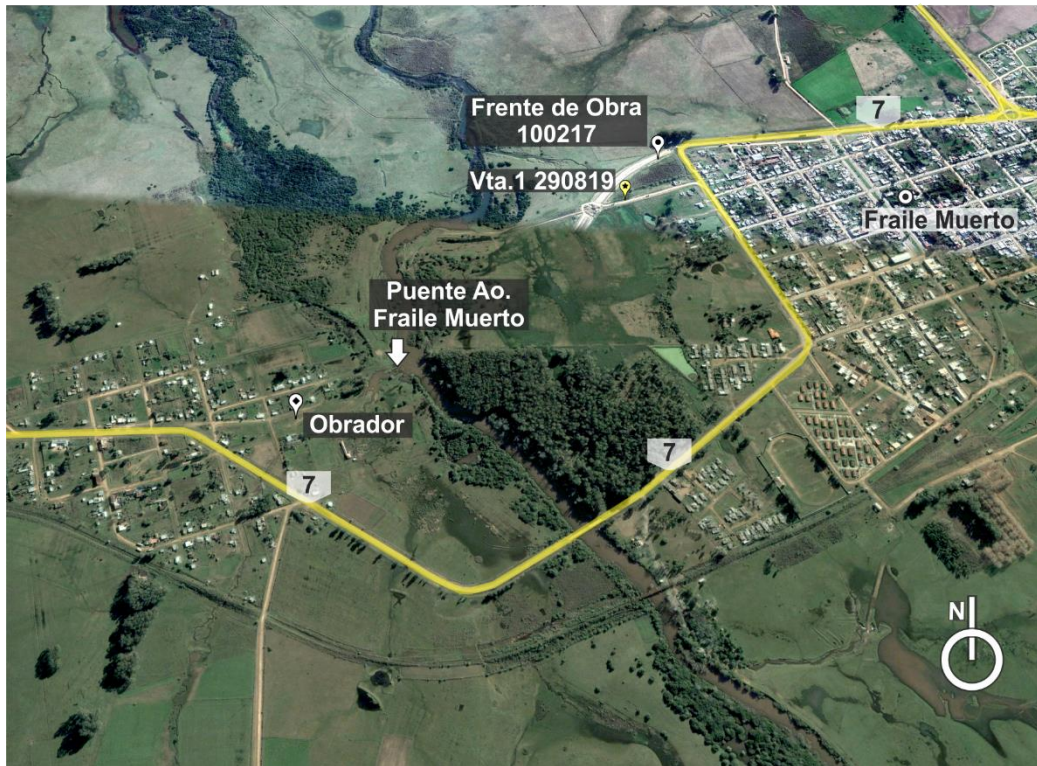
Figura 5-1 Lugares de interés