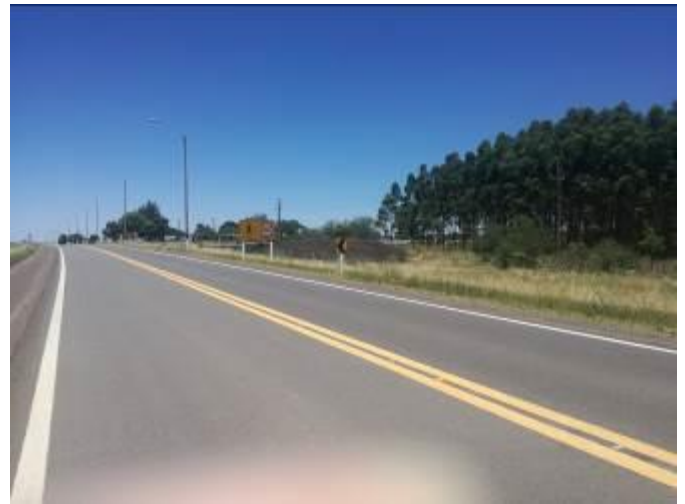
Foto 13.1-1 Vista de acopios en faja