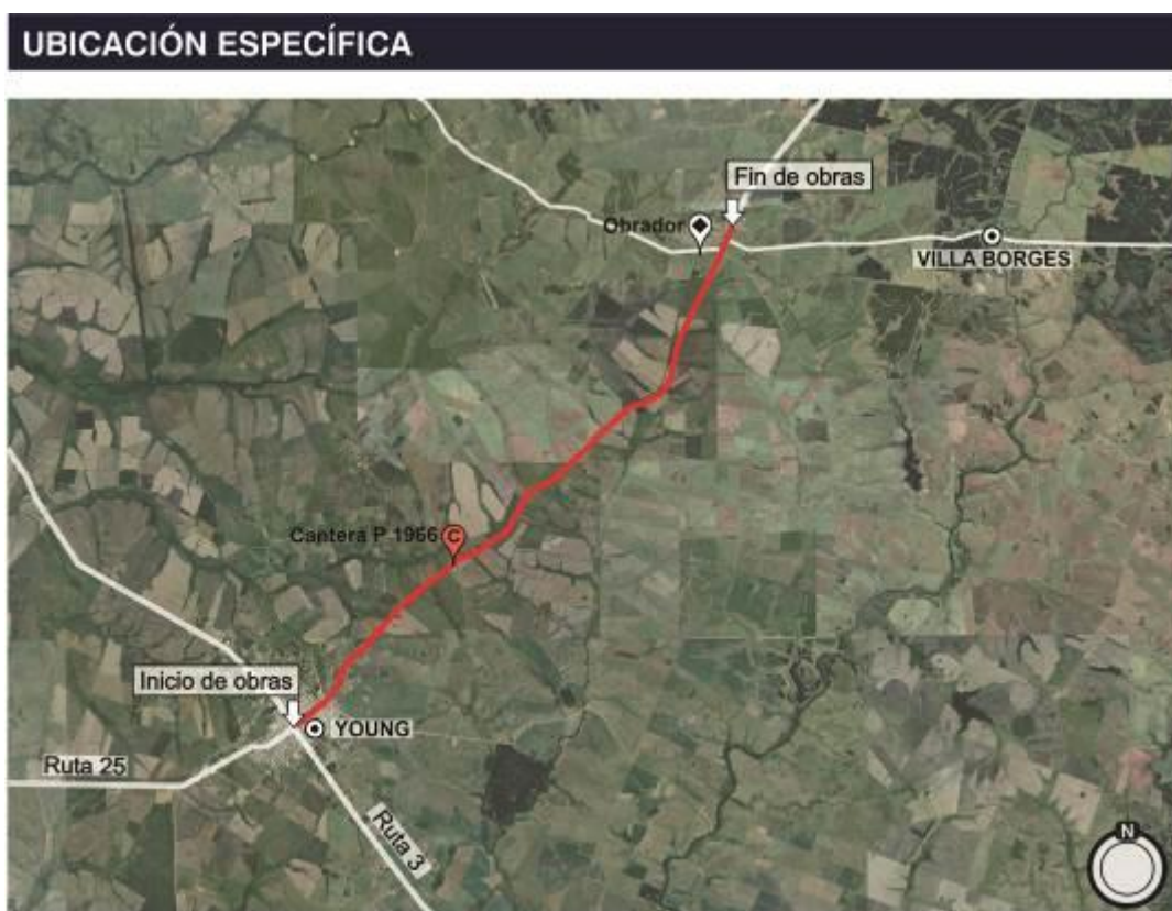
Figura 4.2-1 Lugares de interés.

* Estuvimos en la entrada pero no ingresamos al predio del obrador, en el mismo existen instalaciones permanentes de COLIER S.A. Actualmente estas instalaciones no están activas para ningún contrato con el MTOP.