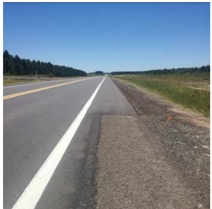
Foto 13.2-1Vistas tramo del contrato.