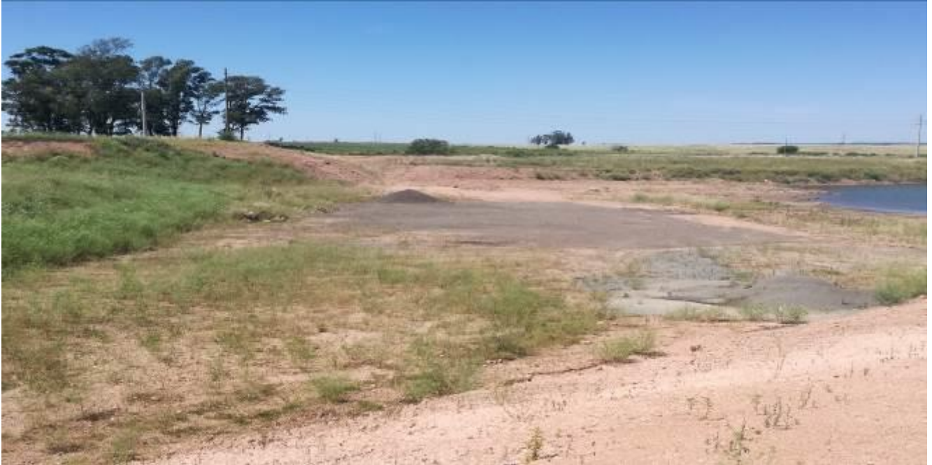
Foto 13.3-1 Vista Predio Cantera P 1966