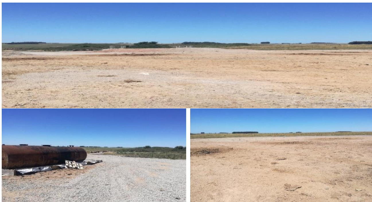
Foto 13.2-1 Vistas del predio del obrador en etapa del PRA