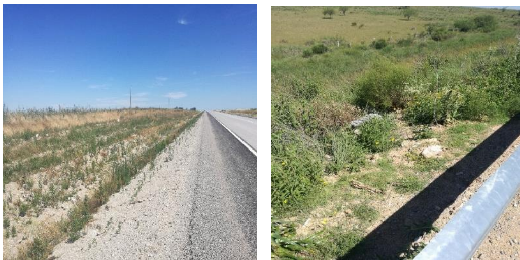
Foto 13.1-1 Vistas de irregularidades en faja