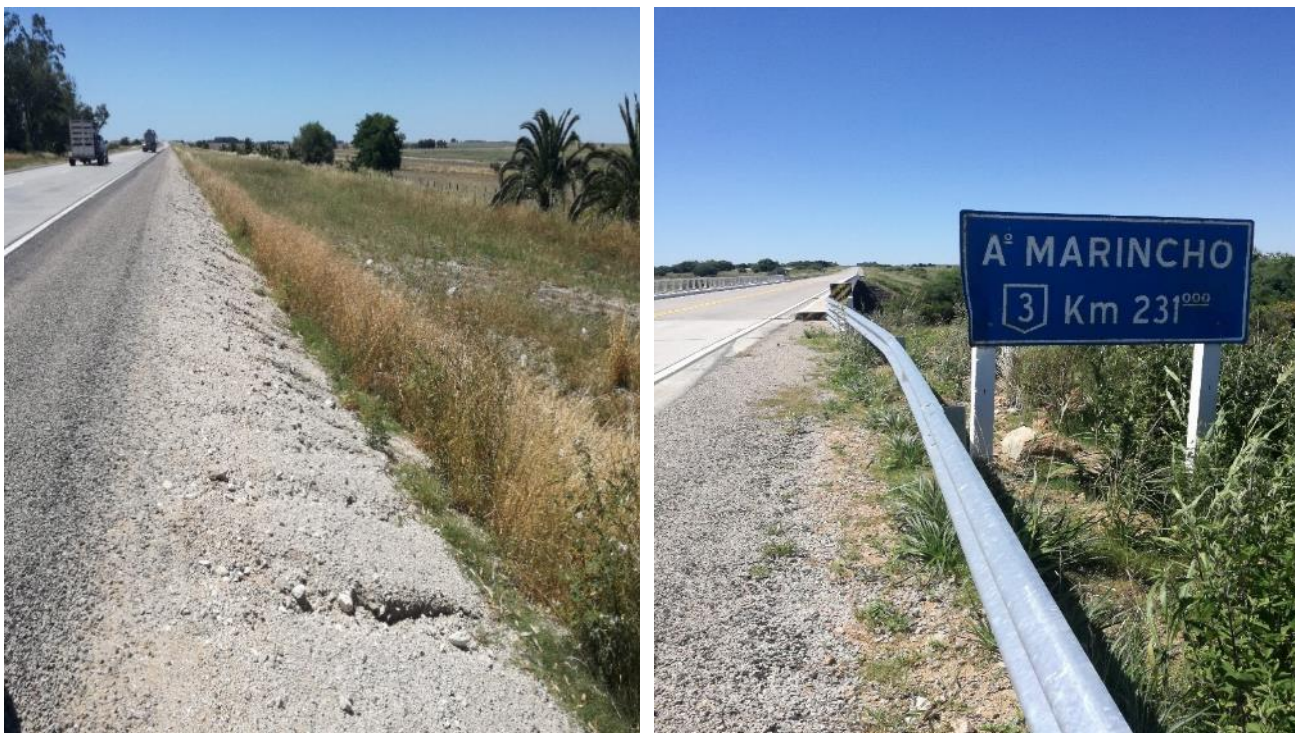
Foto 13.4-1 Recorrido por el tramo del contrato