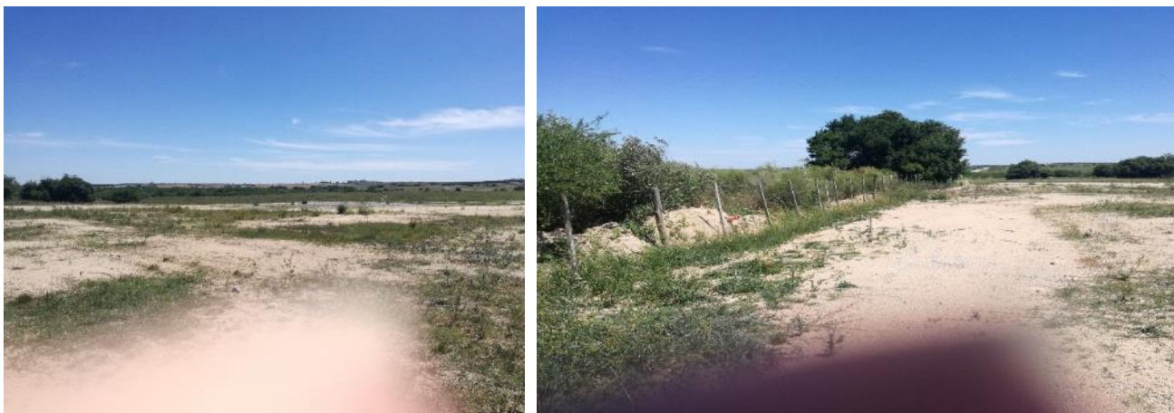
Foto 13.3-1 Vistas del predio de acopio en etapa del PRA