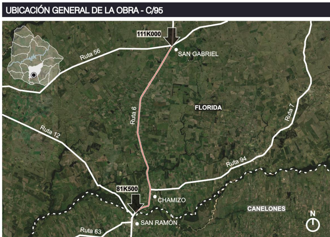
Figura 4.1-1 Ubicación general de la obra Página 5 de 13