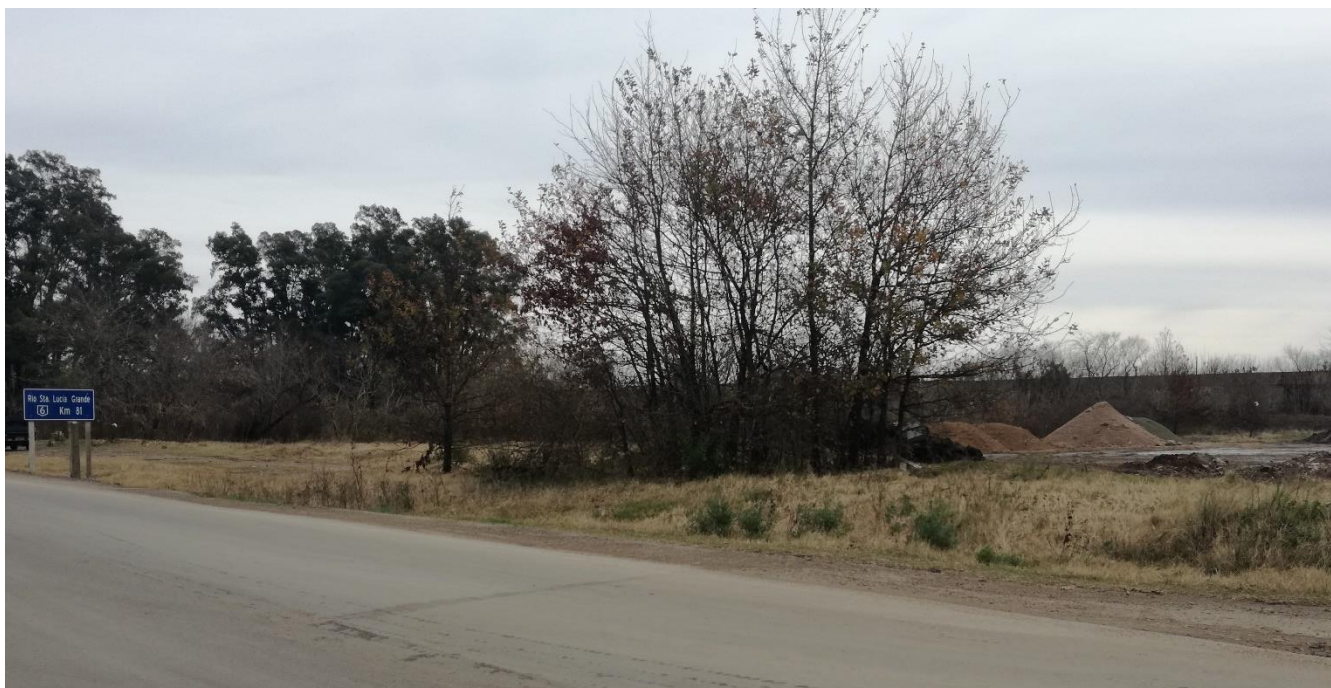
Foto 13-3 Vta.1 Acopio de materiales próximo al Río Sta. Lucía Grande