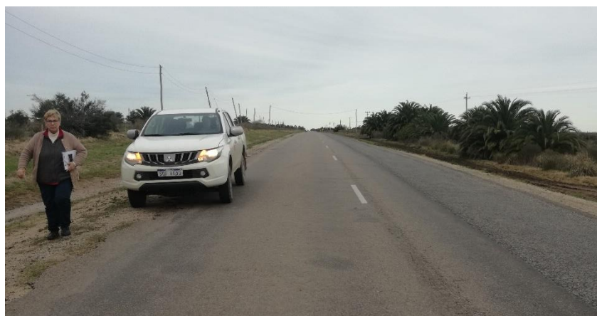
Foto 13-4 Vistas del tramo terminado