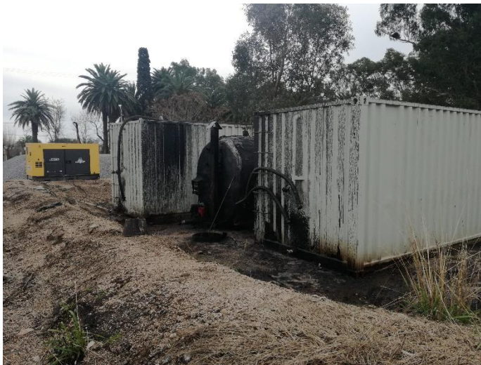
Foto 13-1 NC 1 Derrames en torno a dique de contención de tanques de asfalto.