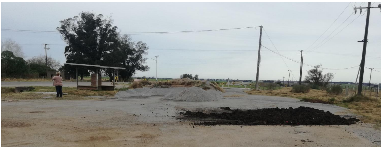
Foto 13-2 Vta.3 Acopio de materiales próximo a refugio de transporte público