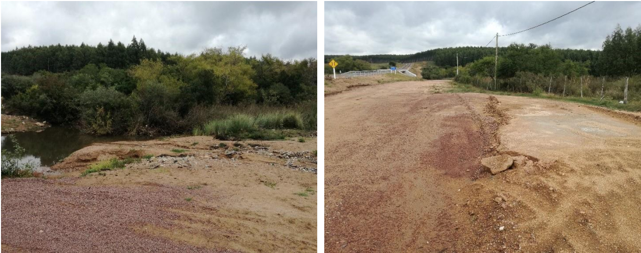
Foto 13.1-1 Puente Arroyo El Potrero - Ruta 7