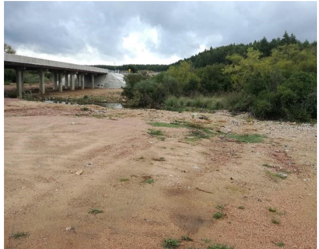
Foto 13.4-2 Puente Arroyo El Potrero - Ruta 7