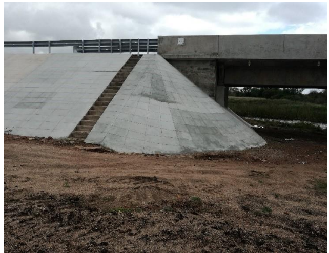
Foto 13.4-3 Puente Arroyo Paso Real de Mansavillagra - Ruta 7