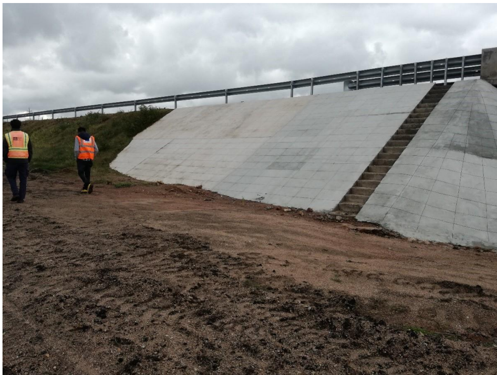
Foto 13.1-2 Puente Arroyo Paso Real de Mansavillagra - Ruta 7