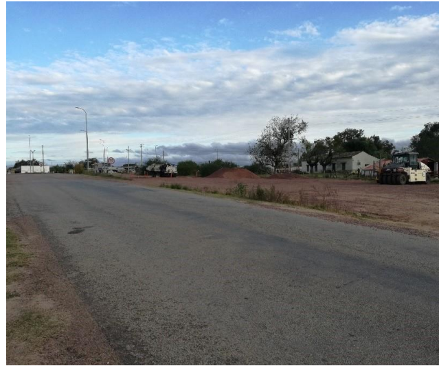
Foto 13.3-2 Acopios próximos al cruce de viviendas