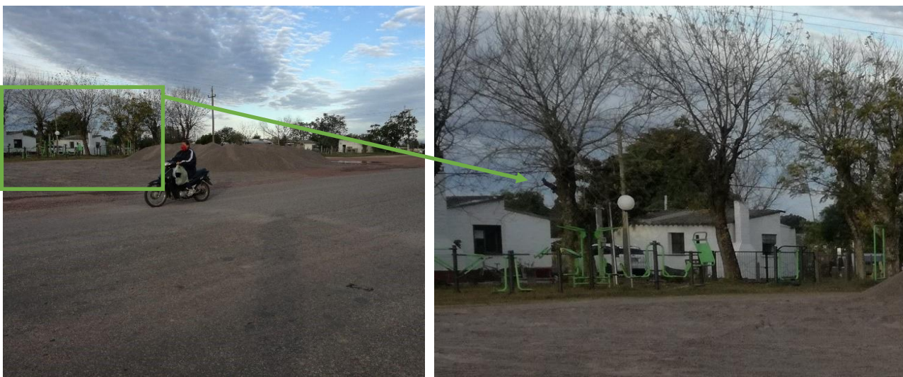
Foto 13.3-1 Acopios próximos a viviendas y aparatos públicos de gimnasia