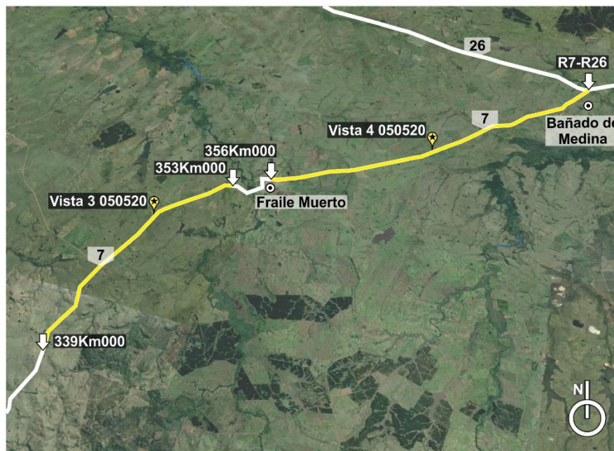
Figura 4.2-2 Lugares de interés 2