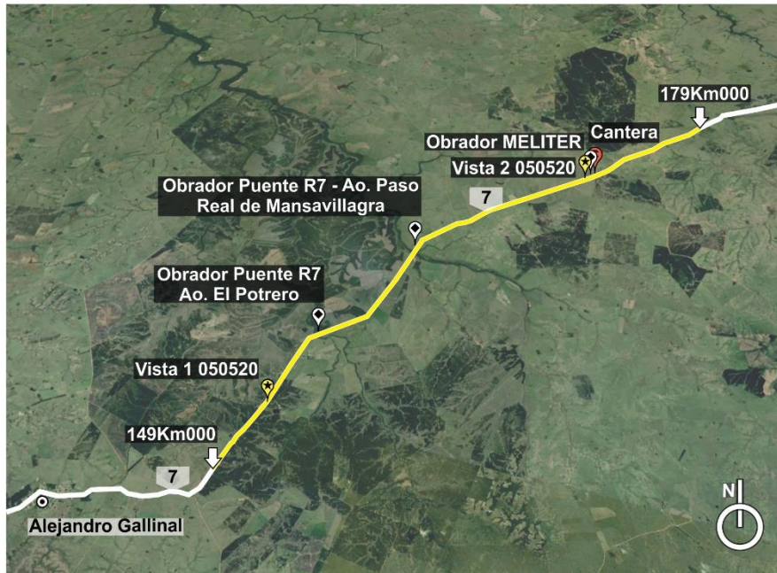
Figura 4.2-1 Lugares de interés