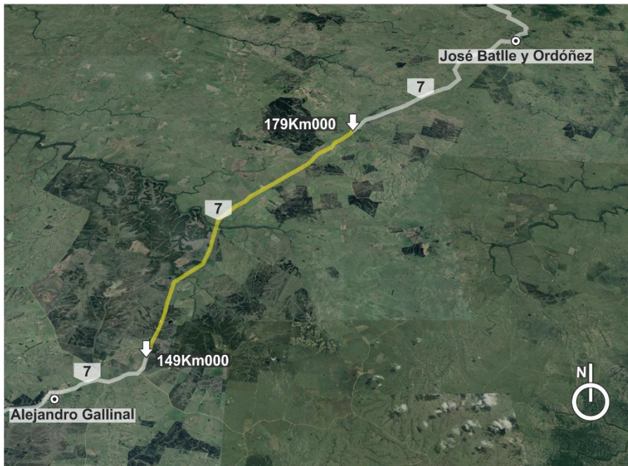
Figura 4.1-1 Ubicación general de la obra. – Contrato inicial