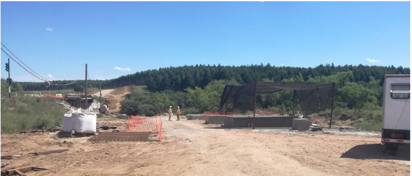
Foto 13.1-1 Instalaciones y acopio en zona a donde ha llegado el agua en dos oportunidades.