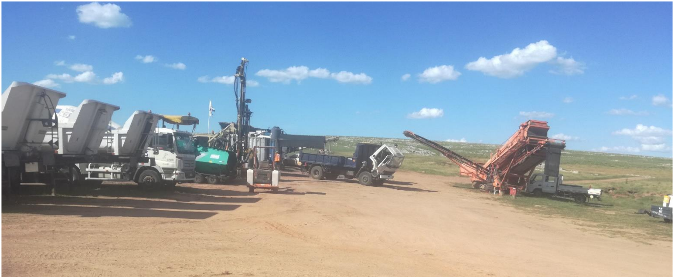
Foto 13.7-1 Vista Equipos en Obrador MELITER