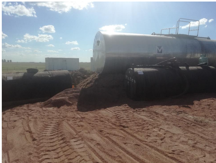
Fotos 13.3-1 Tanques de asfalto con dique de contención inadecuado