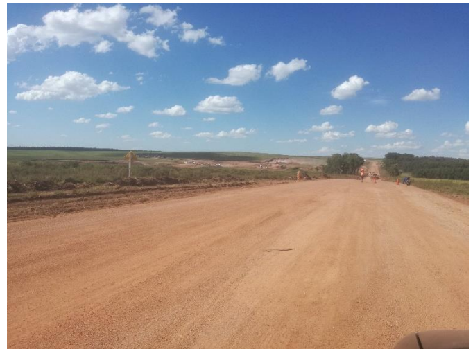
Foto 13.9-3 Frente de obra