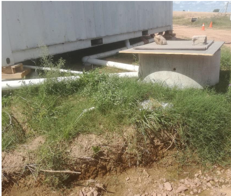
Foto 13.2-1 Fosa séptica con pérdida.