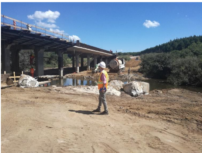
Foto 13.9-1 Obra Pte. Ao. El Potrero