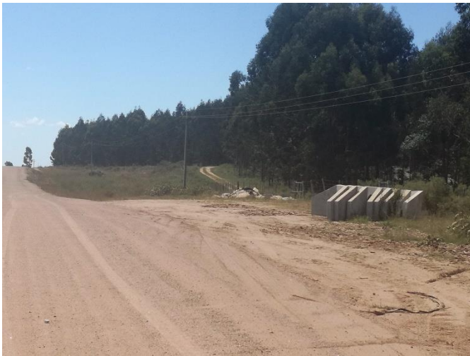
Foto 13.9-4 Acopio sobre faja Ruta 7