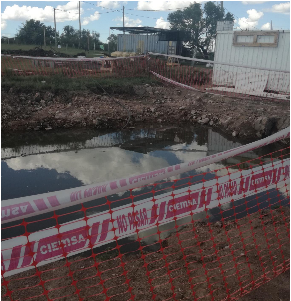
Foto 13.4-1 Fosa con agua estancada en mal estado.