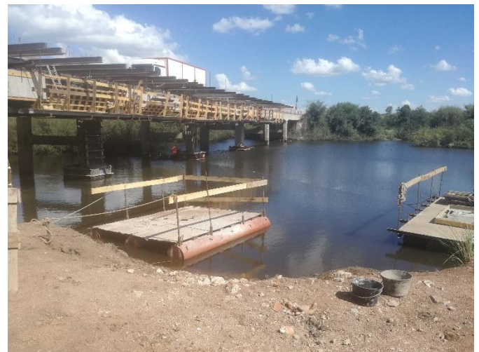
Foto 13.9-2 Obra Pte. Ao. Mansavillagra