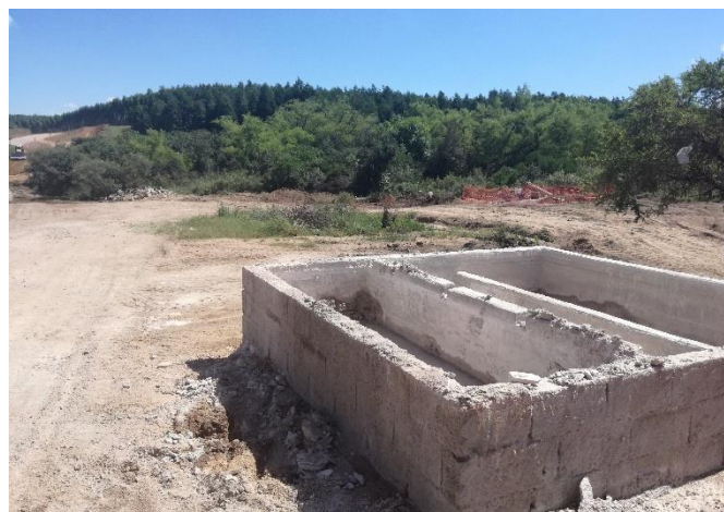
Fotos 13.1-2 Pileta de lavado de hormigón en zona inundable.