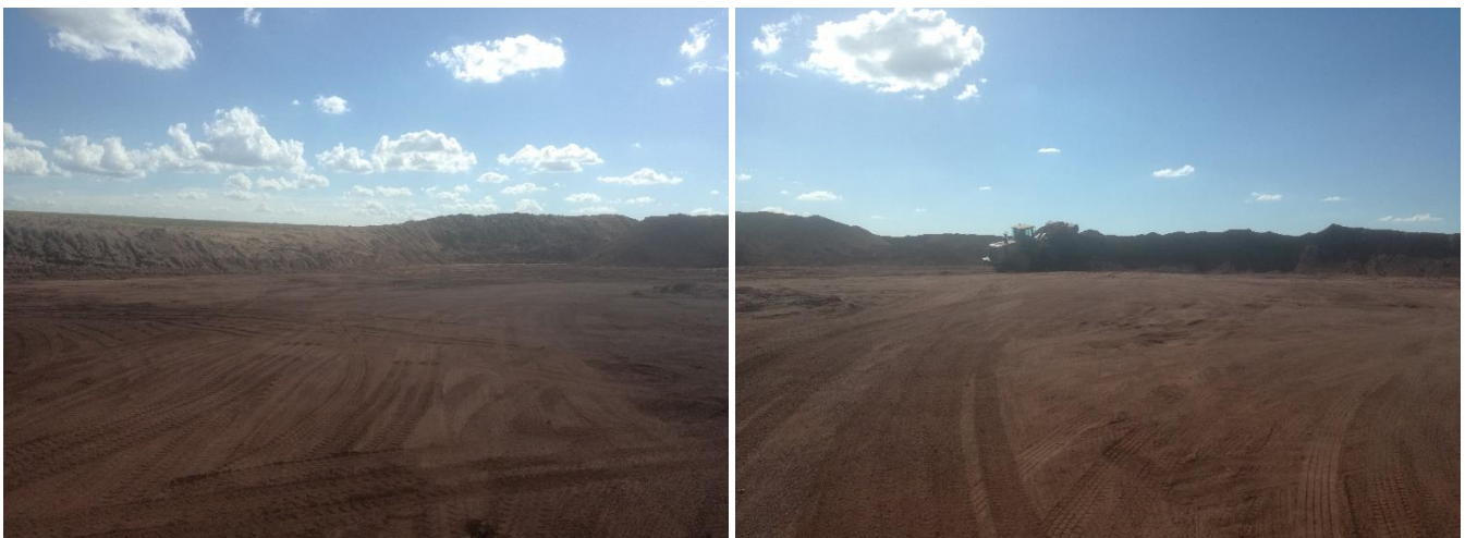
Foto 13.8-1 Cantera Obrador MELITER