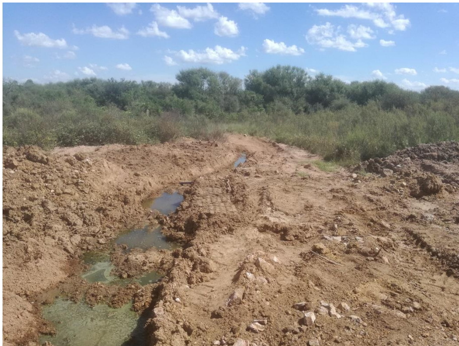
Foto 13.2-2 Derrame de aguas servidas hacia cauce del Ao. Paso Real de Mansavillagra