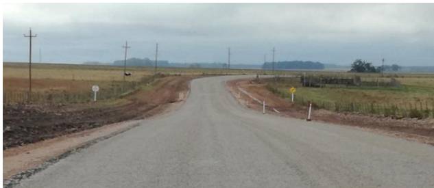
Foto 13.1-5 Vista 5 - Ruta 19