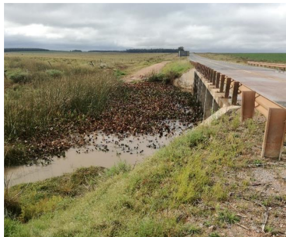
Foto 13.1-2 Vista 2 - R19 - Arroyo Campamento