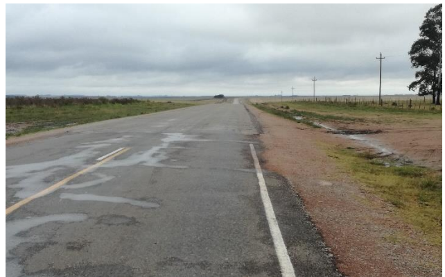
Foto 13.1-4 Vista 4 - Acopio transitorio