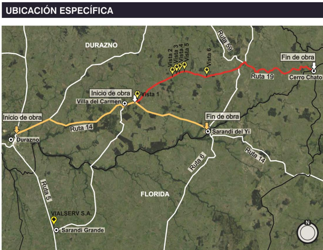
Figura 4.2-1 Lugares de interés