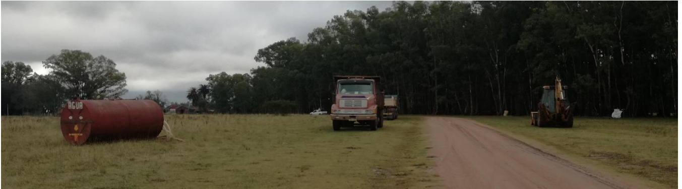
Foto 13.1-3 Vista 3 - Estacionamiento de equipos