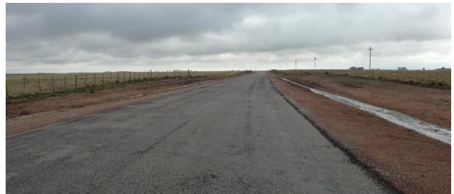
Foto 13.1-6 Vista 6 - Ruta 19