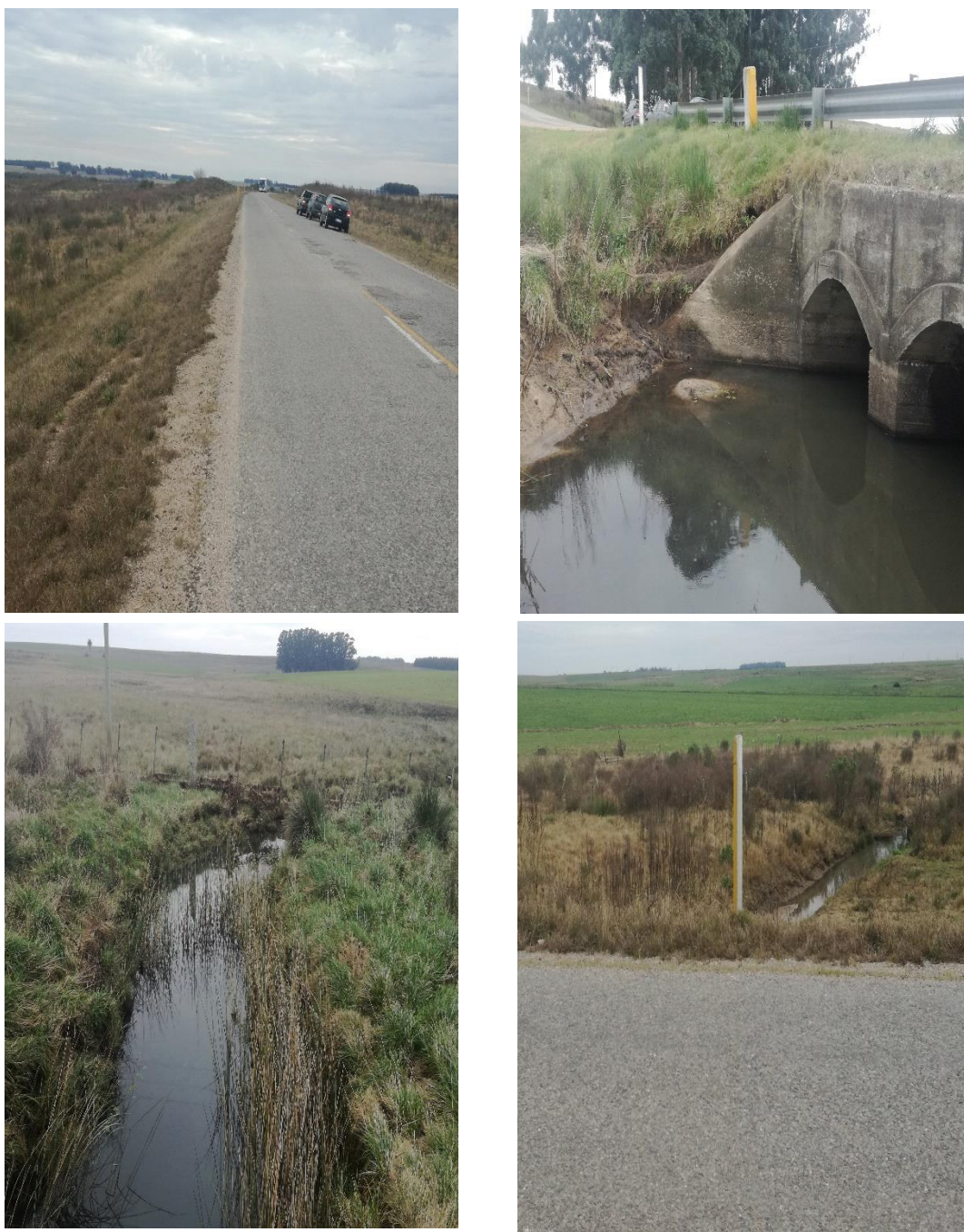
Foto 13-1 Vistas Ruta 6