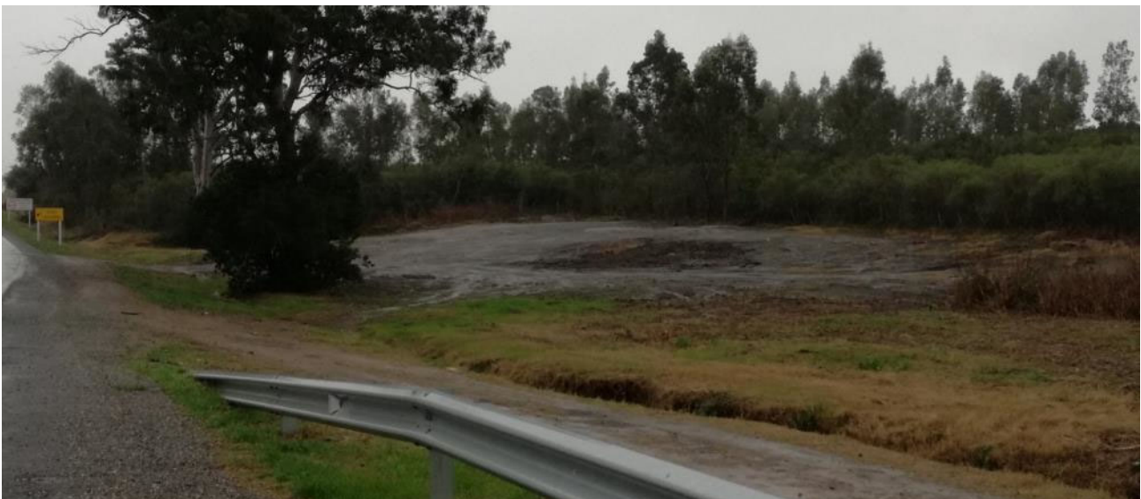
Foto 13.2-1 Puente Arroyo Agraciada, área sin recuperación ambiental.