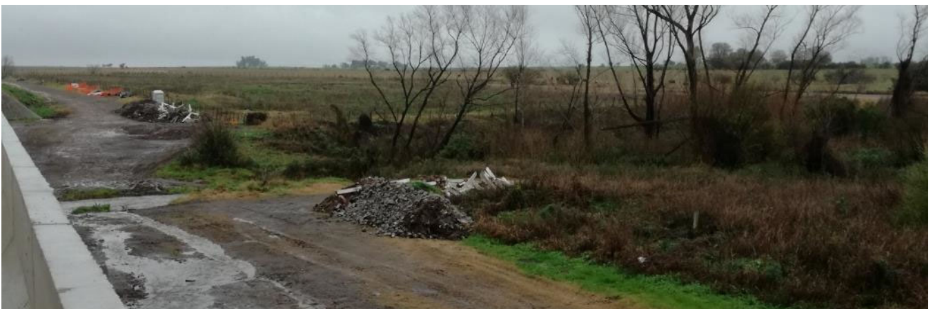
Foto 13.3-2 Puente Arroyo Bizcocho, residuos en área inundable