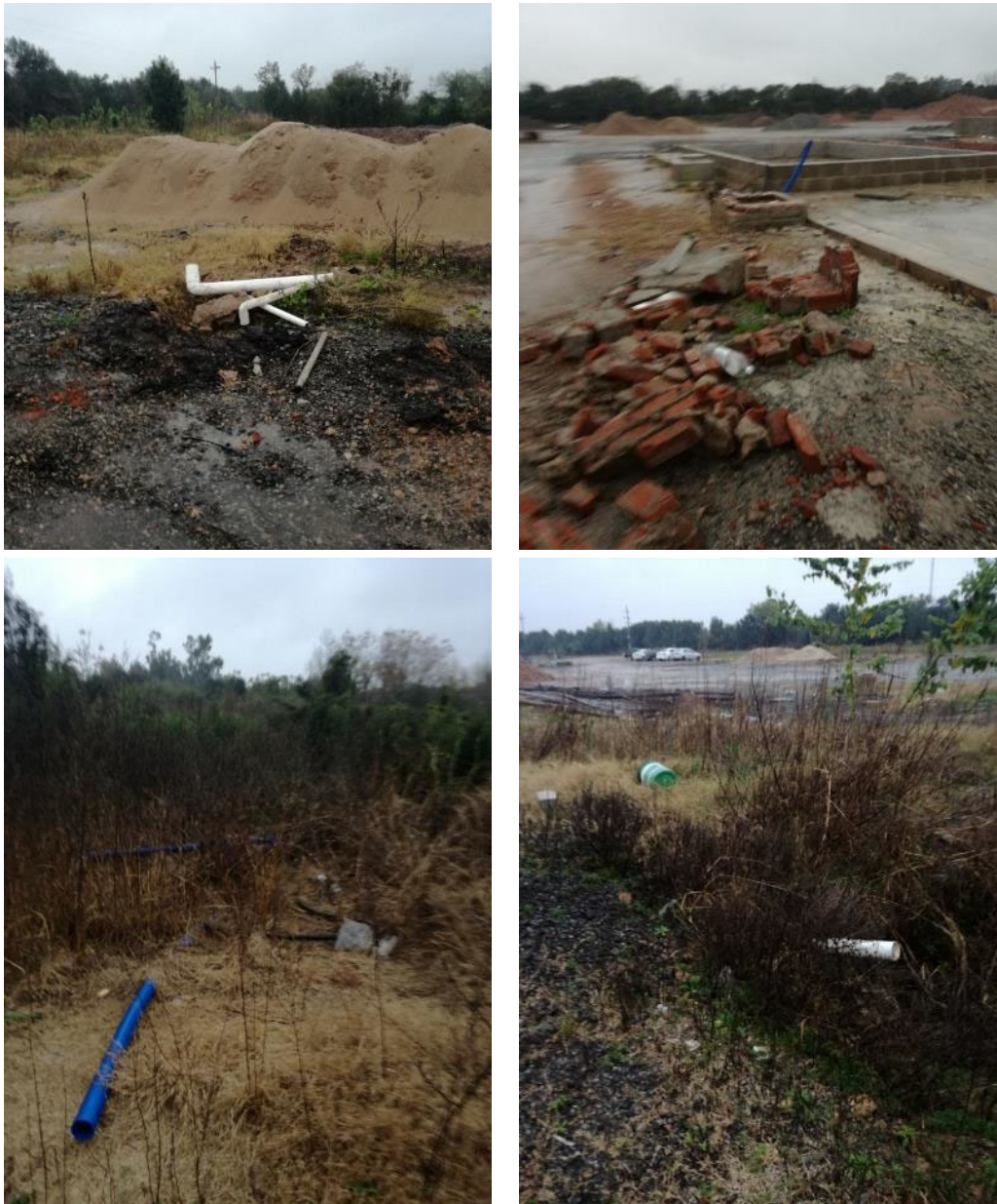
Foto 13.1-1 Restos de materiales en predio del Obrador ubicado en Cno. del Medio