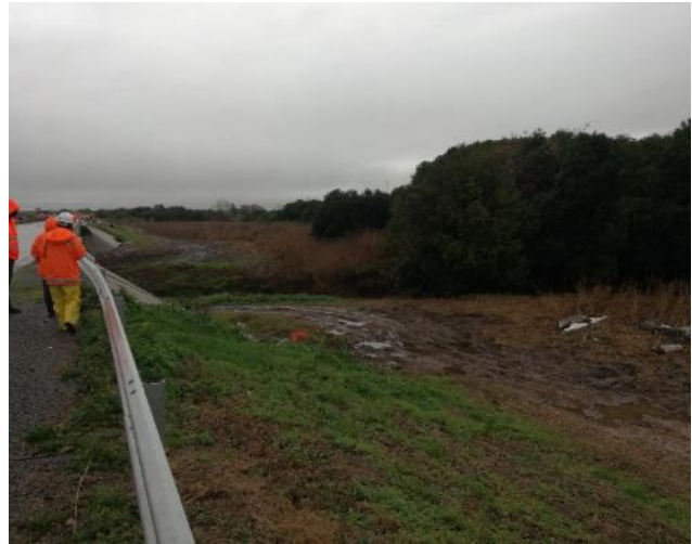
Foto 13.11-1 Puente Arroyo Arenal Grande