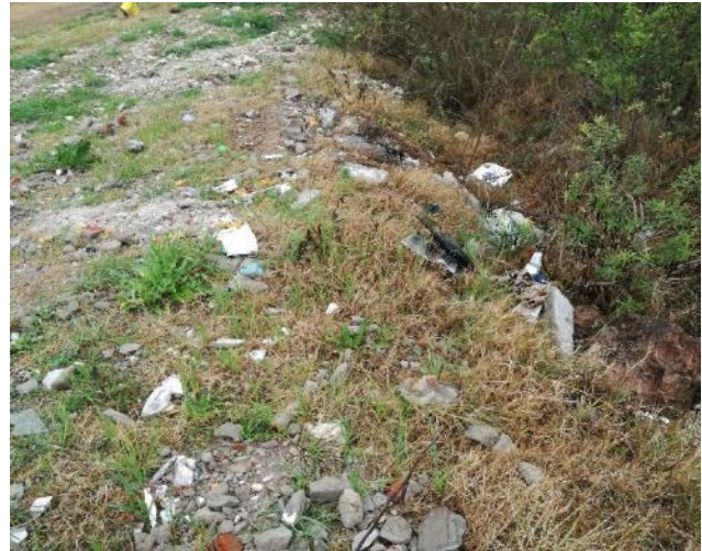
Foto 13.6-1 Puente Arroyo Daca_Ruta 21, residuos