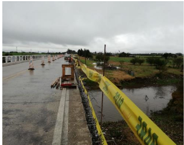
Foto 13.13-1 Puente Arroyo Magallanes