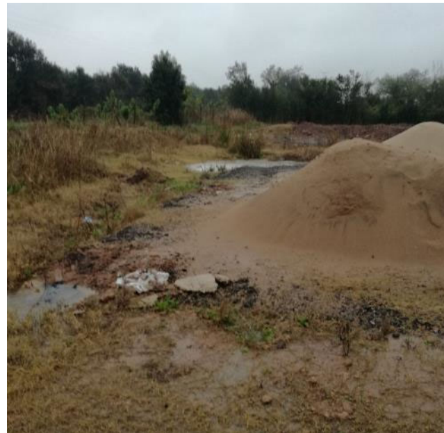
Foto 13.7-1 Obrador Camino del Medio_recuperación ambiental