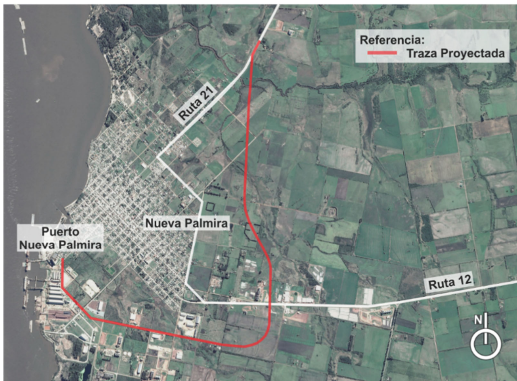
Figura 4.1-1 Ubicación general de la obra _By pass Nueva Palmira