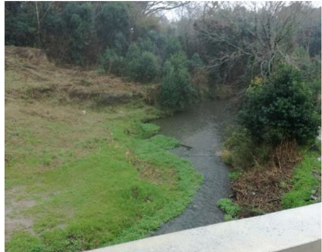
Foto 13.10-1 Puente Ruta 21 - Ao. Agraciada