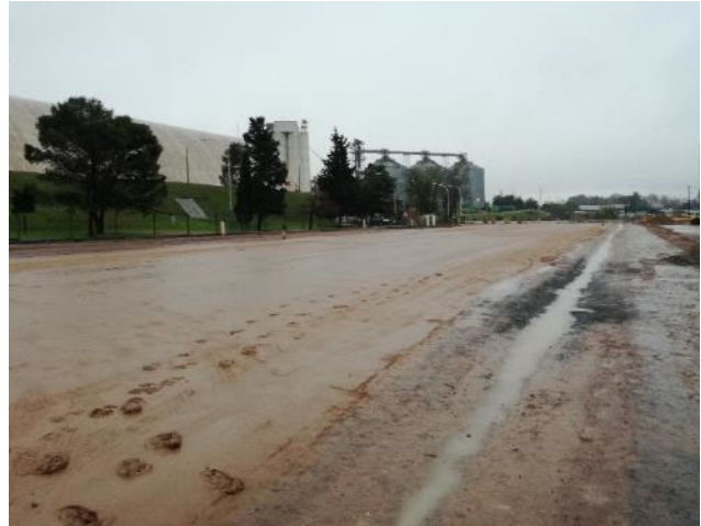
Foto 13.8-4 Vistas tramo de acceso a Puerto en obra.