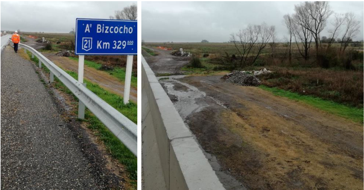
Foto 13.15-1 Puente Arroyo Bizcocho