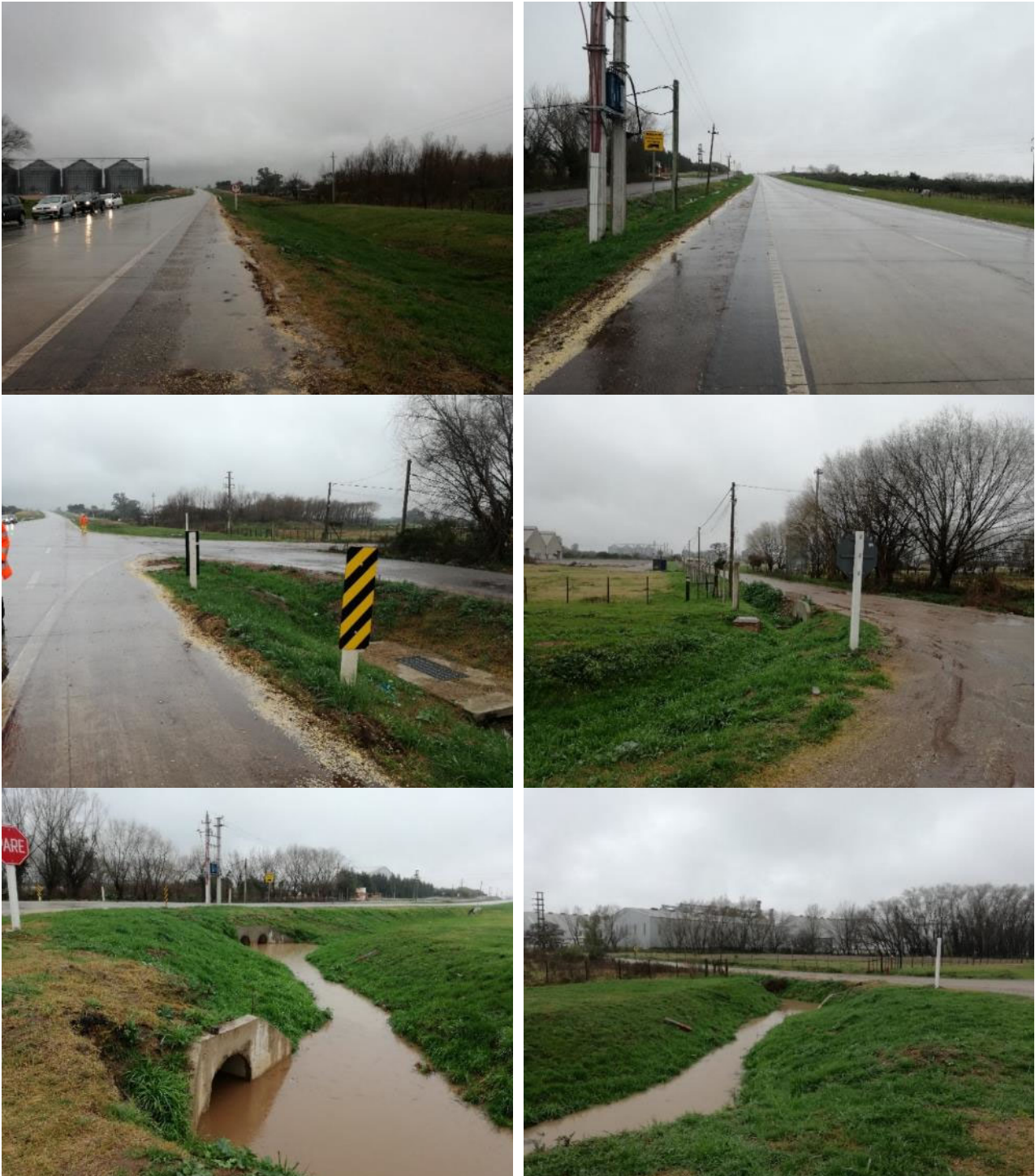
Foto 13.8-1 Vista 1 - Bypass Nueva Palmira