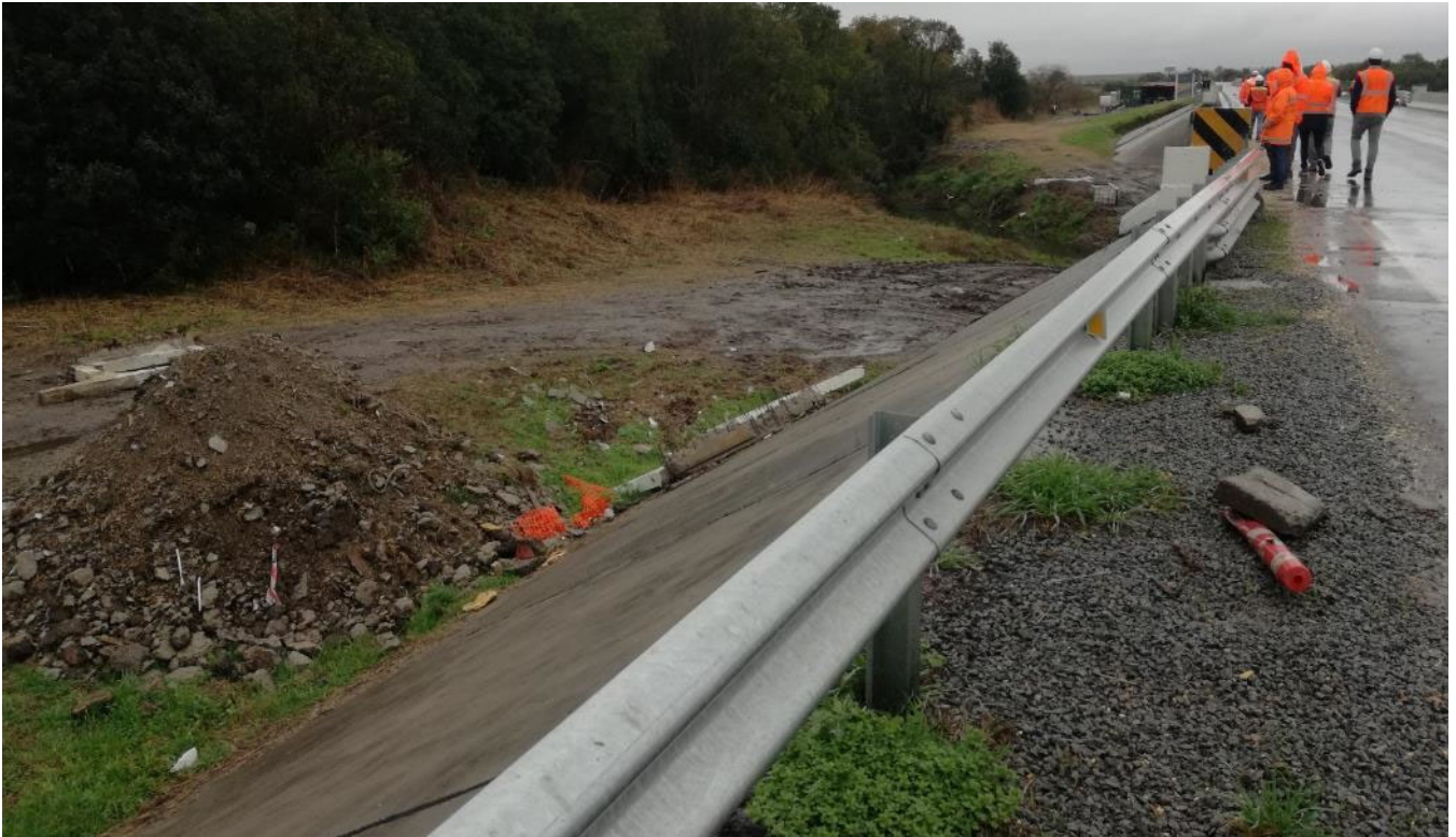
Foto 13.3-1 Puente Arroyo Arenal Grande, residuos en área inundable