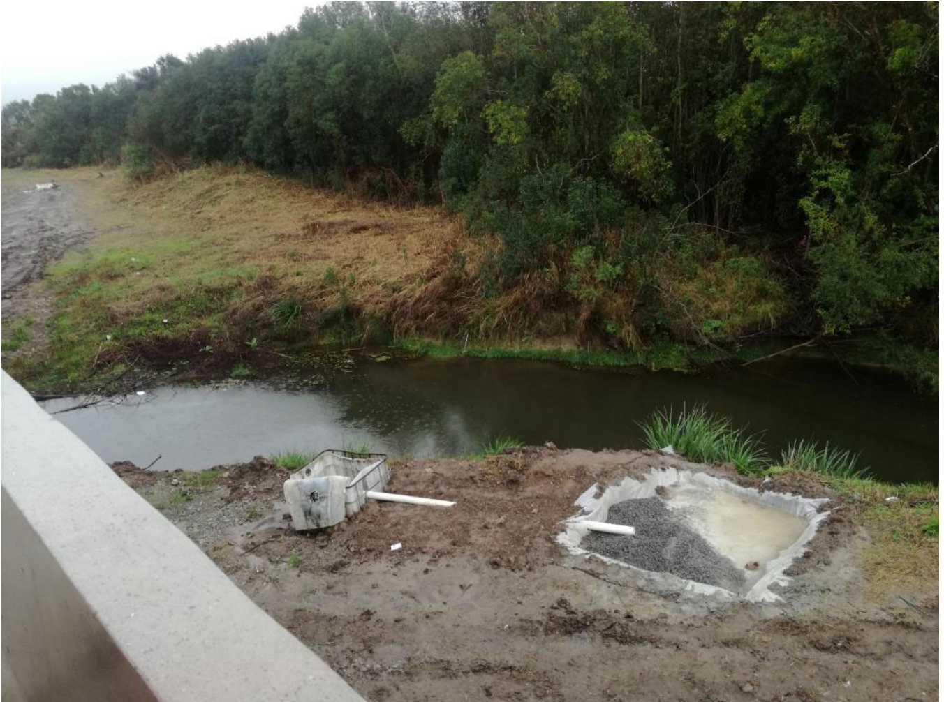
Foto 13.4-1 Puente Arroyo Arenal Grande, pileta de lavado de hormigón