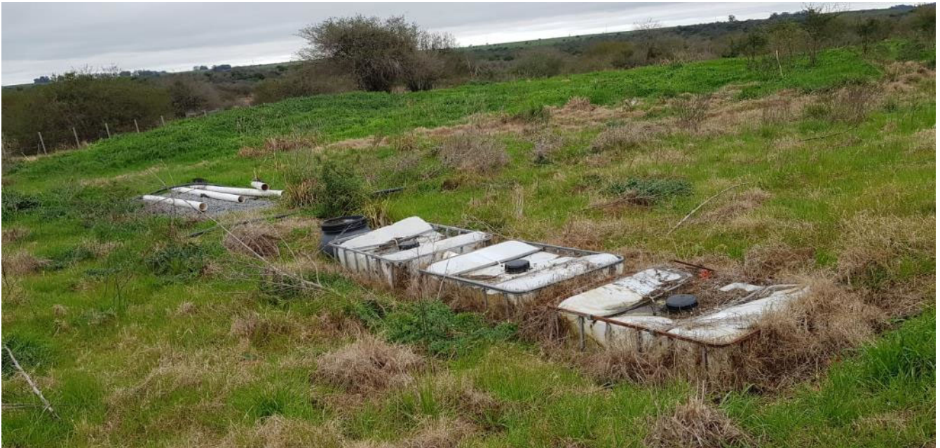
Foto 13.1-2 Restos de estructuras en Obrador Ruta 24