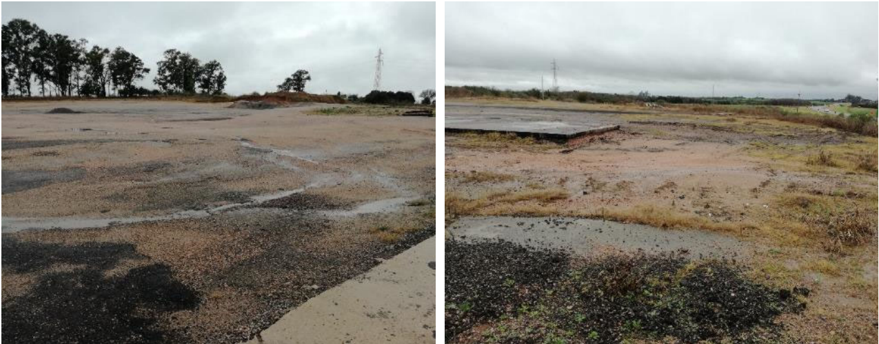
Foto 13.14-1 Predio Planta asfáltica Dolores