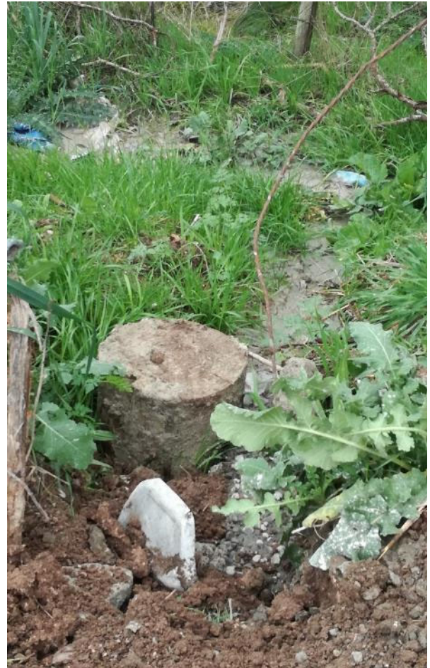
Foto 13.5-1 Puente Arroyo Negro_ derrame lavado de hormigón