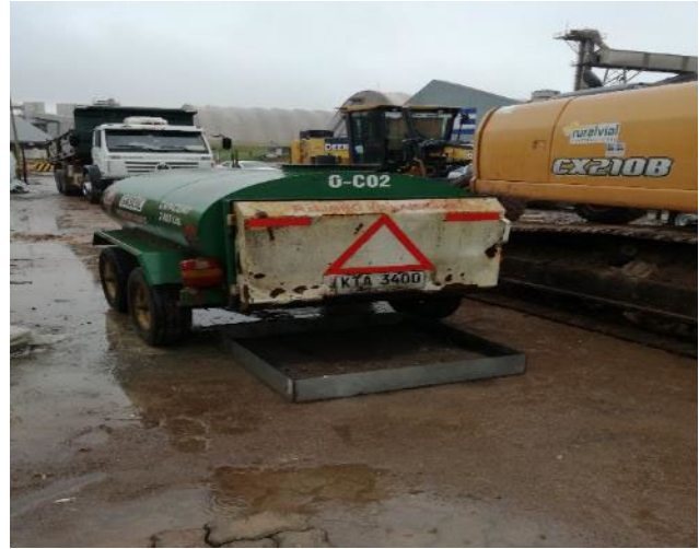
Foto 13.9-1 Vistas Obrador acceso a Puerto