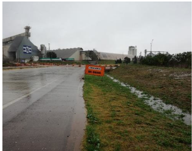
Foto 13.8-3 Vista 3 - Bypass Nueva Palmira