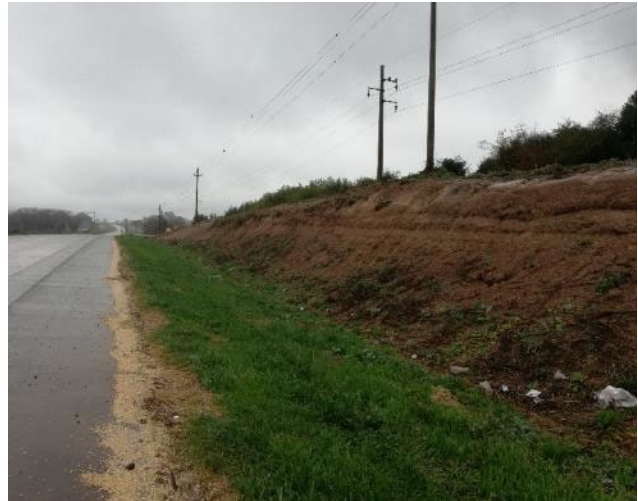
Foto 13.8-2 Vista 2 - Bypass Nueva Palmira