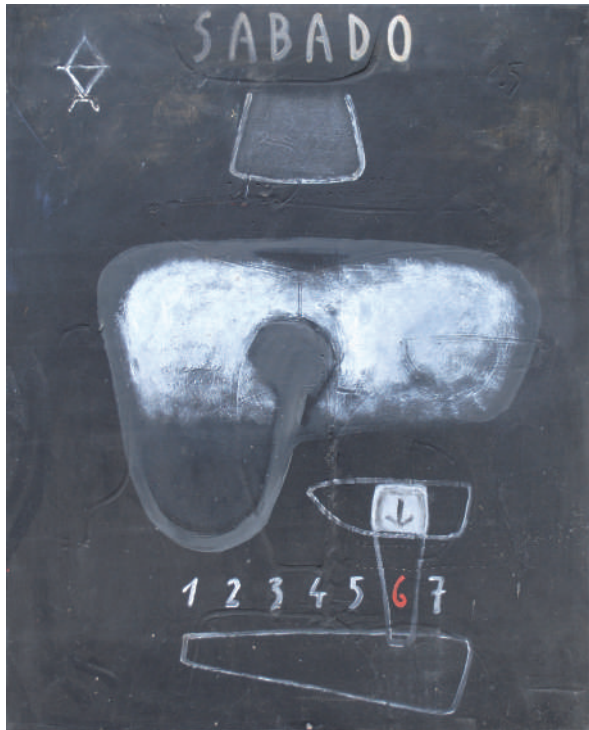
Noche fantasma 80 x 65 cm Técnica mixta