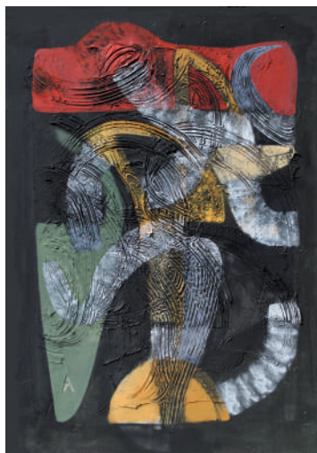
Humo de Jamaica 130 x 90 cm Técnica mixta

No es importante lo que obra signifique. Ella tiene su lenguaje que nos llegará directamente de un modo personal. Las definiciones externas no cuentan.