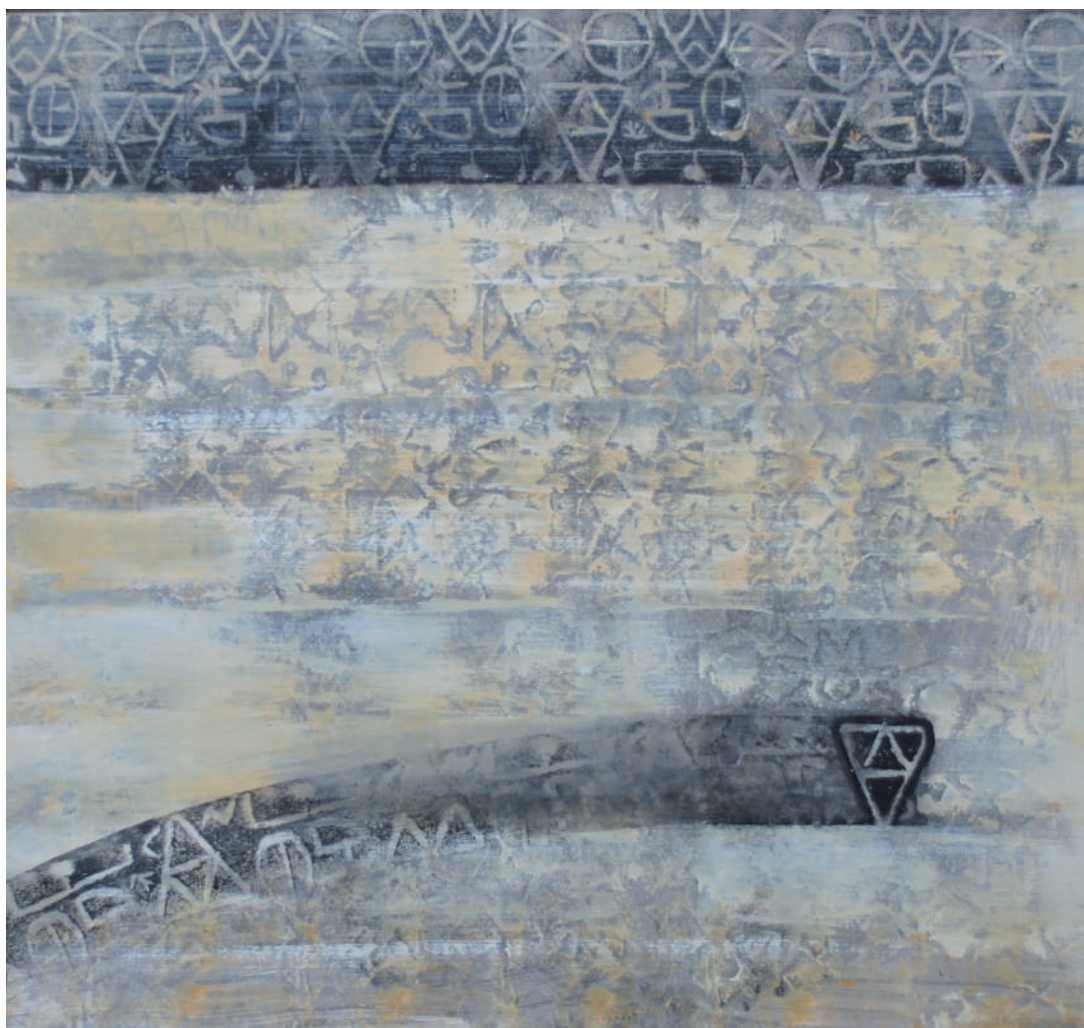
Terminando de subir 90 x 87 cm Técnica mixta