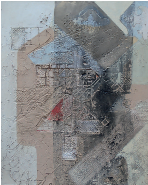
Algo queda 80 x 65 cm Técnica mixta