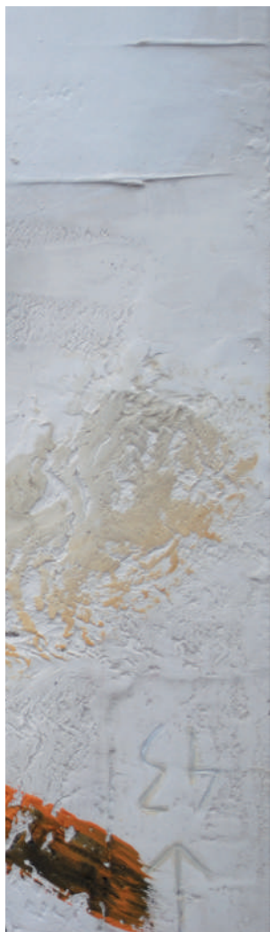
Lobizon 80 x 65 cm Técnica mixta