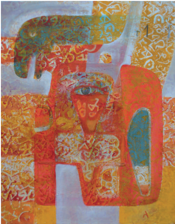
Ojo y reptil 90 x 73 cm Técnica mixta