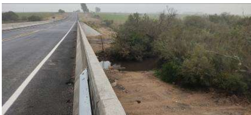
Foto 13.6-1 Puente Río San Juan