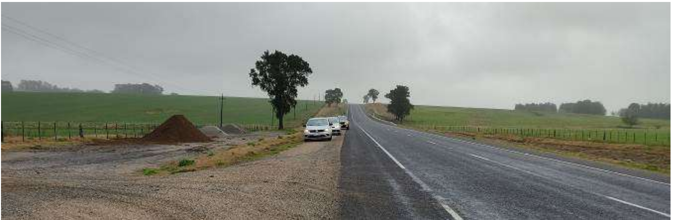
Foto 13.1-1 Vista 1. Acopios en faja