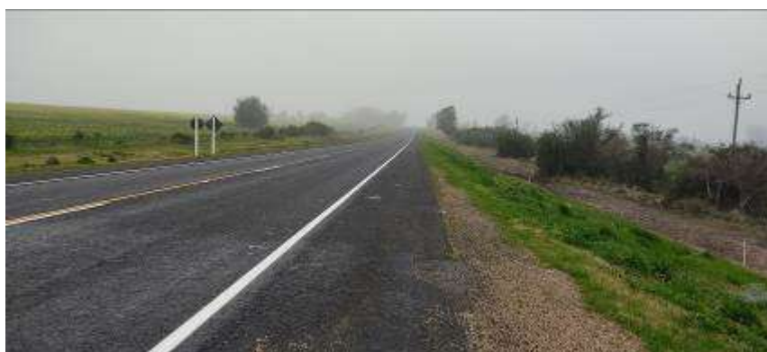
Foto 13.3-1 Vistas Ruta 54