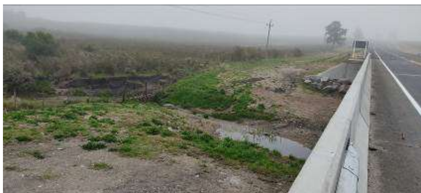
Foto 13.5-1 Puente Arroyo Sauce