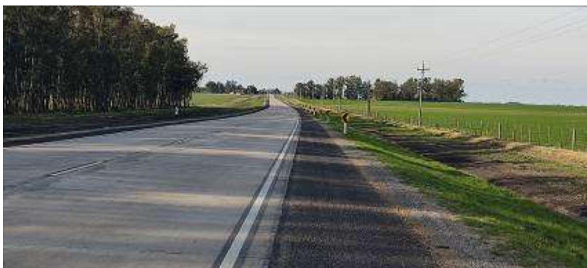
Foto 13.8-1 Vistas Ruta 55.