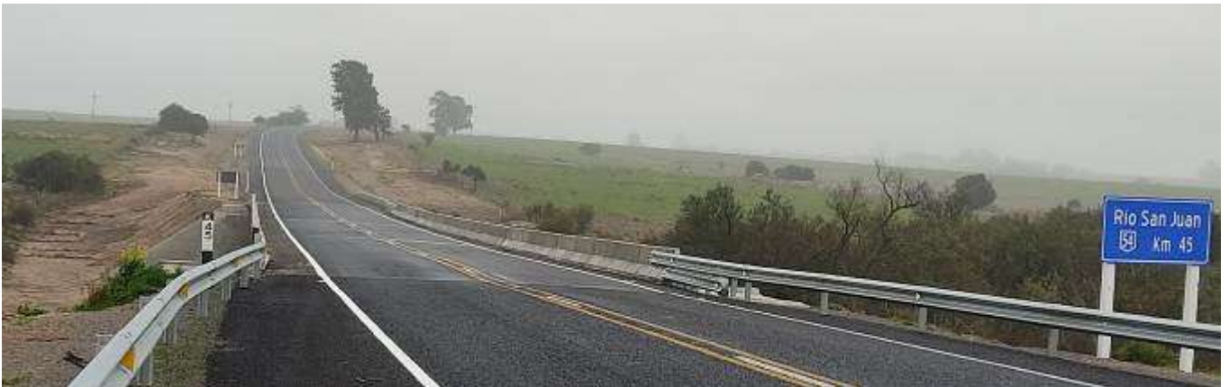
Foto 13.2-1 Erosiones en torno al Puente Ruta 54 - Río San Juan