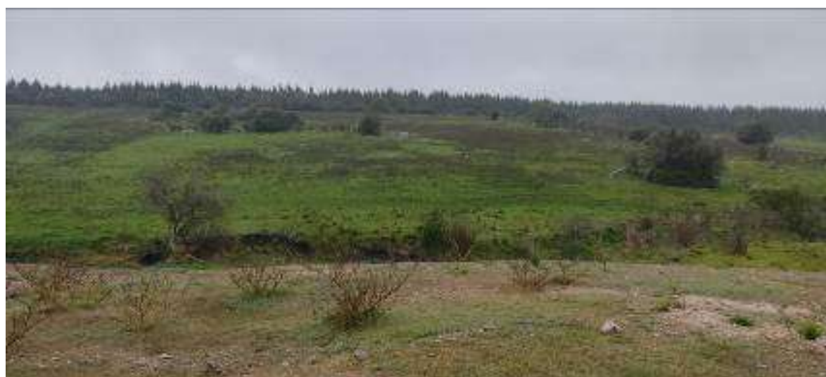
Foto 13.7-1 Disposición de material excedente del movimiento de suelos