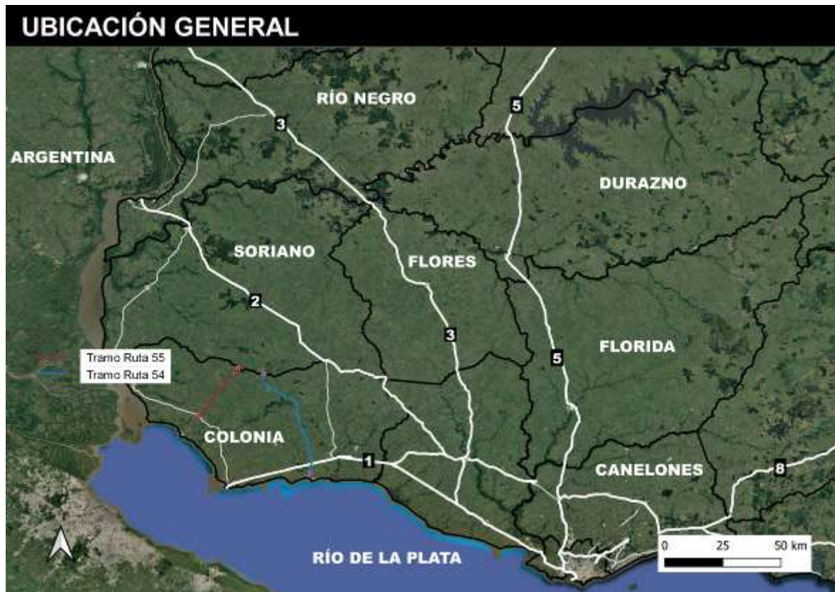
Figura 4-1 Ubicación de la obra.