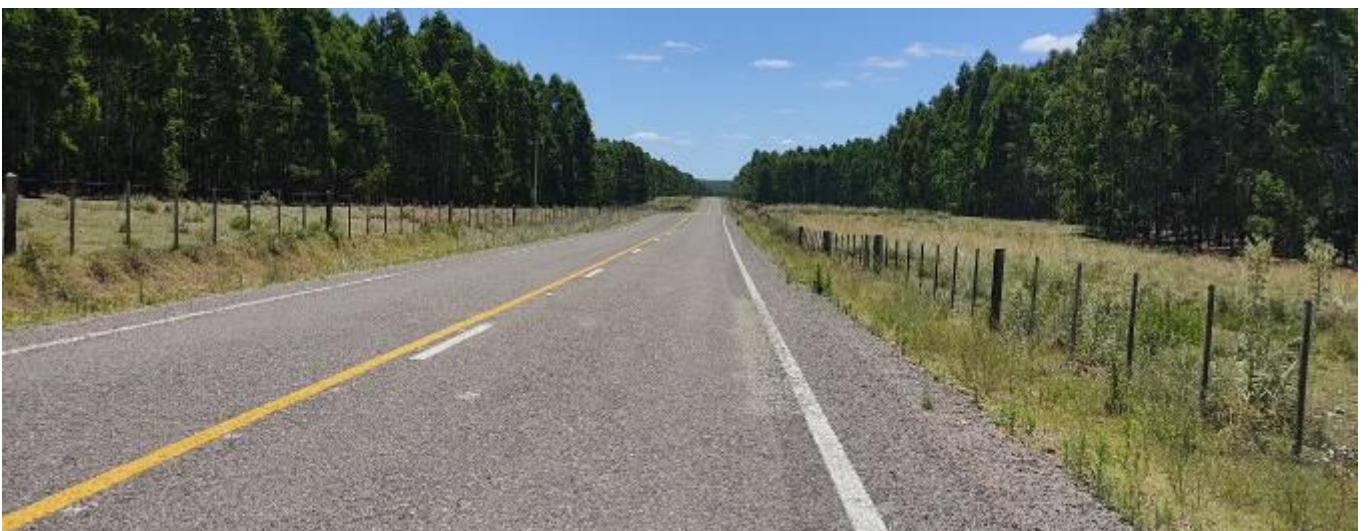
Foto 13.3-1 Vistas del tramo terminado