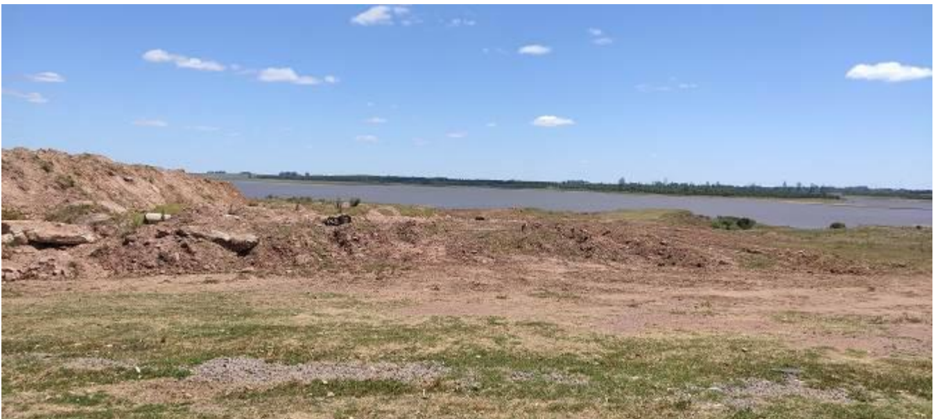
Foto 13.4-1 Vistas Cantera Padrón 11340