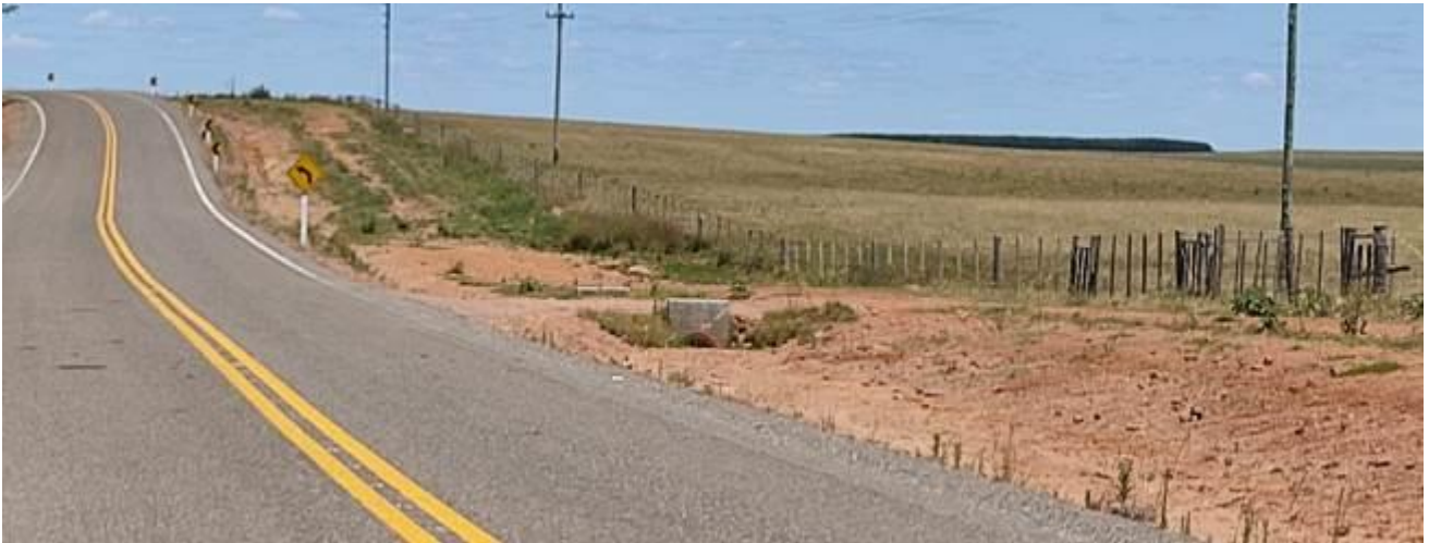
Foto 13.1-1 Vista 1 - Alcantarilla obstruida