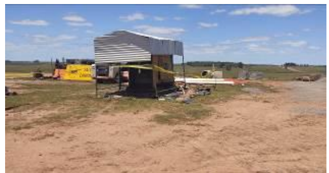
Foto 13.2-1 Obrador MELITER en etapa de retiro