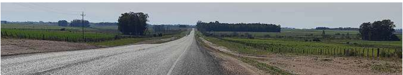
Foto 13.3-1 Vistas Ruta 57