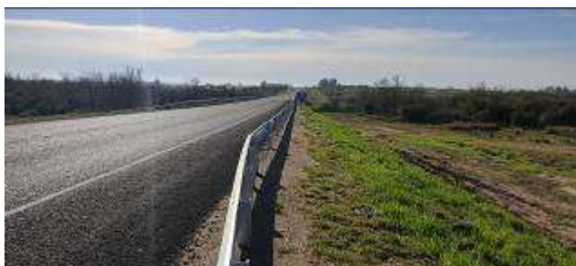
Foto 13.5-1 Puente Arroyo Grande