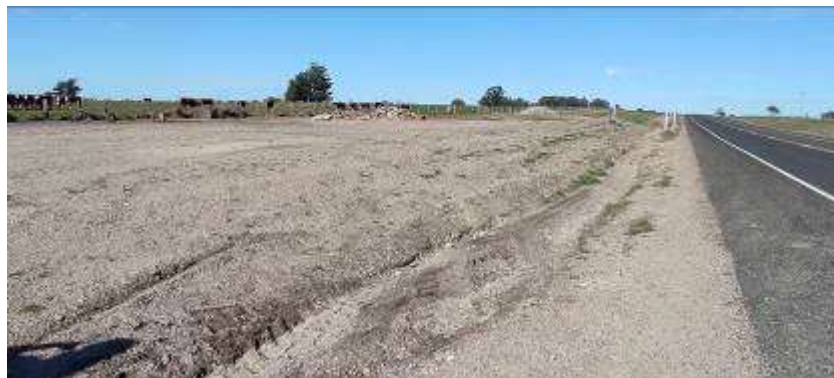
Foto 13.1-2 Acopios próximos Puente Arroyo Cerro de Ojosmin.