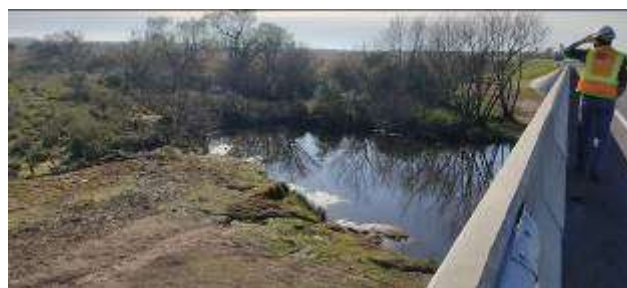
Foto 13.4-1 Puente Arroyo Monzón