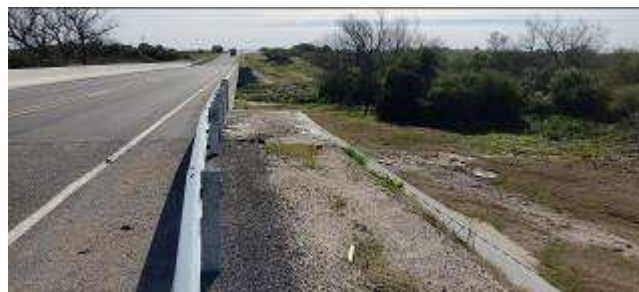
Foto 13.8-1 Puente Arroyo Guardia Vieja