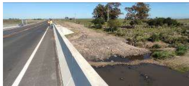
Foto 13.9-1 Puente Arroyo Sauce