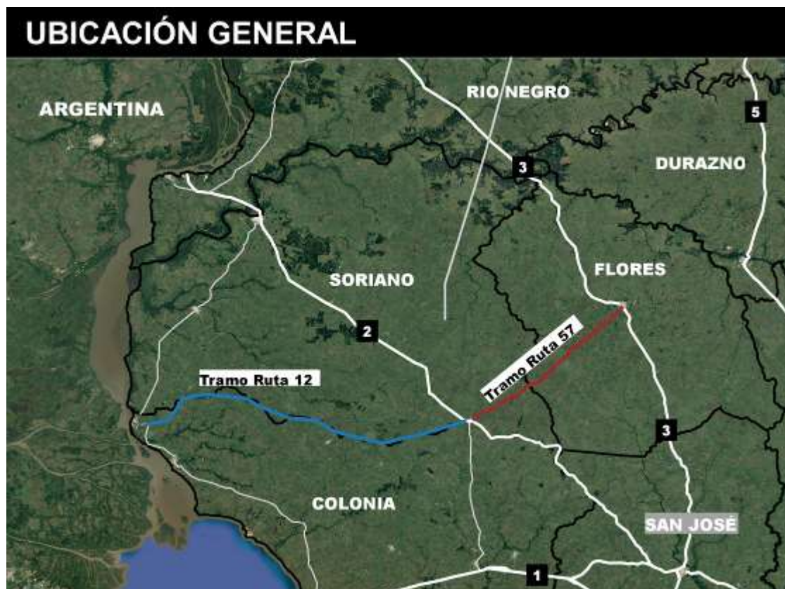
Figura 4-1 Ubicación de la obra.