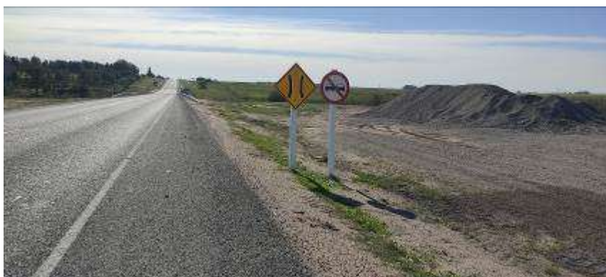
Foto 13.1-3 Acopios próximos Pte. Arroyo Sauce