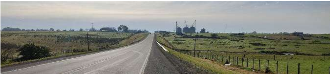
Foto 13.2-1 Vistas Ruta 12