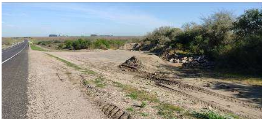
Foto 13.1-1 Vta 1 Acopios en faja Ruta 57