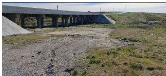
Foto 13.7-1 Puente Arroyo Cerro de Ojosmin