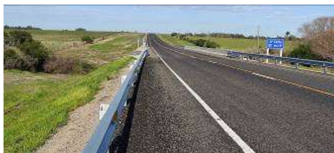
Foto 13.6-1 Puente Arroyo Talita