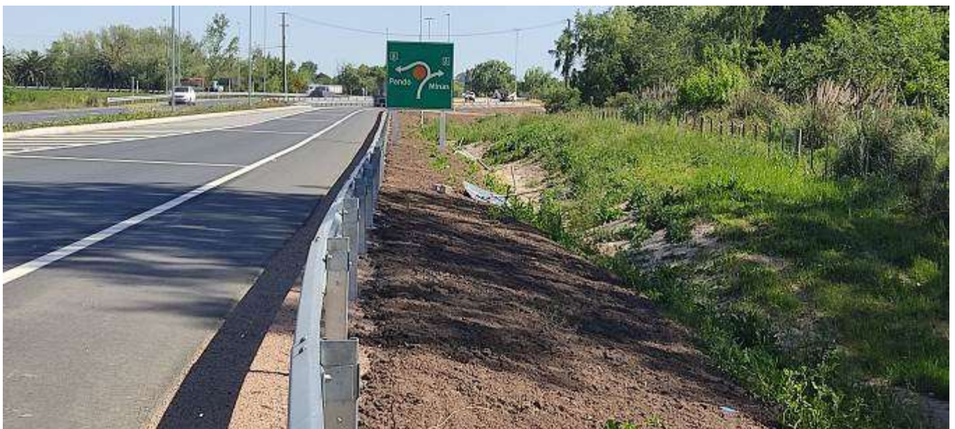
Foto 13.1-1 Vistas del By Pass a la Ciudad de Pando