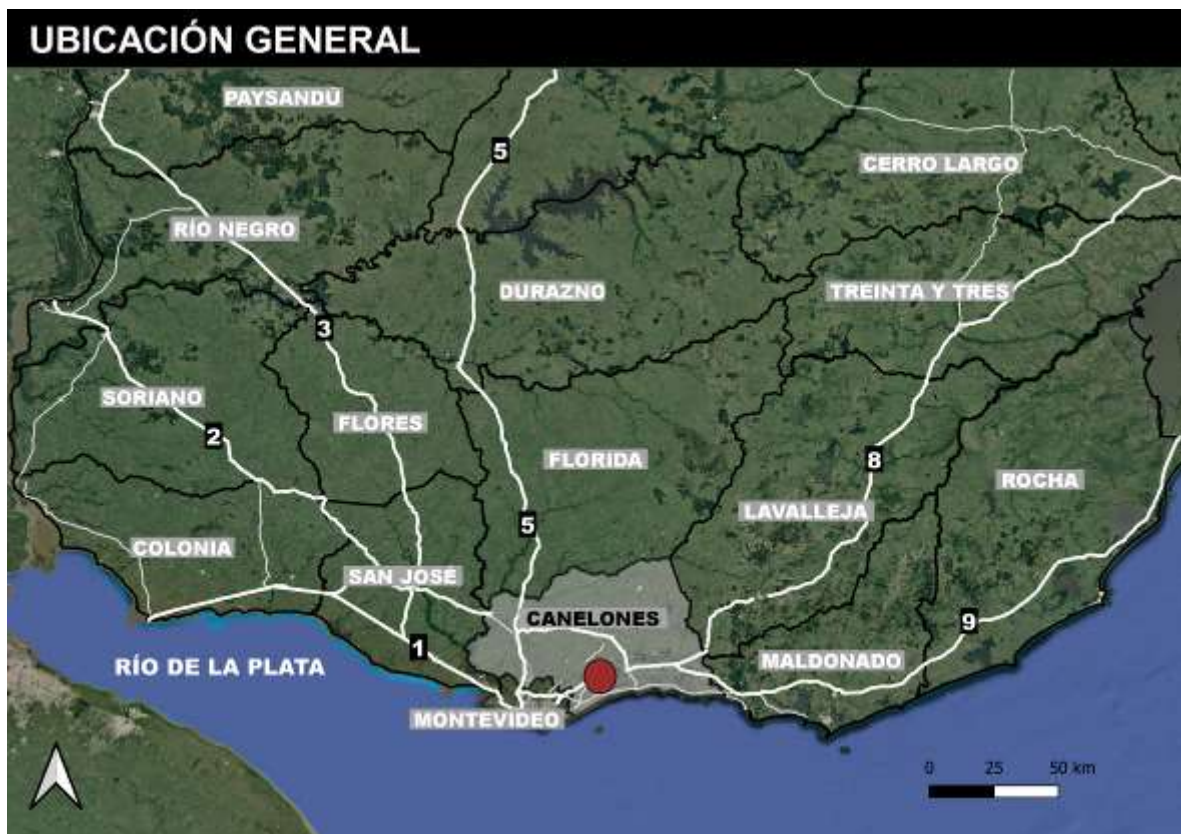
Figura 4-1 Ubicación general de la obra.