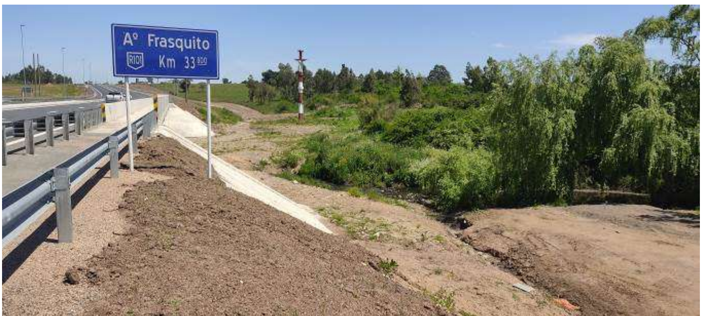
Foto 13.2-1 Vistas Puente Arroyo Frasquito