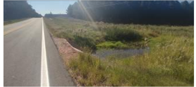
Foto 13.2-1 Vistas del tramo terminado.