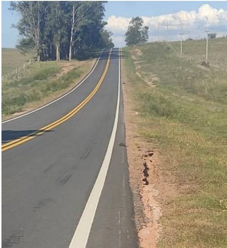
Foto 13.1-1 Vista 1. Erosión en banquina.