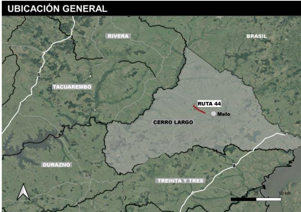
Figura 4-1 Ubicación de la obra.