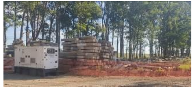
Foto 13.3-1 Obrador MELITER