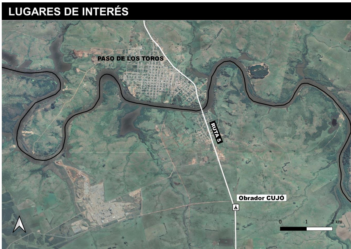
Figura 5-1 Lugares de interés