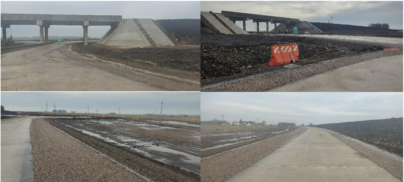
Foto 13.2-1 Vistas del entorno de la obra terminada.