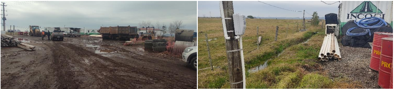
Foto 13.1-1 Vistas Obrador