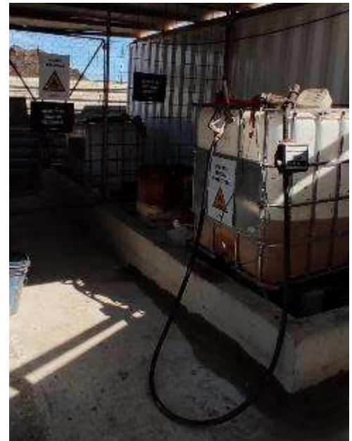
Foto 13.6-1 Vistas Obrador CIEMSA