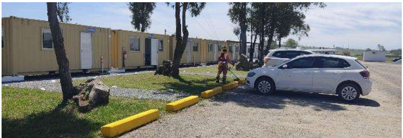
Foto 13.3-1 Obrador Secundario SERVIAM