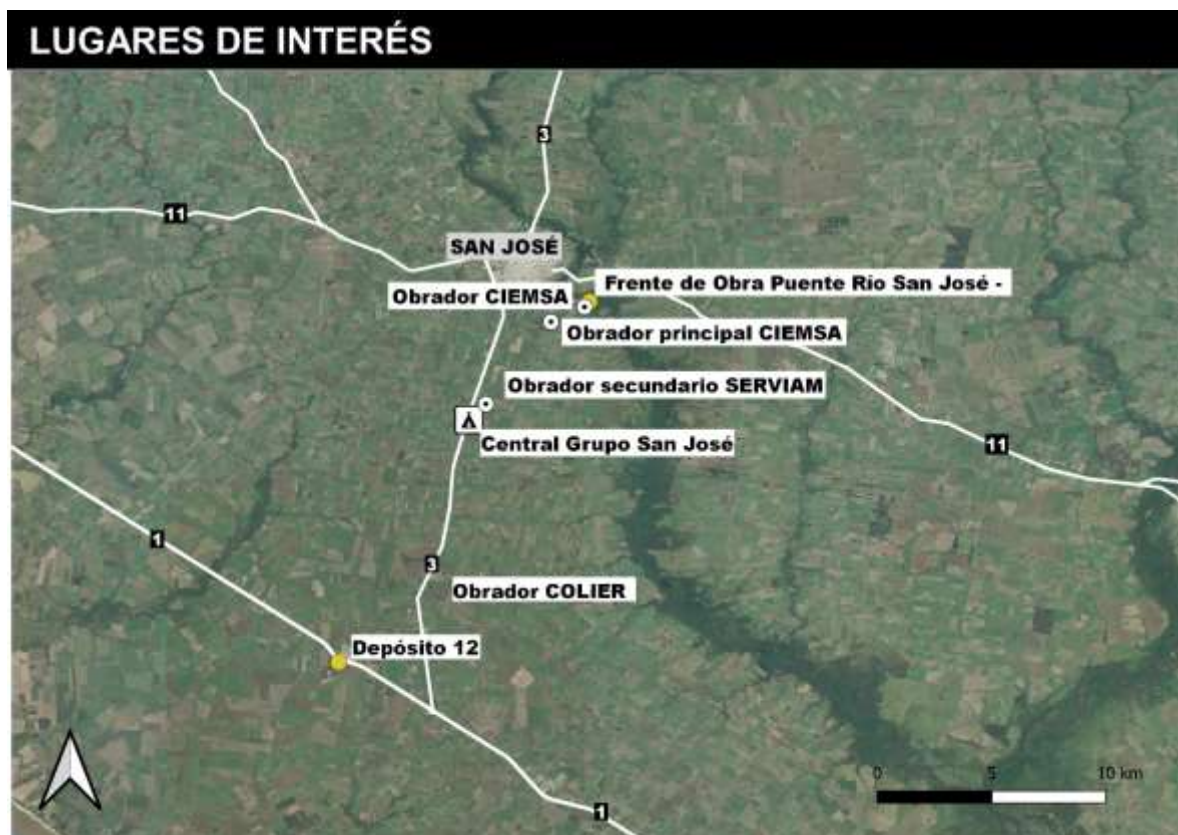
Figura 5-1 Lugares de interés de la obra.