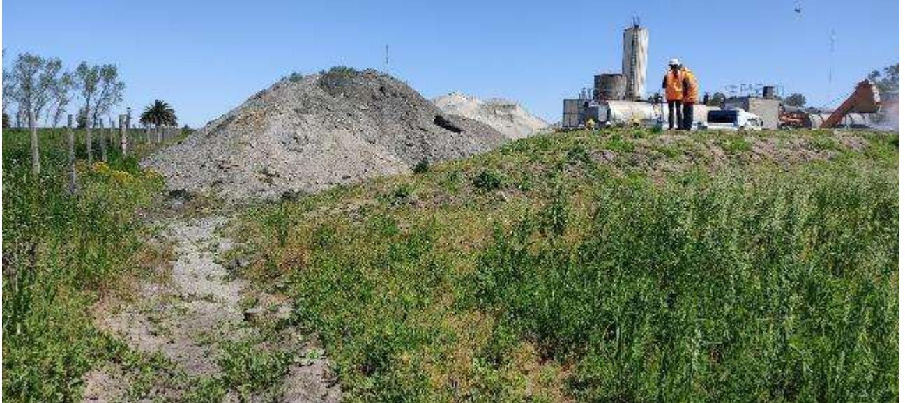
Foto 13.3-3 Riesgo de arrastre de materiales a terrenos vecinos.