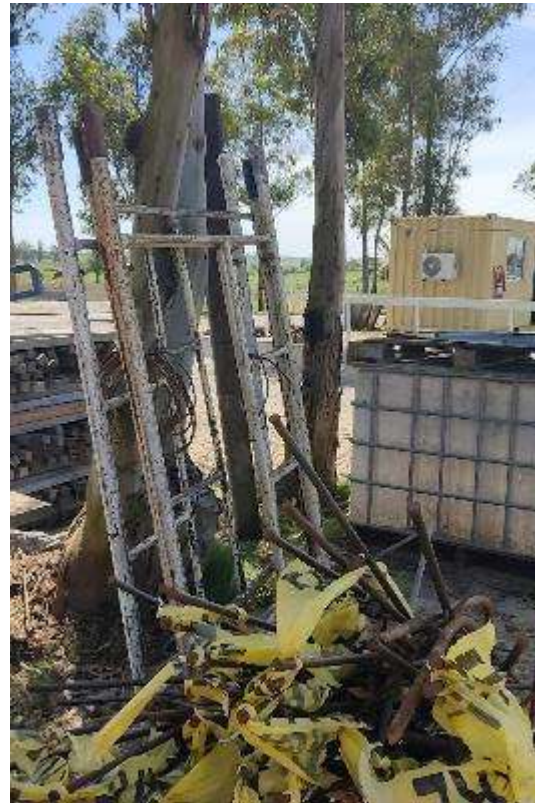
Foto 13.1-1 Estructuras apoyada en vegetación del lugar