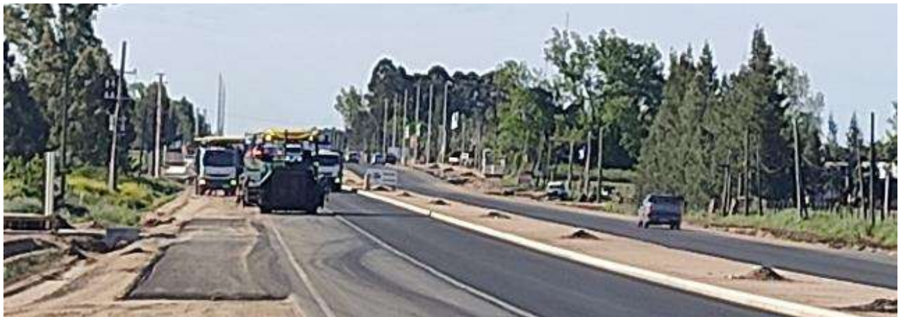
Foto 13.7-1 Recorrido por tramo en Obra de Ruta 3