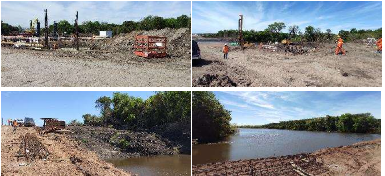
Foto 13.5-1 Vistas Frente de Obra Pte. San José