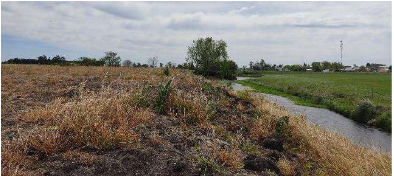
Foto 13.2-1 Predio 12 Disposición final de excedentes del movimiento de suelos