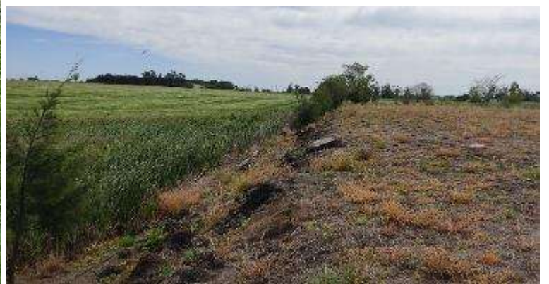
Foto 13.2-2 Algunos Restos de Estructuras en el entorno del Predio 12.