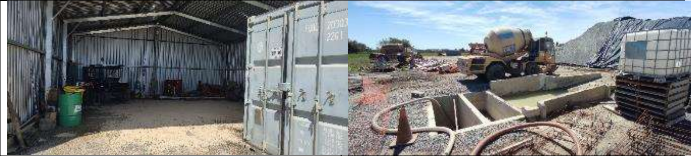
Foto 13.4-1 Vistas Obrador CVC