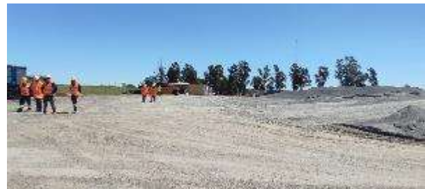
Foto 13.3-2 Vistas Obrador Secundario SERVIAM