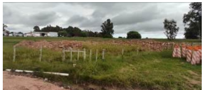
Foto 13.2-1 Vistas Predio