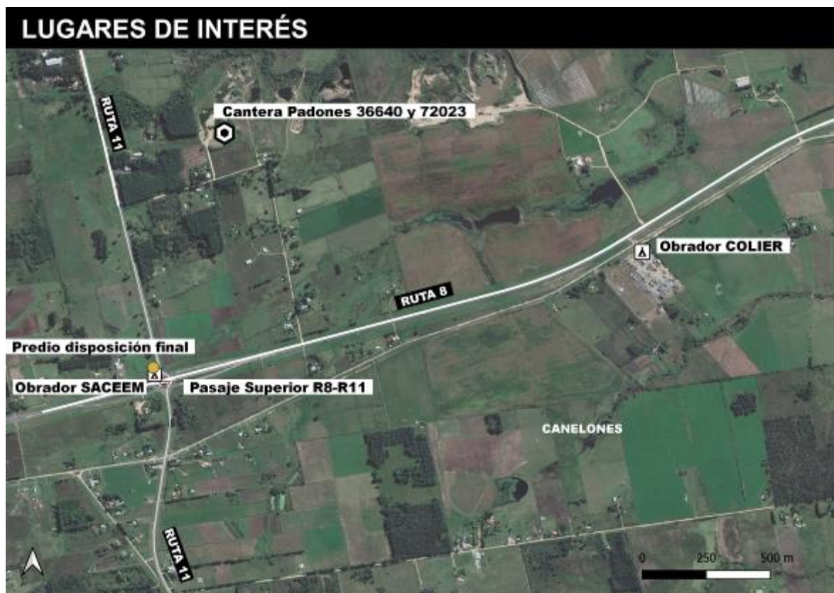
Figura 5-1 Lugares de interés i-iv