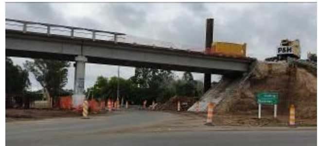
Foto 13.1-2 Vistas Frente de obra