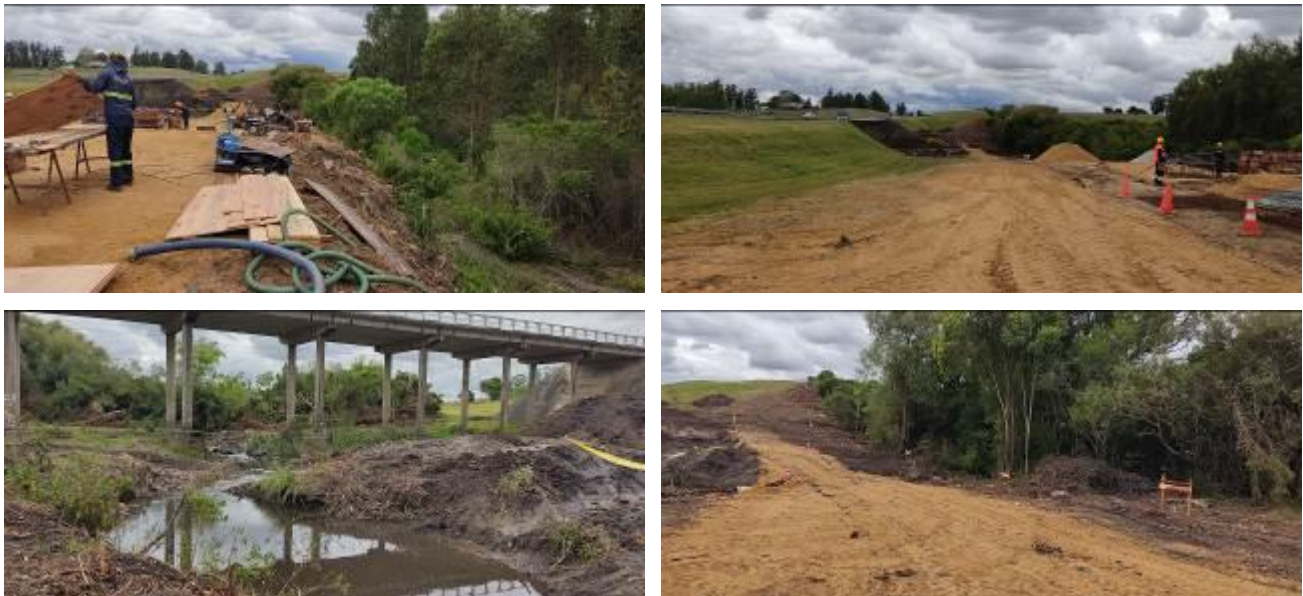
Foto 13.6-1 Vistas obrador y frente de obra.