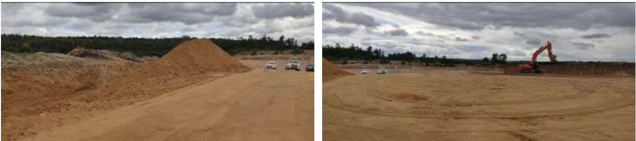
Foto 13.4-1 Vistas Cantera