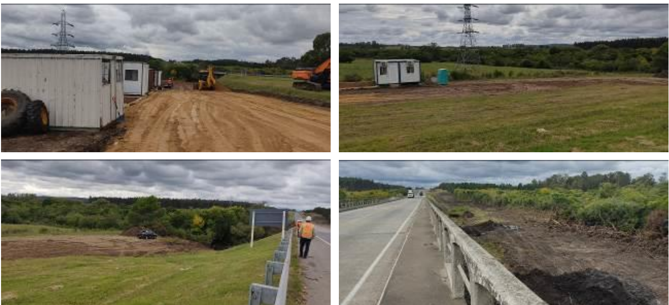
Foto 13.5-1 Vistas obrador y frente de obra