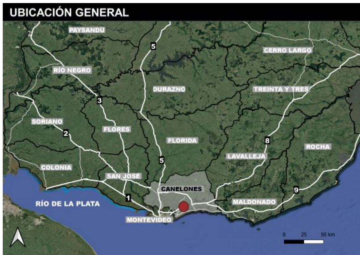
Figura 4-1 Ubicación general de la obra.

El puente se diseña en hormigón armado. Los ensanches se materializan demoliendo veredas, barandas y bordes de losas existentes para, a partir de ahí, ampliar el ancho de la estructura. Las modificaciones se realizan en dos etapas, dejando como mínimo una faja de circulación de 3.20 m lo que garantiza no interrumpir el tránsito.