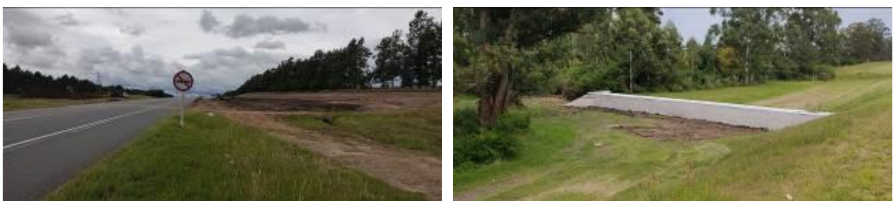
Foto 13.7-1 Vistas del tramo de Ruta 8 en obra