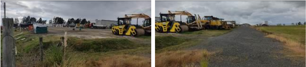
Foto 13.3-1 Vistas obrador