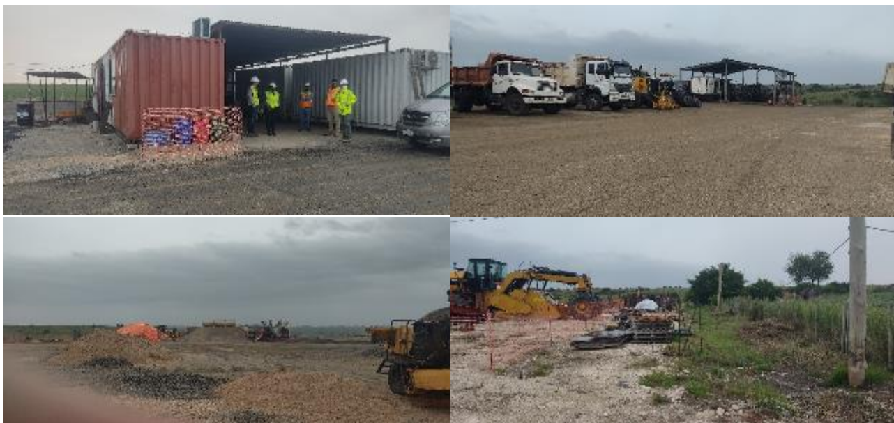
Foto 13.1-1 Vistas Obrador CUJÓ