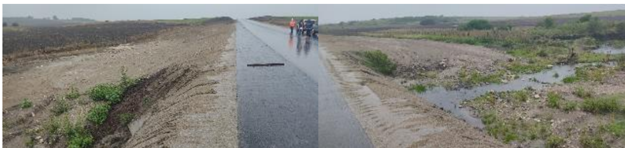
Foto 13.2-1 Entorno Puente Arroyo del Sauce