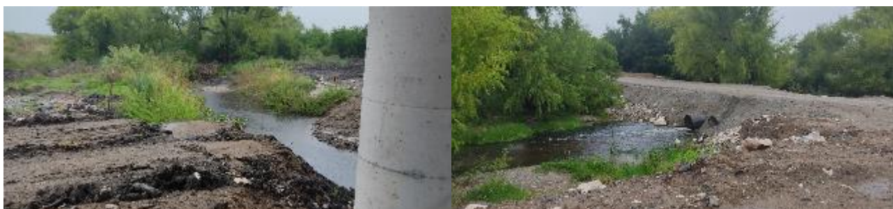
Foto 13.3-1 Vista entorno de obra Puente Arroyo Marincho