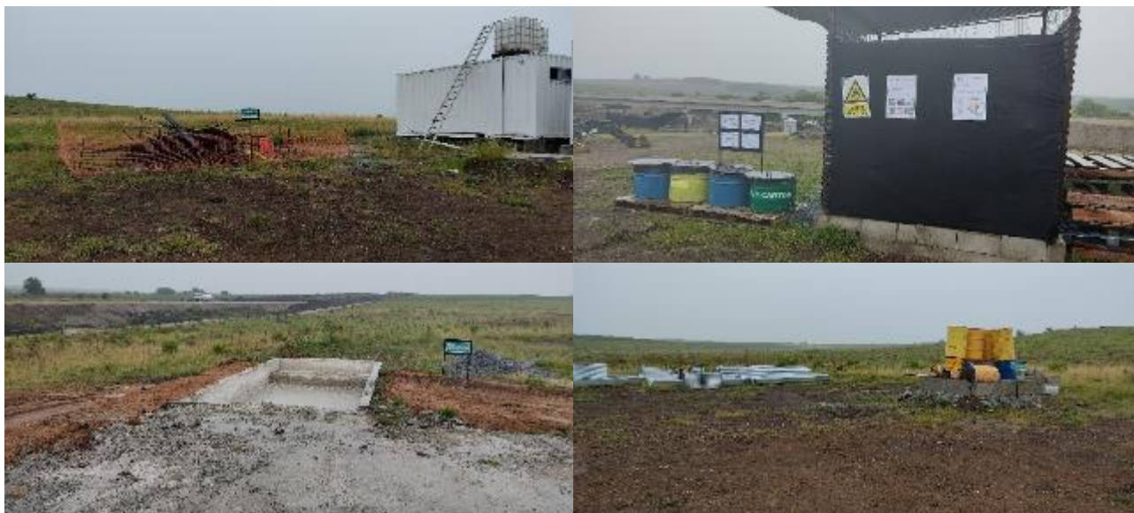
Foto 13.4-1 Vistas Obrador Espina