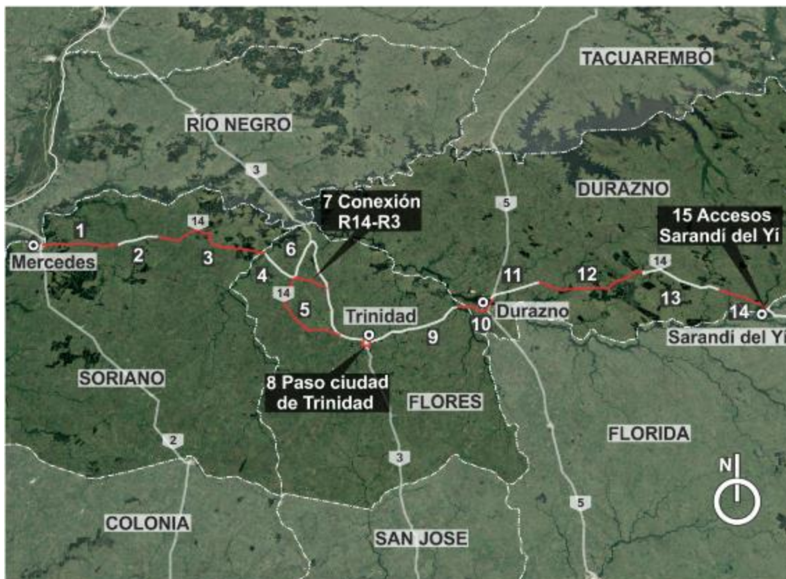
Figura 4-1 Ubicación general de la obra.

El alcance de esta auditoría corresponde a los frentes de obra de los Puentes en Arroyo Marincho y Arroyo del Sauce – Ruta 14