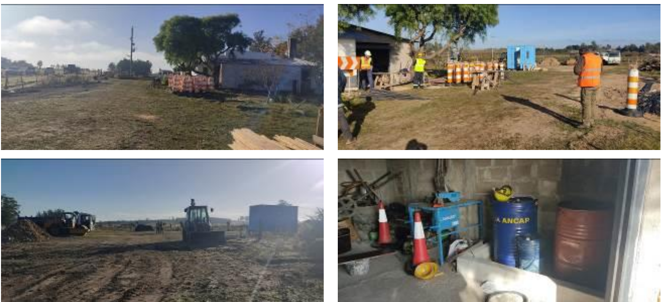
Foto 13.2-1 Vistas del Obrador