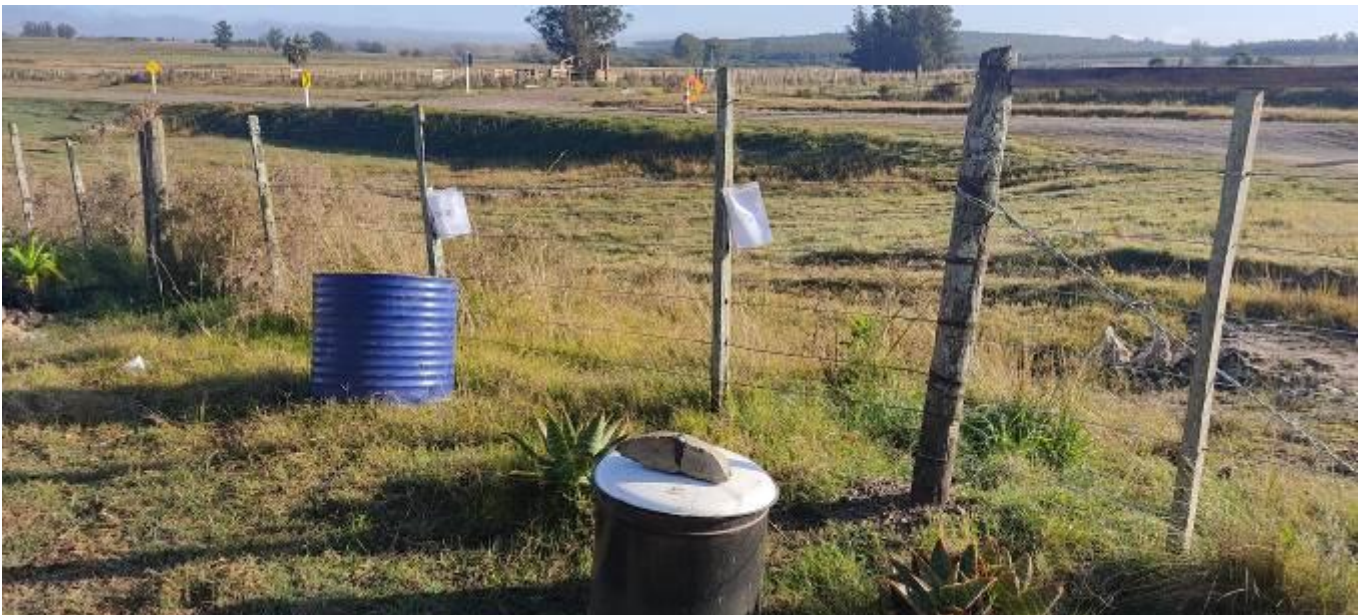
Foto 13.1-1 Infraestructura para disposición de residuos.