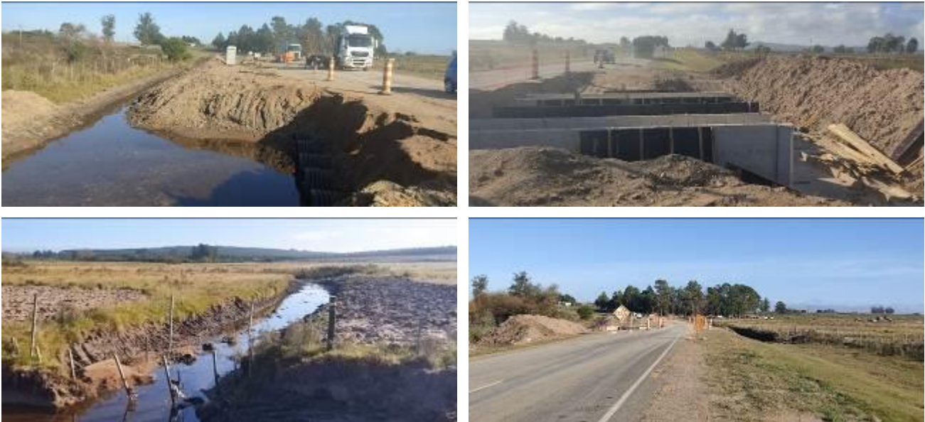
Foto 13.3-1 Vistas del Frente de Obra