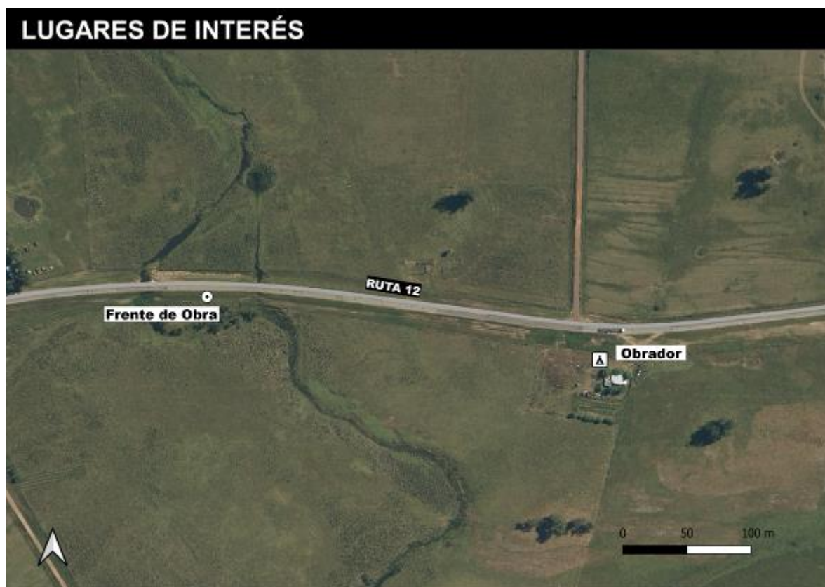
Figura 5-1 Lugares de interés