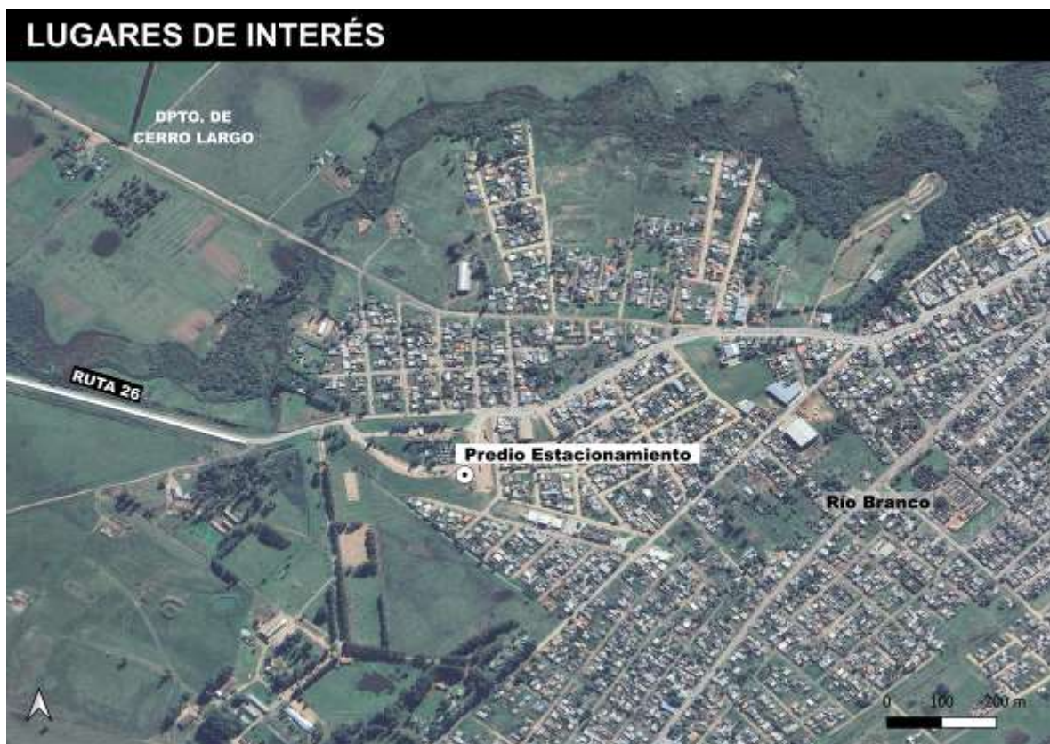
Figura 5-1 Lugares de interés.