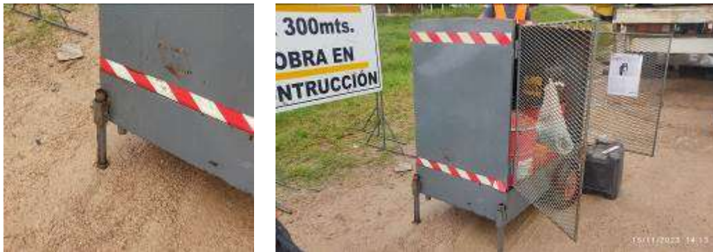
Foto 12.1-1 Depósito de hidrocarburos no estanco.