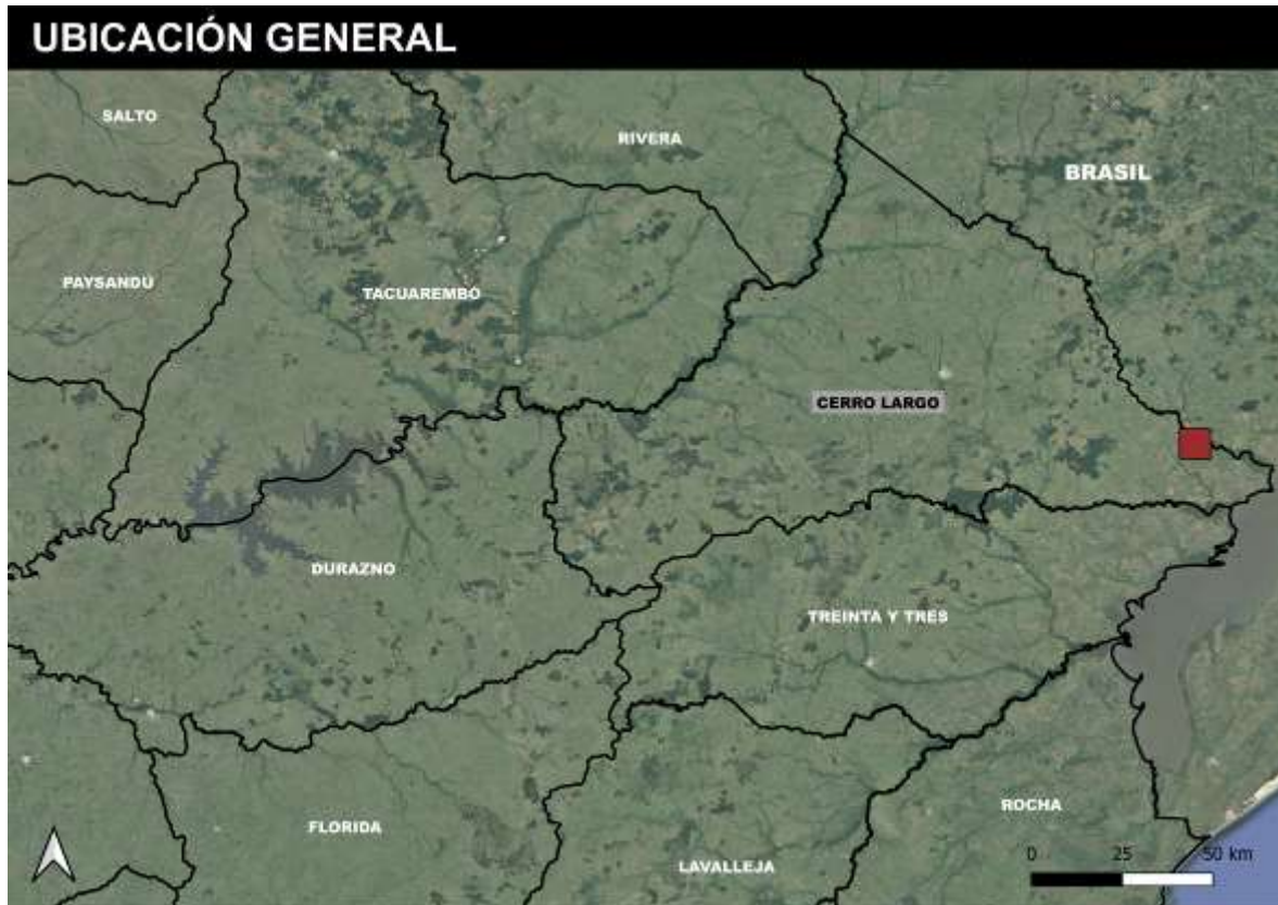
Figura 4-1 Ubicación de la obra