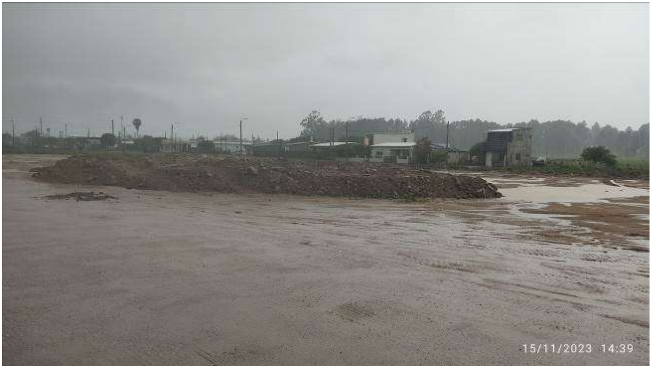
Foto 12.3-1 Vista del predio del Estacionamiento.