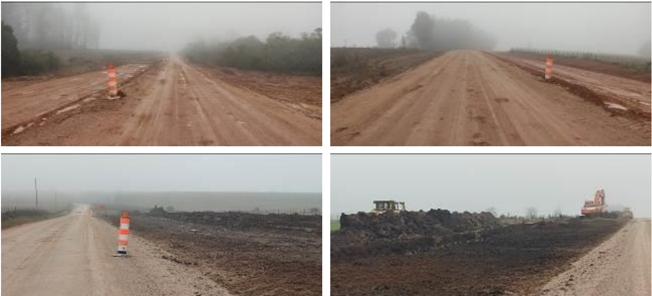
Foto 13.3-1 Vistas Ruta 14 entre Zapicán y Ruta 8