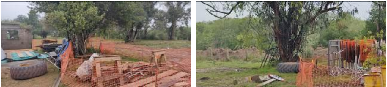
Foto 13.2-1 Estructuras apoyadas en vegetación existente.