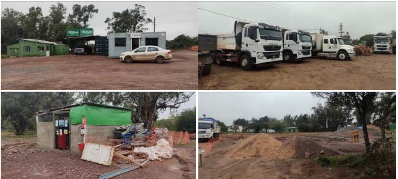
Foto 13.6-1 Obrador Ruralvial.