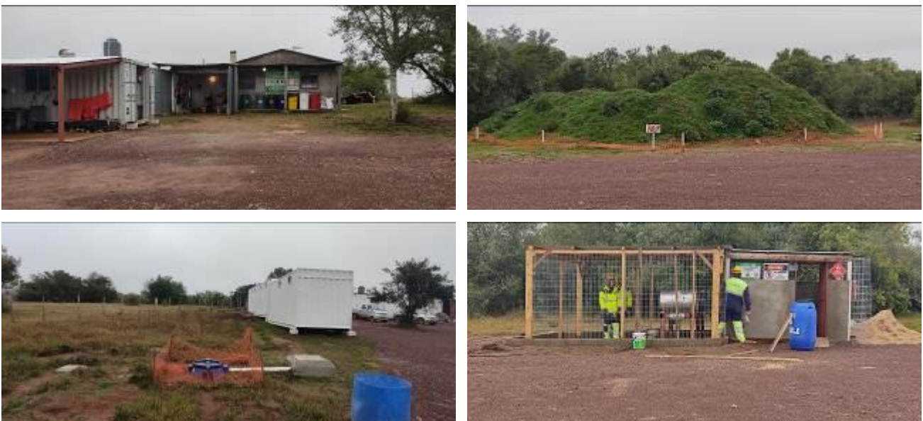
Foto 13.7-1 Obrador Aldesa.