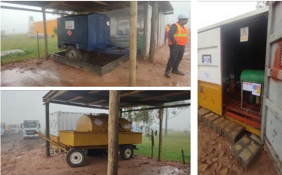
Foto 13.5-1 Obrador Subcontrato BISIO