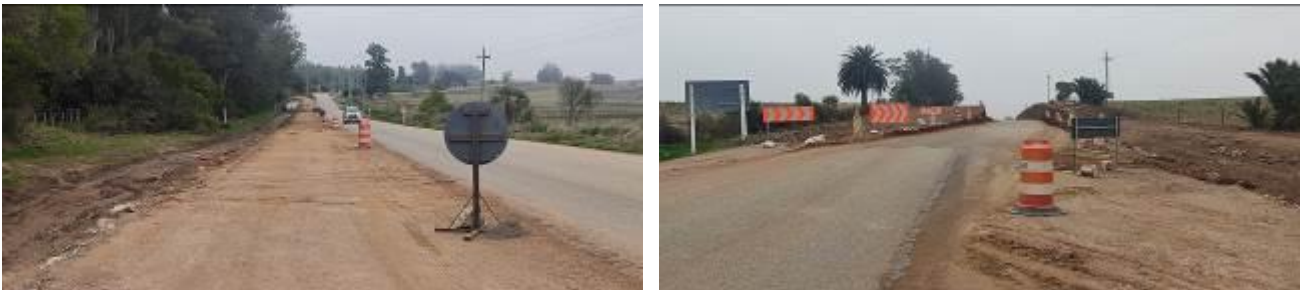
Foto 13.4-1 Vistas Ruta 14 entre Ruta 8 y Lascano