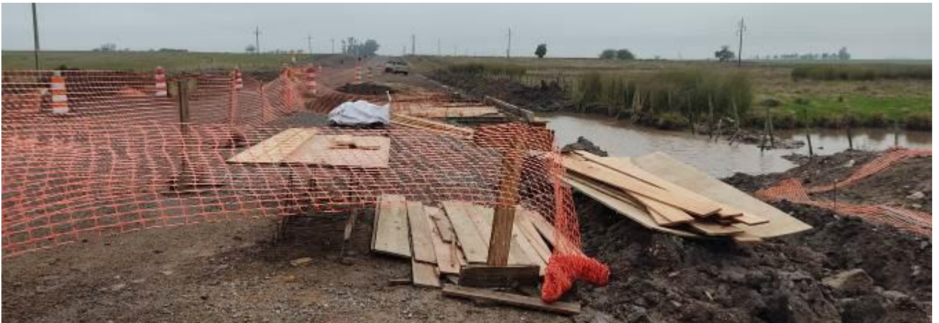
Foto 13.1-1 Materiales en zona inundable.