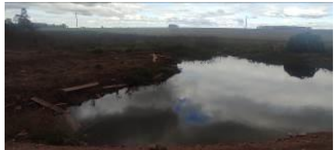
Foto 13.1-1 Materiales diseminados en Alcantarilla.