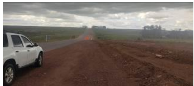
Foto 13.2-1 Vistas del tramo de Ruta 15 Velázquez - Lascano.