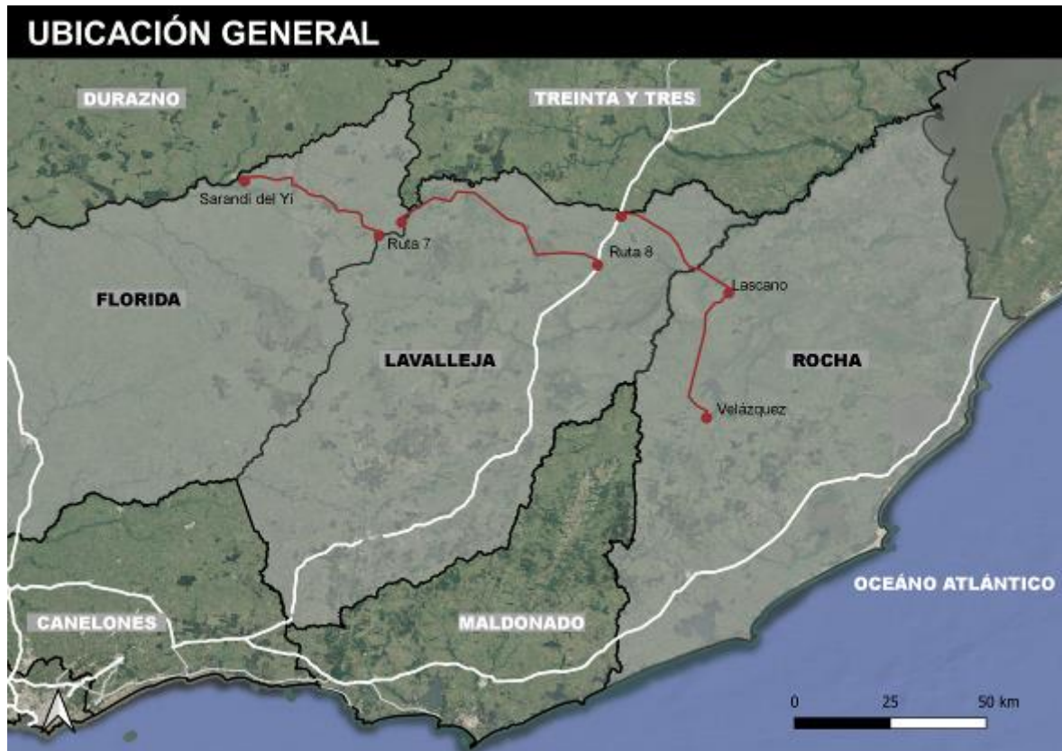
Figura 4-1 Ubicación de la obra

El alcance de esta auditoría fue a las obras en Ruta 15.