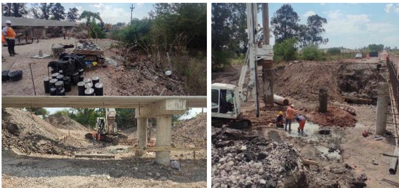
Foto 13.7-1 Vista entorno de obra Puente Arroyo Canelón Grande.