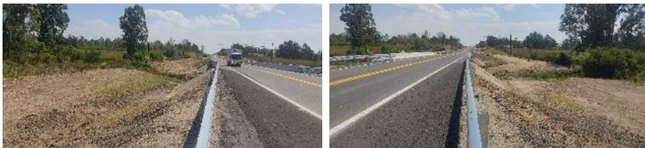
Foto 13.6-1 Entorno Puente Arroyo Matasiete.