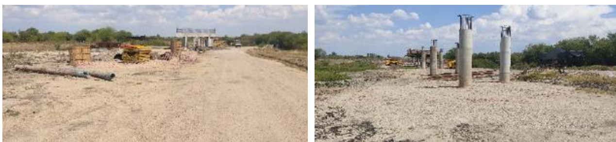
Foto 13.8-1 Puente Arroyo Tala.