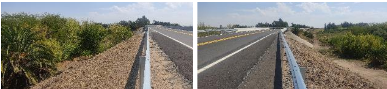
Foto 13.4-1 Entorno Puente Arroyo Sauce y Pasaje Superior Vía Férrea