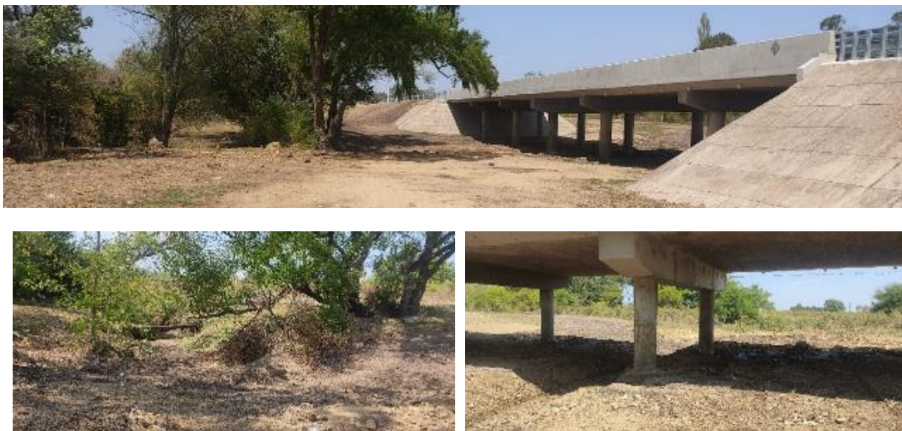
Foto 13.5-1 Entorno Puente Arroyo Vizcaíno.