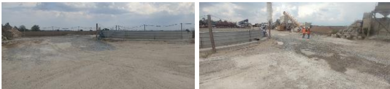
Foto 13.11-1 Planta de Hormigón de CUJÓ.