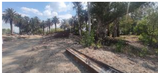
Foto 13.9-1 13.9-2 Entorno de obra Puente Río Santa Lucía.