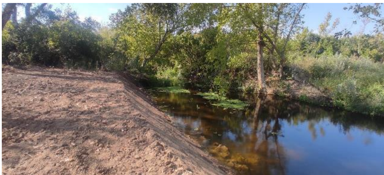
Foto 13.1-1 Riesgo de erosión.