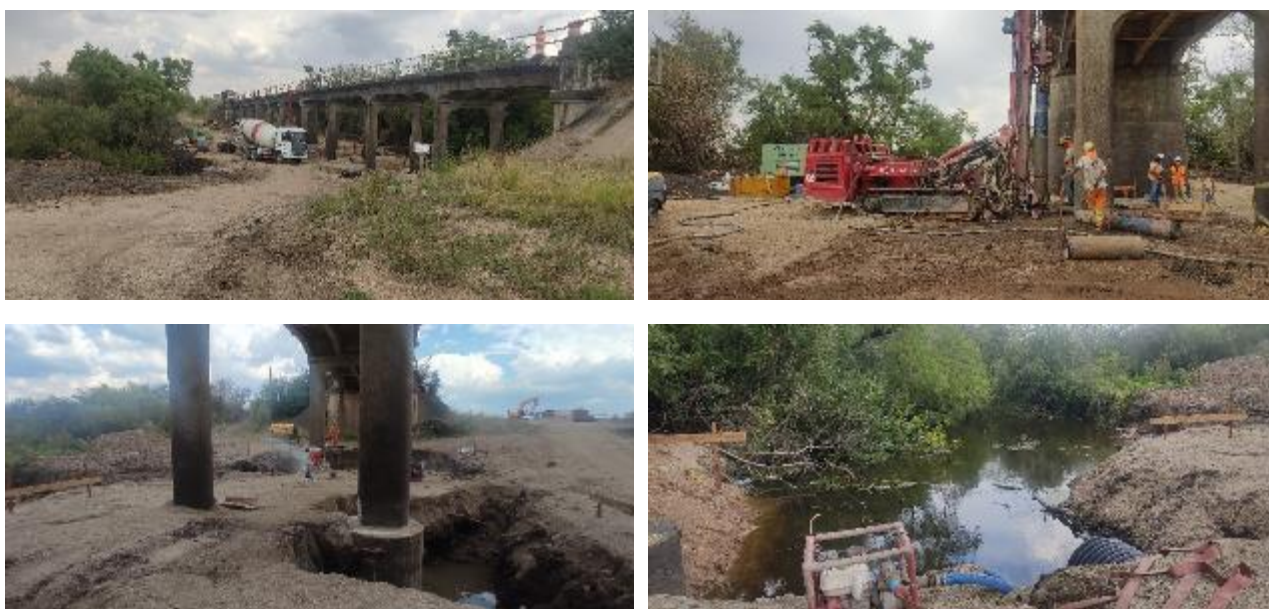
Foto 13.12-1 Entorno de obra Puente Arroyo Chamizo.