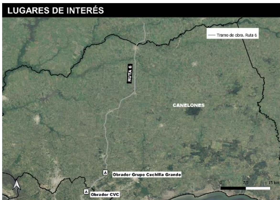
Figura 5-1 Lugares de interés