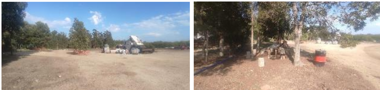
Foto 13.1-2 Obrador 1 CVC.