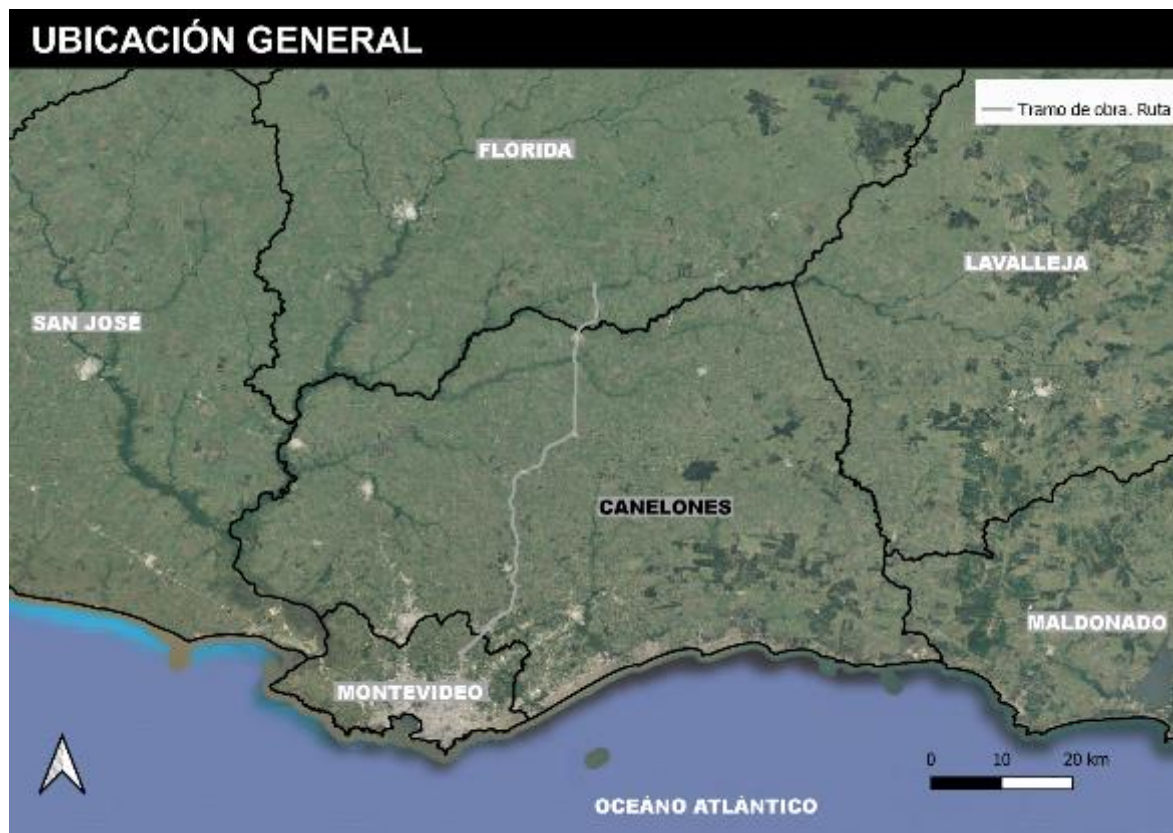
Figura 4-1 Ubicación general de la obra.