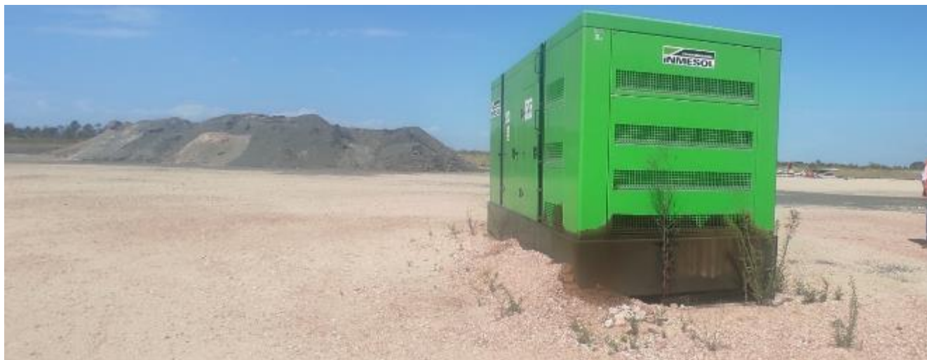
Foto 13.1-1 Derrame de combustible del generador en Obrador Principal.