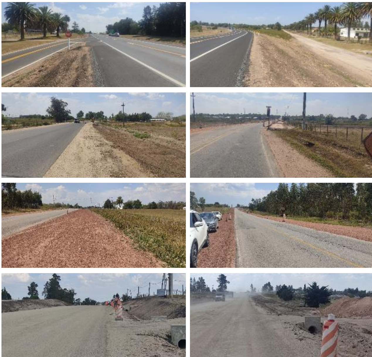
Foto 13.3-1 Vistas del tramo del contrato.