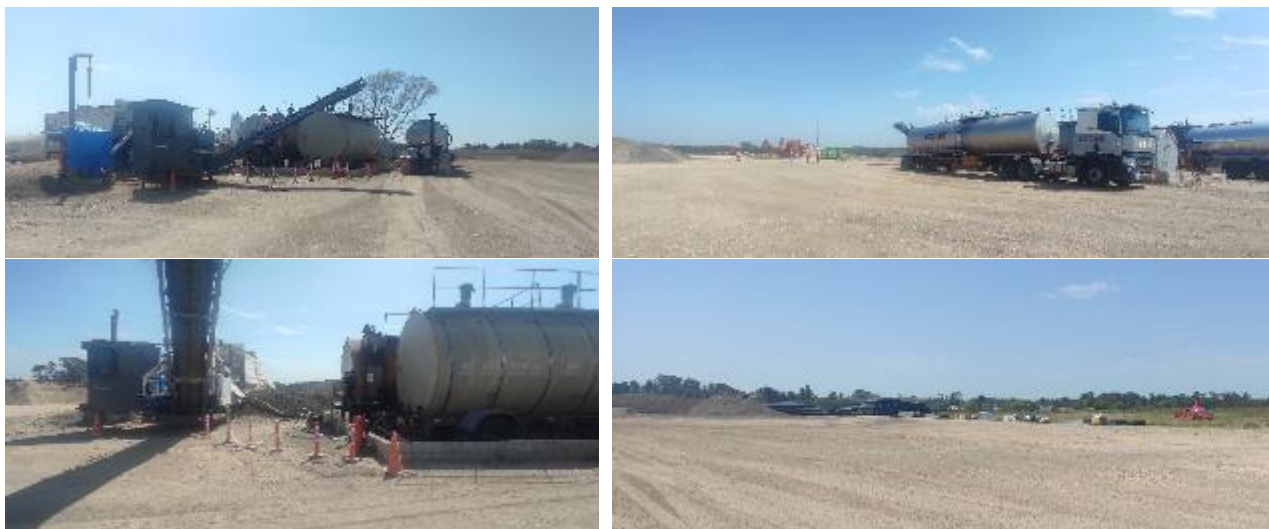
Foto 13.2-1 Obrador Grupo Cuchilla Grande.