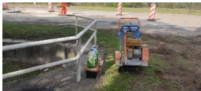
Foto 13.3-1 Envase de producto químico sin contención.