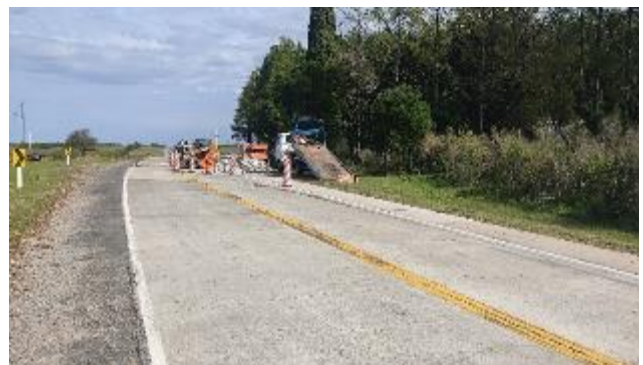
Foto 13.8-2 Tareas de Bacheo en Ruta 24.