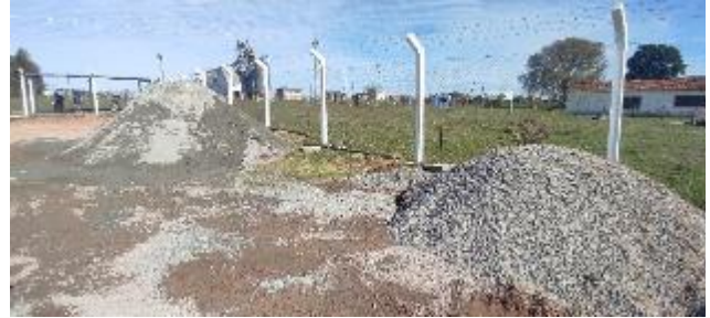
Foto 13.7-1 Obrador OPERADORA DEL LITORAL