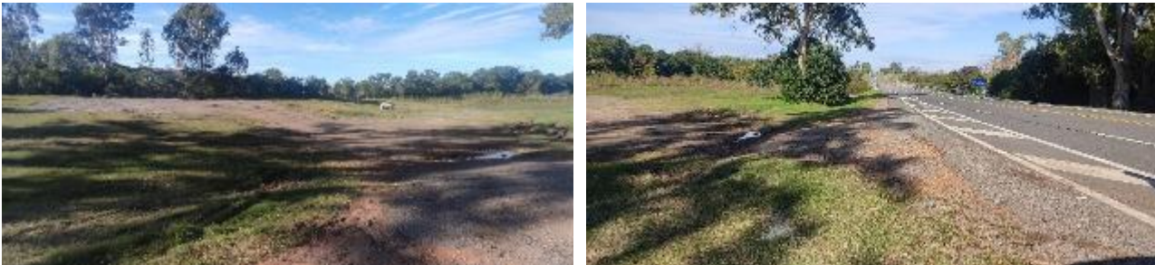
Foto 13.1-1 Vta.1 Zona en faja compactada y sin cobertura vegetal.