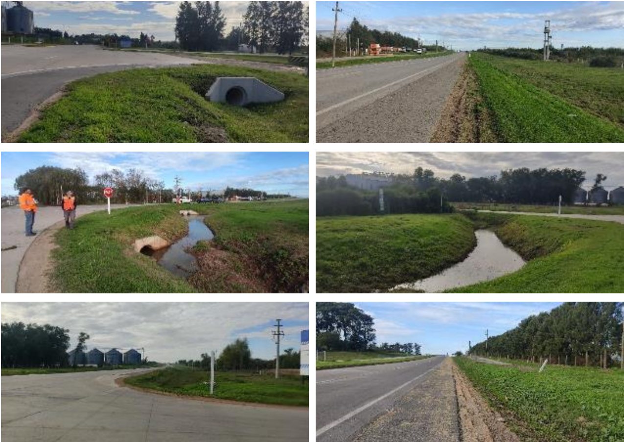
Foto 13.4-1 Vistas Bypass Nueva Palmira.