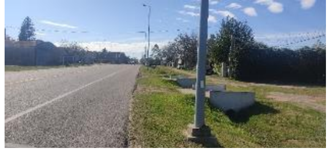
Foto 13.5-2 Vistas Ruta 21 ingreso a ciudad de Dolores.