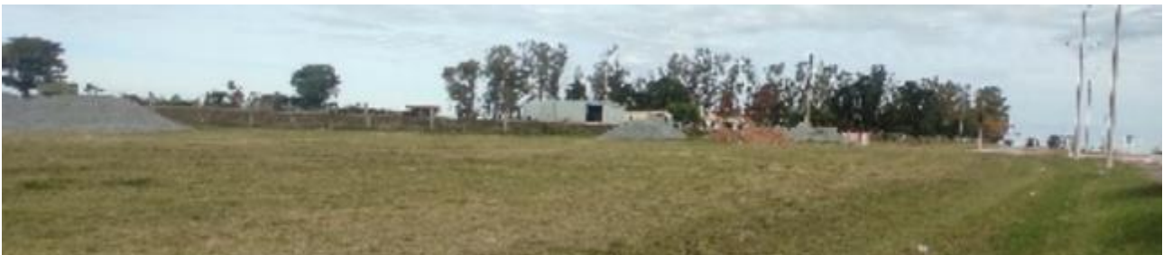
Foto 13.2-1 Acopios en faja sin autorización por escrito del DDO.