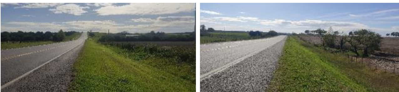
Foto 13.5-1 Vistas Ruta 21 tramo 279km500 - Dolores.