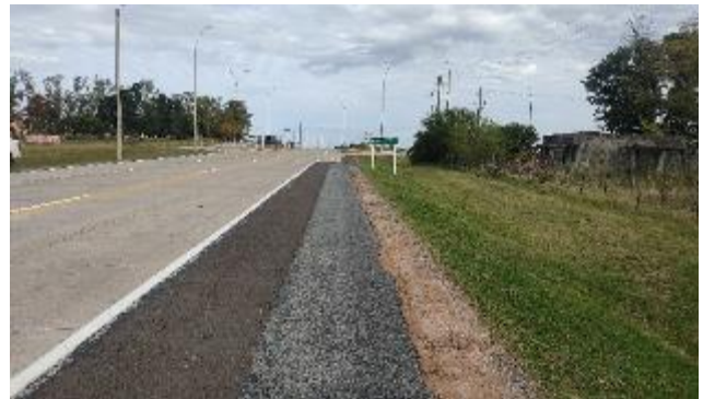
Foto 13.8-1 Vistas Ruta 24 entre Ruta 2 y Ruta 3.