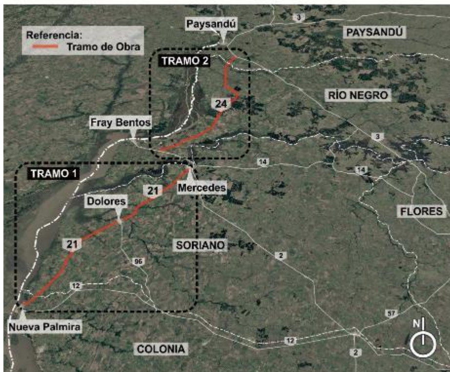
Figura 4-1 Ubicación general de la obra Página 7 de 14