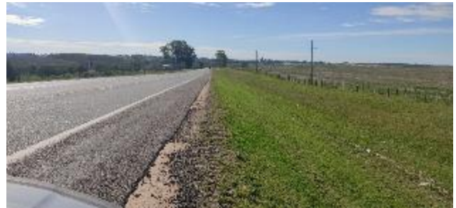
Foto 13.6-1 Vistas Ruta 21 Dolores - Mercedes.