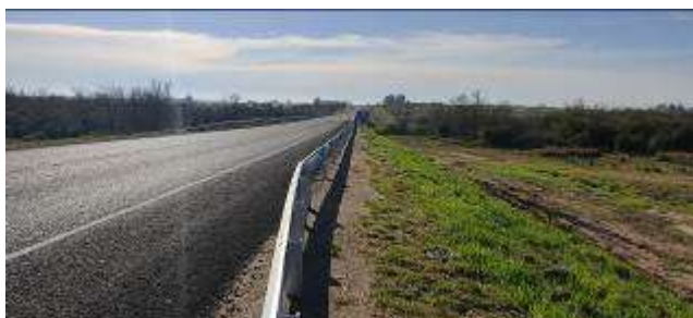
Foto 13.5-1 Puente Arroyo Grande