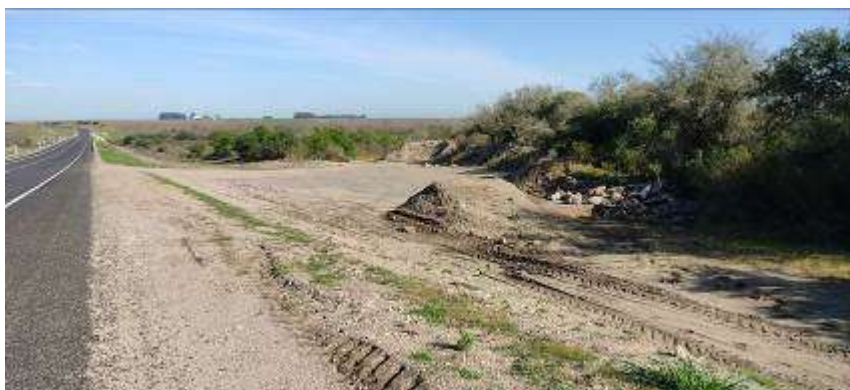
Foto 13.1-1 Vta 1 Acopios en faja Ruta 57