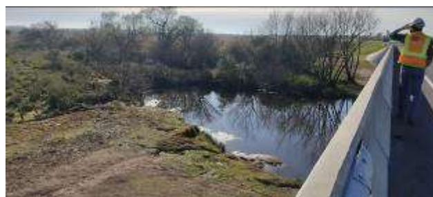
Foto 13.4-1 Puente Arroyo Monzón