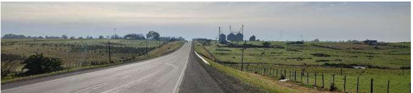
Foto 13.2-1 Vistas Ruta 12