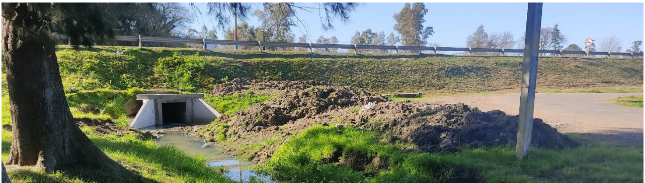
Foto 13.1-1 Vista 1 Alcantarilla terminada.