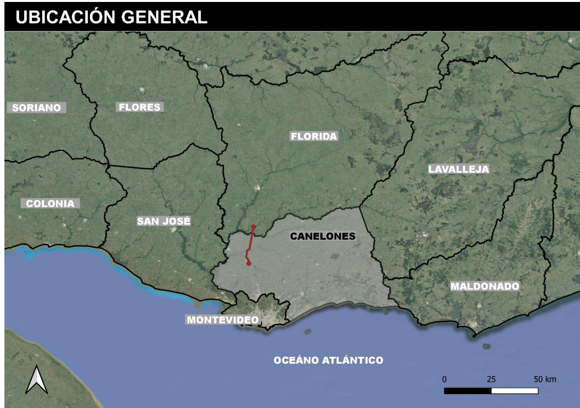
Figura 4-1 Ubicación de la obra.