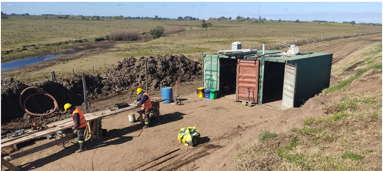
Foto 13.1-7 Vista 6 - Campamento subcontrato.