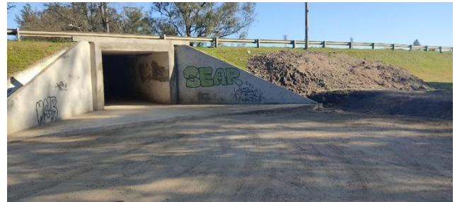
Foto 13.1-2 Vista 2 Alcantarilla para pasaje de vehículos.