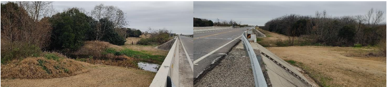
Foto 13.4-3 Puente Arroyo Arenal Chico