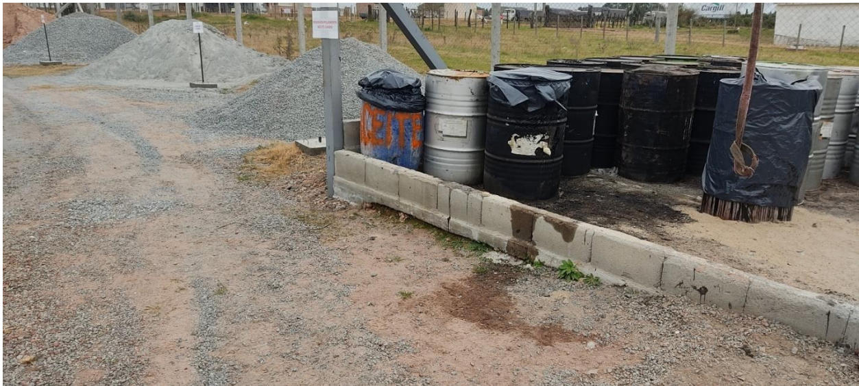
Foto 13.2-1 Derrame y dique de contención roto.