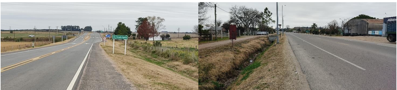
Foto 13.4-4 Vistas de tramo próximo a zona urbana, Ciudad de Dolores.