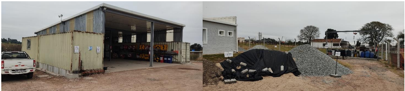
Foto 13.6-4 Vistas de Obrador de OPERADORA DEL LITORAL