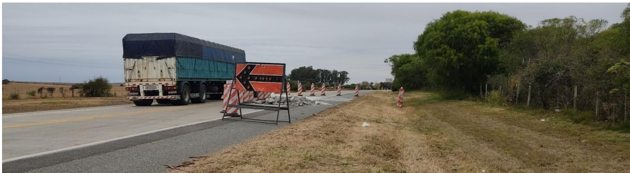
Foto 13.6-2 Trabajos de bacheo en Ruta 24.