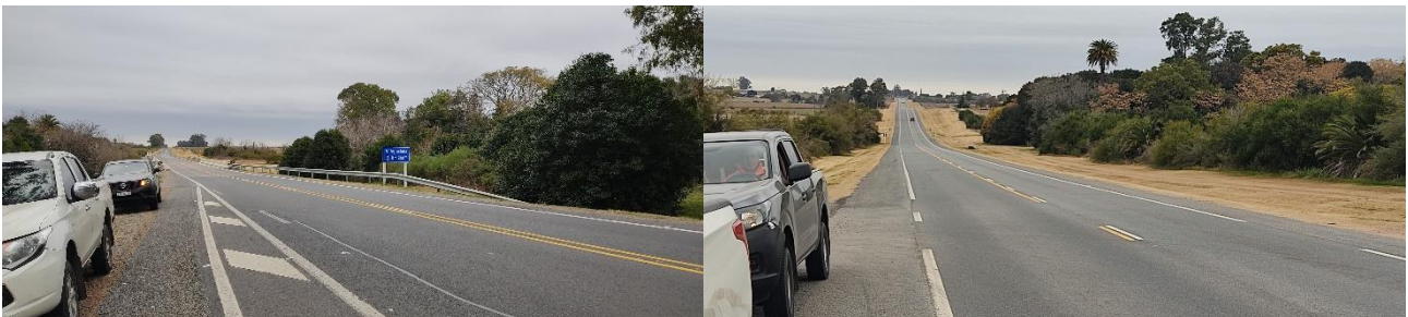
Foto 13.4-1 Puente Arroyo Agraciada