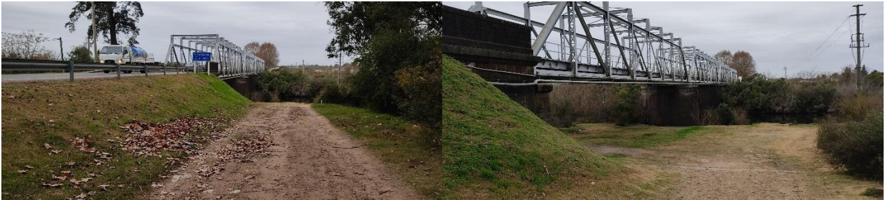
Foto 13.5-1 Puente Arroyo San Salvador