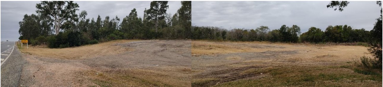
Foto 13.1-1 Vta.1 Zona de faja compactada sin cobertura vegetal.