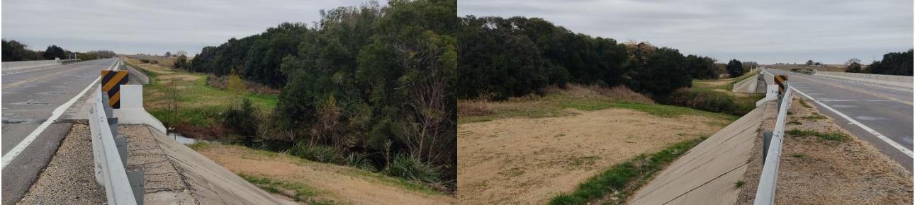
Foto 13.4-2 Puente Arroyo Arenal Grande.