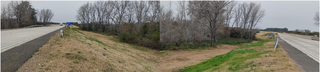
Foto 13.6-1 Puente Arroyo Bellaco