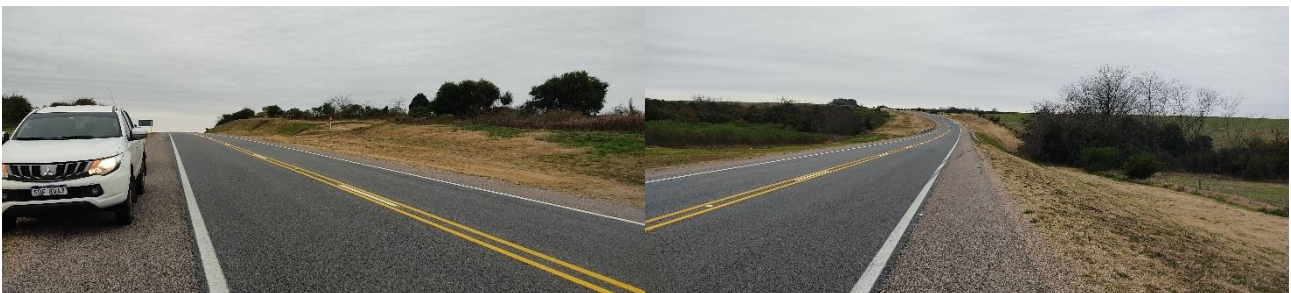
Foto 13.5-4 Vista tramo Ruta 21 Dolores - Mercedes