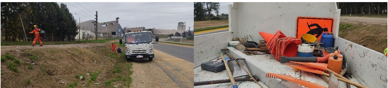
Foto 13.3-1 Cuadrilla de limpieza y corte de pasto.