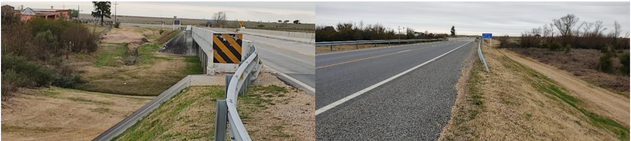
Foto 13.5-2 Puente Arroyo Bizcocho