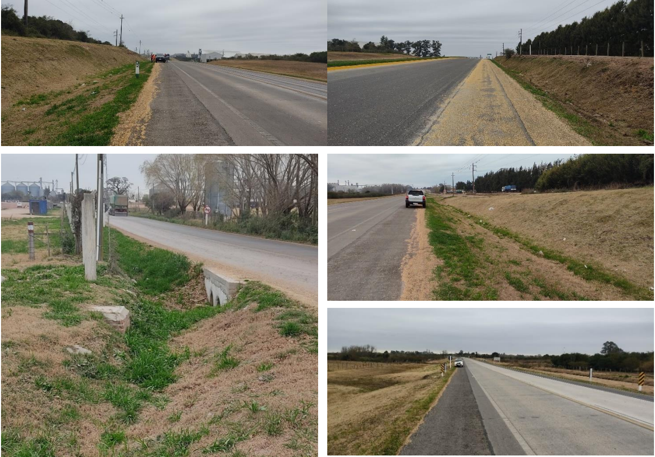
Foto 13.3-2 Vistas del By Pass Nueva Palmira