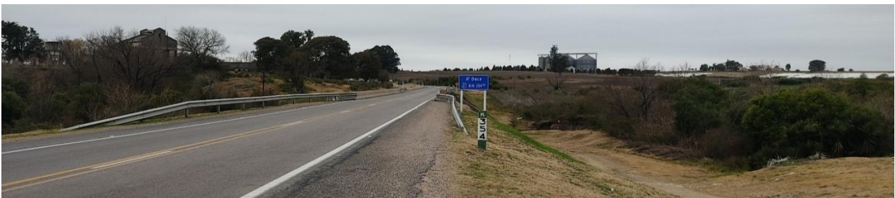
Foto 13.5-3 Puente Arroyo Daca