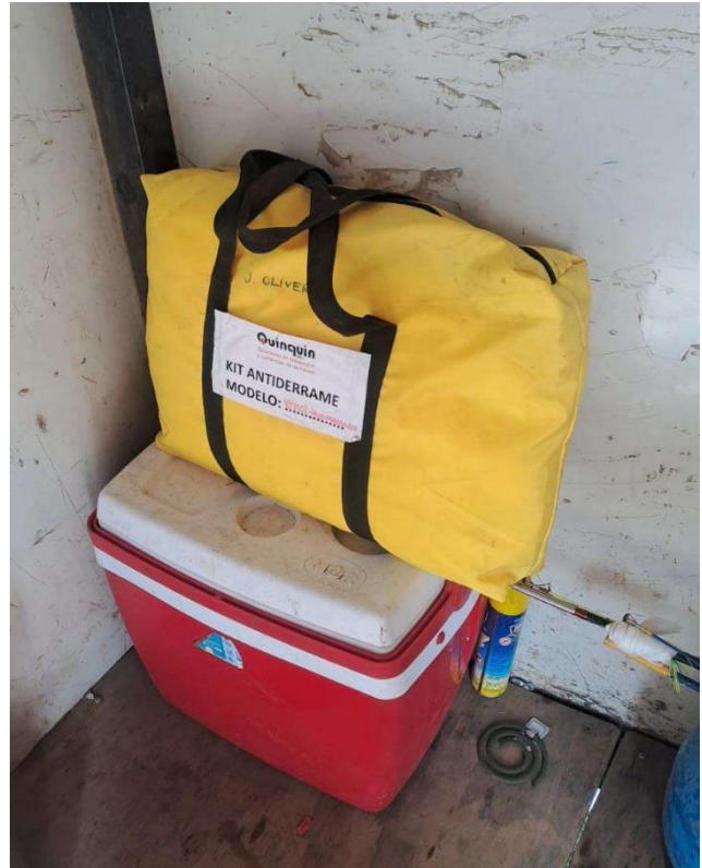
Foto 12.3-2, P04. Se incorporó el kit antiderrame.