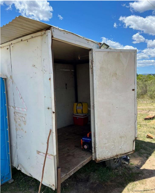
Foto 12.3-1, P04. Se incorporaron los elementos previstos por el PACo del contrato