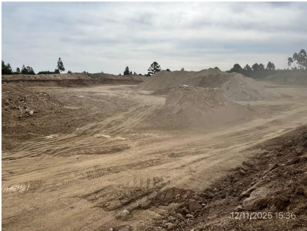
Foto 12.2-3, P04. Acopios de material listos para transporte.