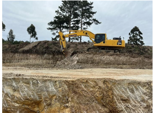
Foto 12.2-2, P04. Frente de explotación activo.