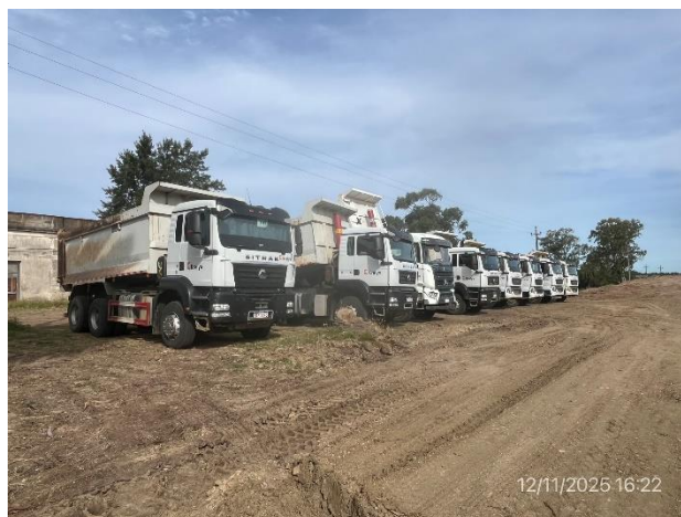
Foto 12.1-4, P06. Campamento provisorio en faja pública, explanada de maniobras.