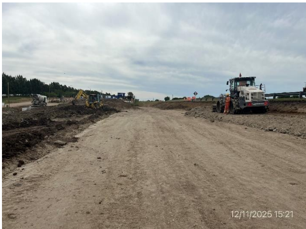
Foto 12.1-1, P06. Frente de obra, Ruta 9 progresiva 84K300 a (+).