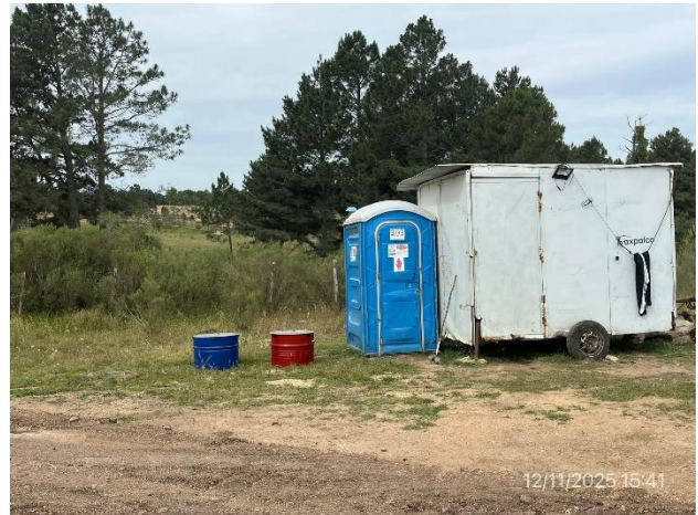
Foto 12.2-4, P04. Campamento provisorio, servicios de bienestar correctos, pero faltan elementos para actuación frente a contingencias ambientales.