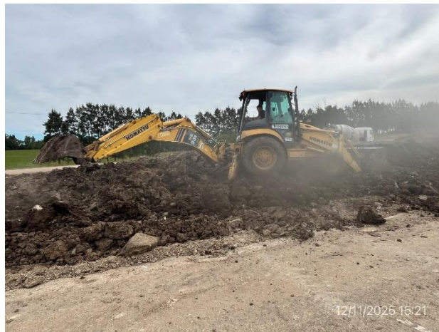
Foto 12.1-2, P06. Movimiento de suelos en ejecución.