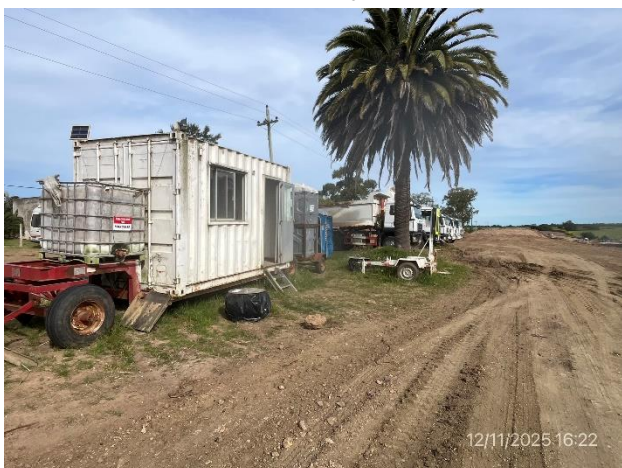
Foto 12.1-5, P06. Campamento provisorio, servicios de bienestar correctos