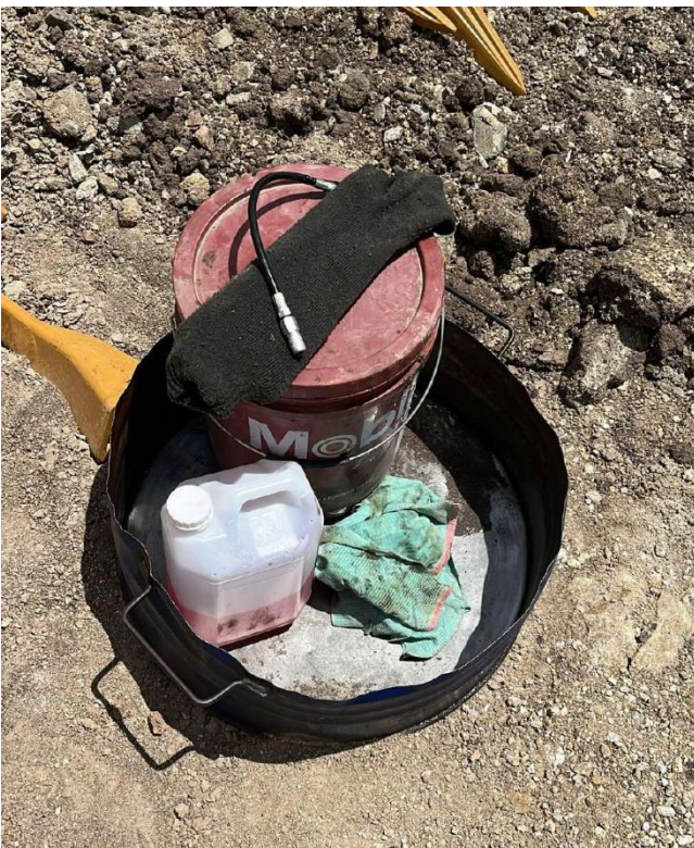
Foto 12.3-3, P04. Se alojaron los lubricantes dentro de una bandeja antiderrame