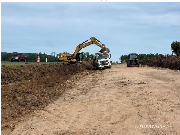
Foto 12.1-3, P06. Apertura de caja y perfilado de subrasante en ejecución.