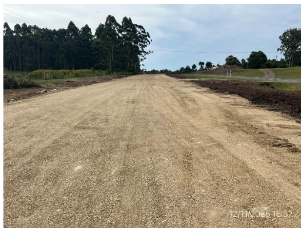
Foto 12.1-6, P06. Ruta 9. Tramo duplicado con base granular conformada.