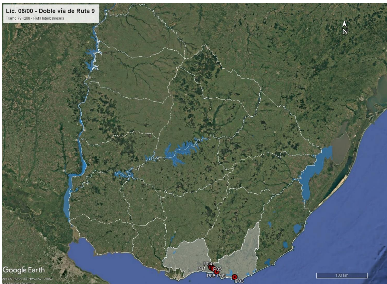
Figura 4-1 Ubicación de la obra.

La segunda senda de Ruta 9 a construir implica la ejecución de una nueva calzada en mezcla asfáltica y el recapado de la calzada existente. La auditoría ambiental se centra en el tramo subcontratado a la firma Traxpalco SA entre el peaje de Capilla de Celia y la Ruta Interbalnearia.