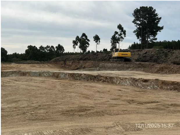
Foto 12.2-1, P04. Cantera de tosca. Padrón rural N°17958, 8ª. SC de Canelones. Ruta 9 progresiva 78K900 a (-).