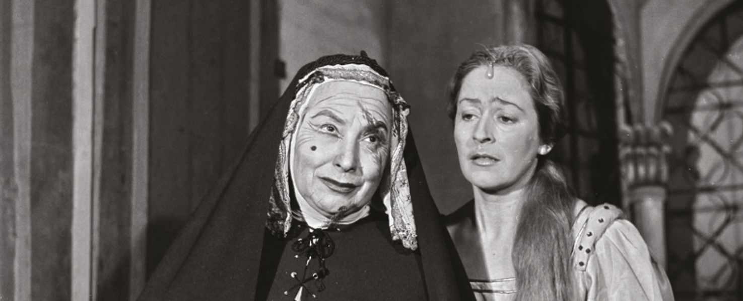
Margarita Xirgú y Concepción (China) Zorrilla en La Celestina por la Comedia Nacional, Teatro Solís. Foto Musitelli Ferruccio, 1949. Archivo CdF.