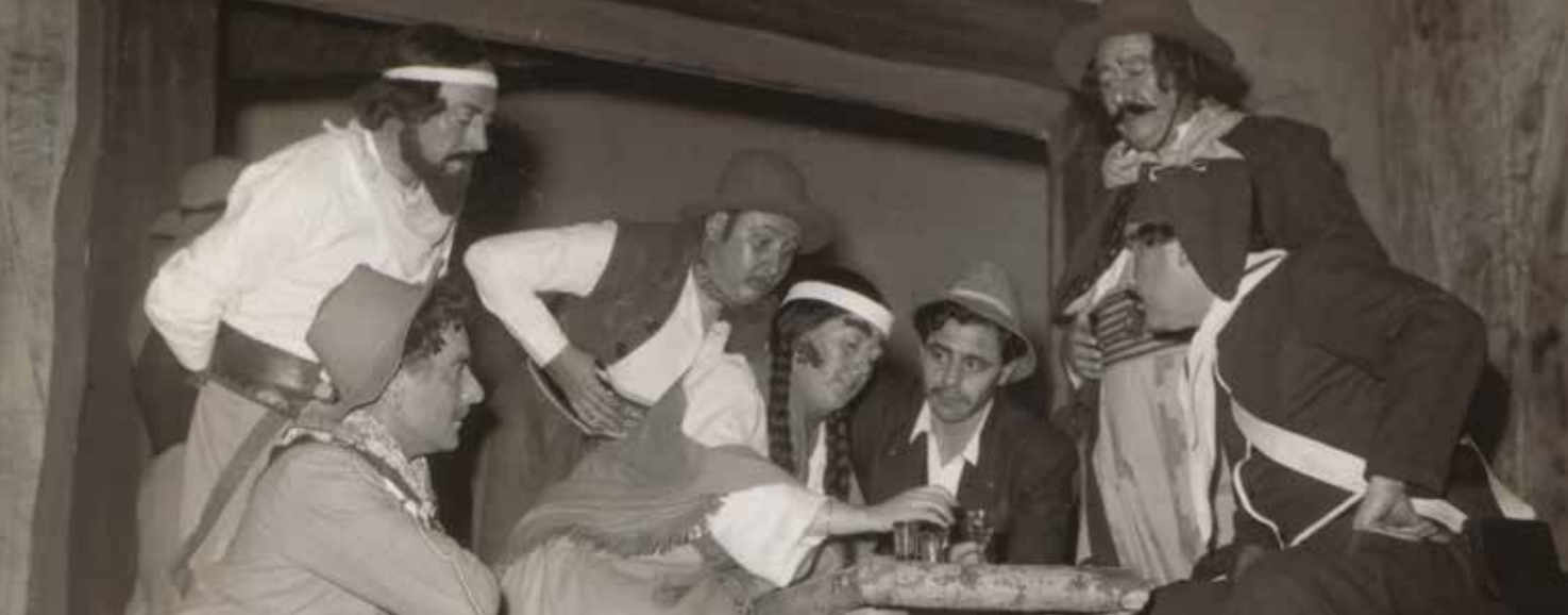
China en La patria en armas , dirección Margarita Xirgu, 1950.