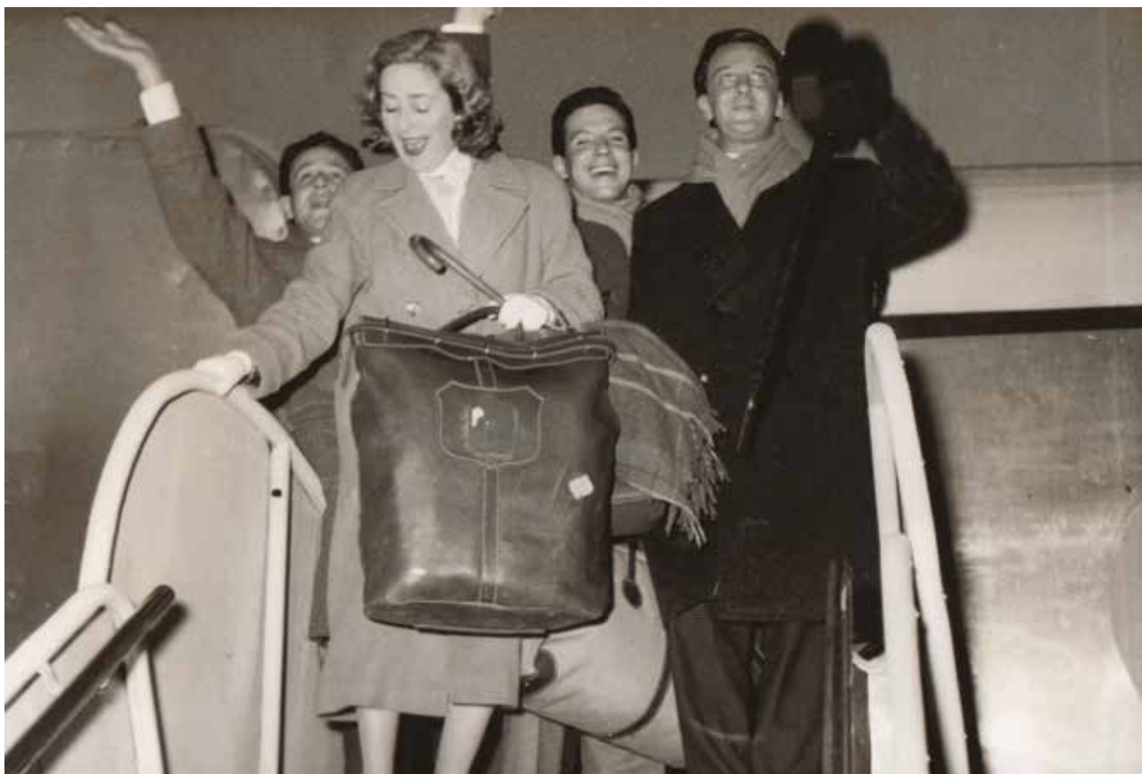
CIDDAE, Teatro Solís.