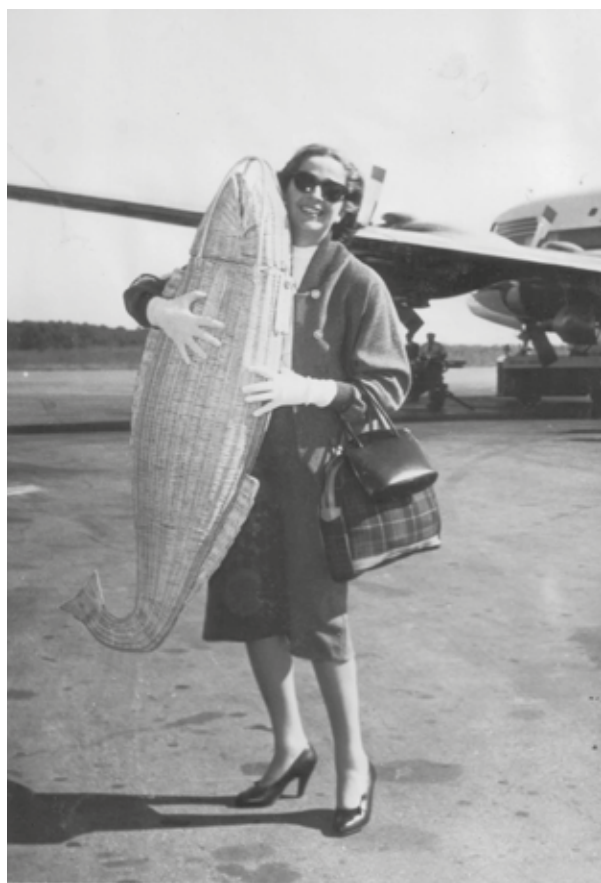
China de regreso de uno de sus viajes. CIDDAE / Teatro Solís.

Dedicarle el Día del Patrimonio en este año 2022 es una forma de aplaudirla y evocarla.