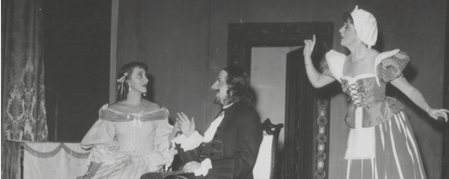
Dorina, un personaje de Tartufo de Molière. Comedia Nacional.