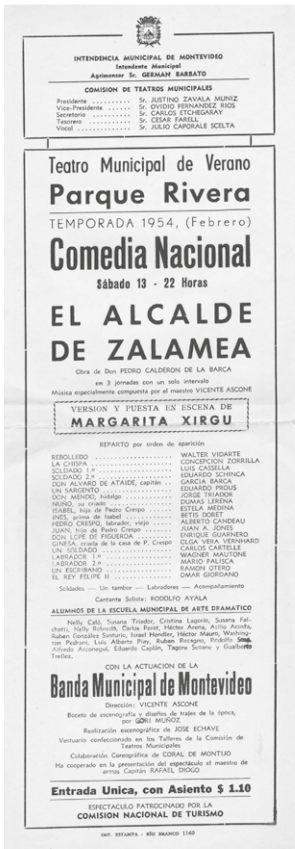
El Alcalde de Zalamea. CIDDAE, Teatro Solís.

Organiza: Dirección General de Cultura de Tacuarembó.