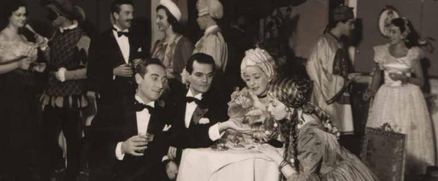
Archivo CIDDAE, Teatro Solís.