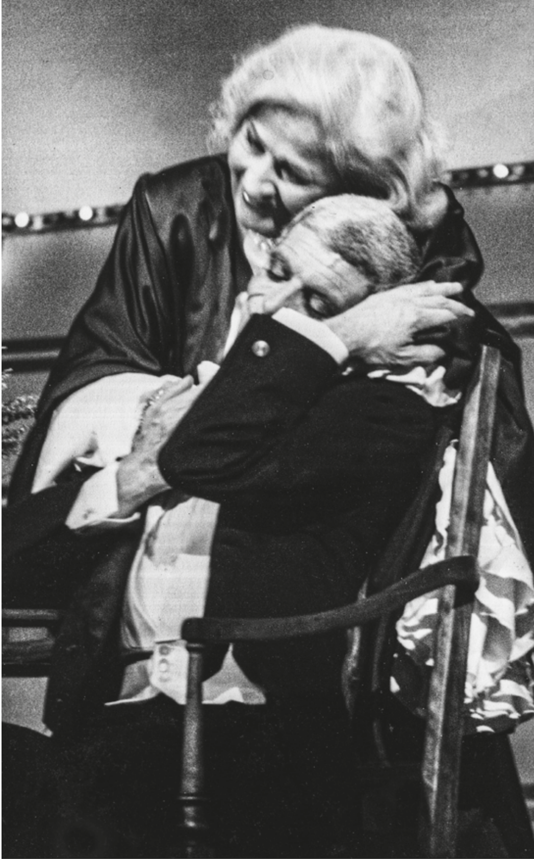
Archivo de la familia, Lalia Amorim