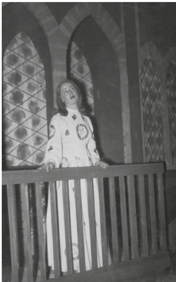
China en Romeo y Julieta , 1950.

do regresó al país, dos años más tarde, se integró al elenco oficial de la Comedia Nacional. Actuó, produjo, tradujo textos de obras del francés y del inglés y también dirigió numerosas obras. Margarita Xirgu la dirigió en Bodas de Sangre , de García Lorca y en el clásico shakespeariano de todos los tiempos: Romeo y Julieta .