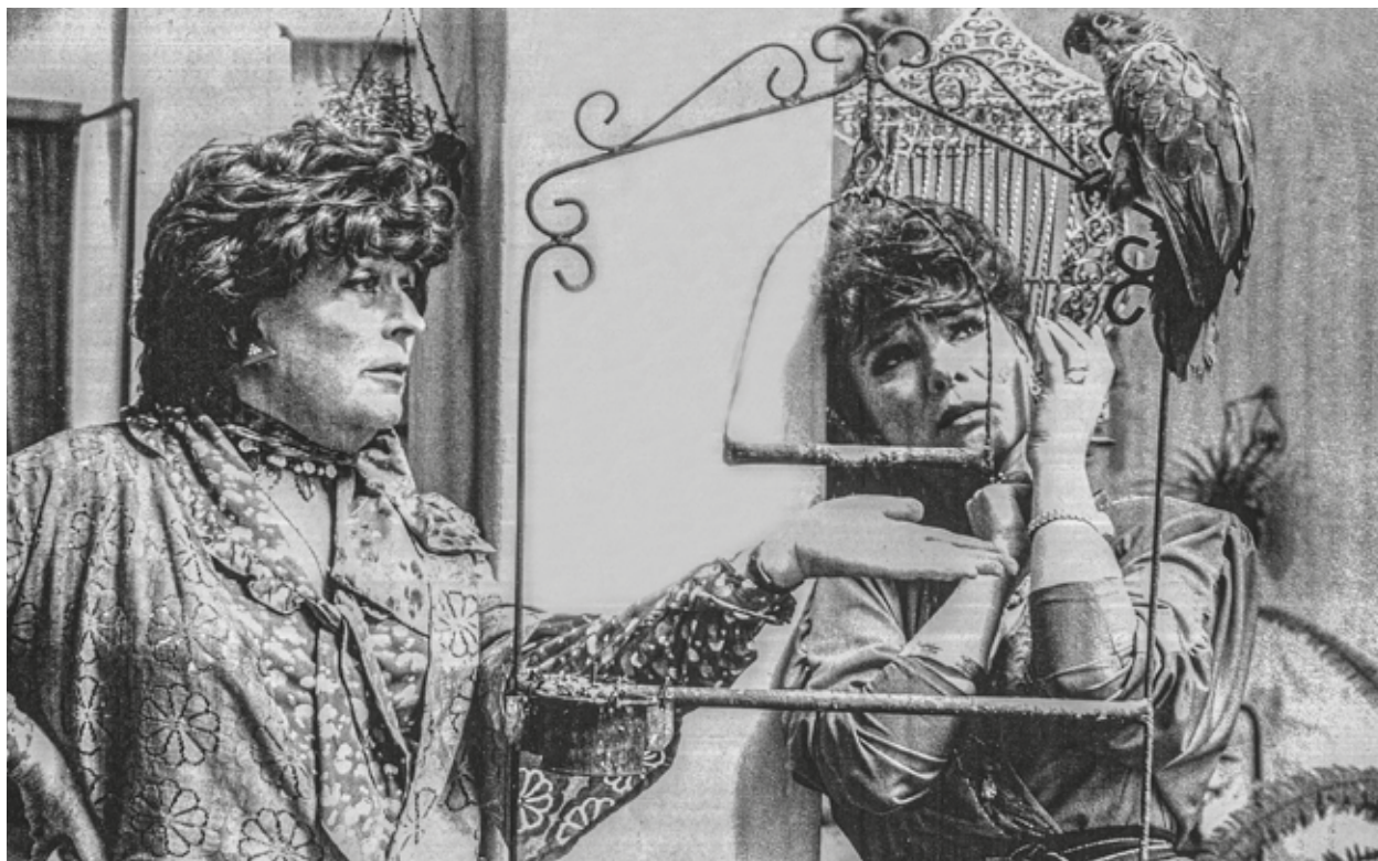
China y Betiana Blum en la película Esperando la carroza, Buenos Aires, 1985.

Fueron casi cuatro décadas en los que participó en distintos papeles (centrales, secundarios, de participación especial), en decenas de películas de gran importancia para el cine de habla hispana. Fue Doña Natividad en Un guapo del 900 de Lautaro Murúa (1971); actuó en La mafia (1972), junto a Alfredo Alcón y Thelma Biral; en Heroína (1972), de Raúl de la Torre, con Graciela Borges y Lautaro Murúa; en La tregua (1974), sobre novela de Mario Benedetti; en Los gauchos judíos (1975), dirigida por Juan José Jusid; en Triángulo de cuatro (1975), de Fernando Ayala.