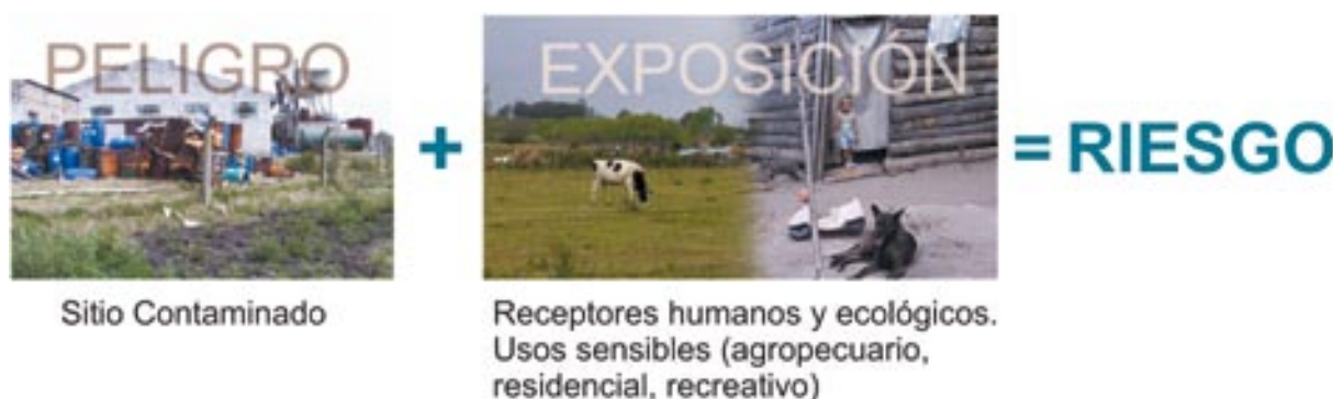
Figura II: Relación entre peligro, exposición y riesgo en sitios contaminados 1 .

El riesgo es la probabilidad de que ocurra un efecto adverso como resultado de la exposición a contaminantes. Para que exista riesgo, deben conjugarse el peligro y la exposición a dicho peligro. Los individuos o grupos de individuos expuestos se denominan receptores, y pueden ser receptores humanos, animales y plantas, ecosistemas, o receptores ambientales a proteger (por ejemplo: acuíferos o cuerpos de agua superficial).