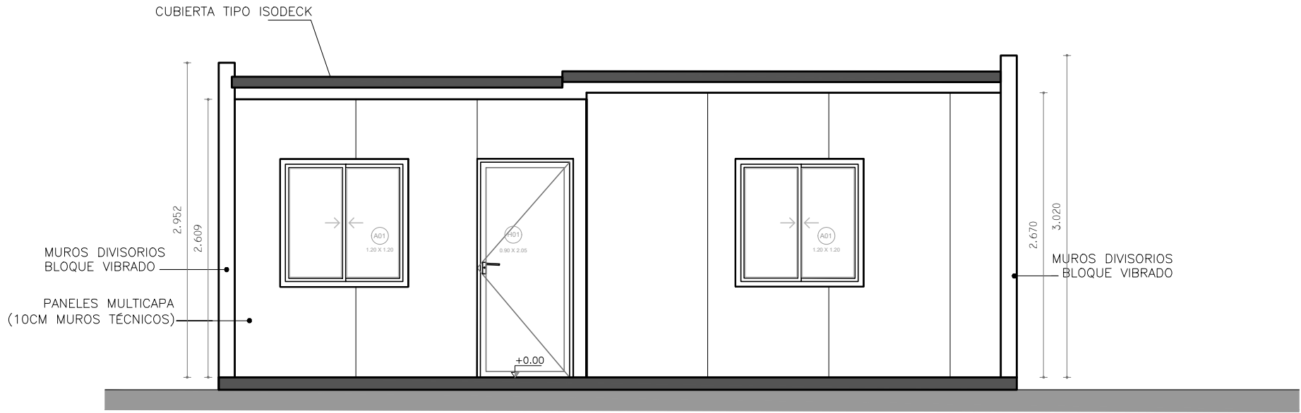
FACHADA PRINCIPAL ESCALA_1/50