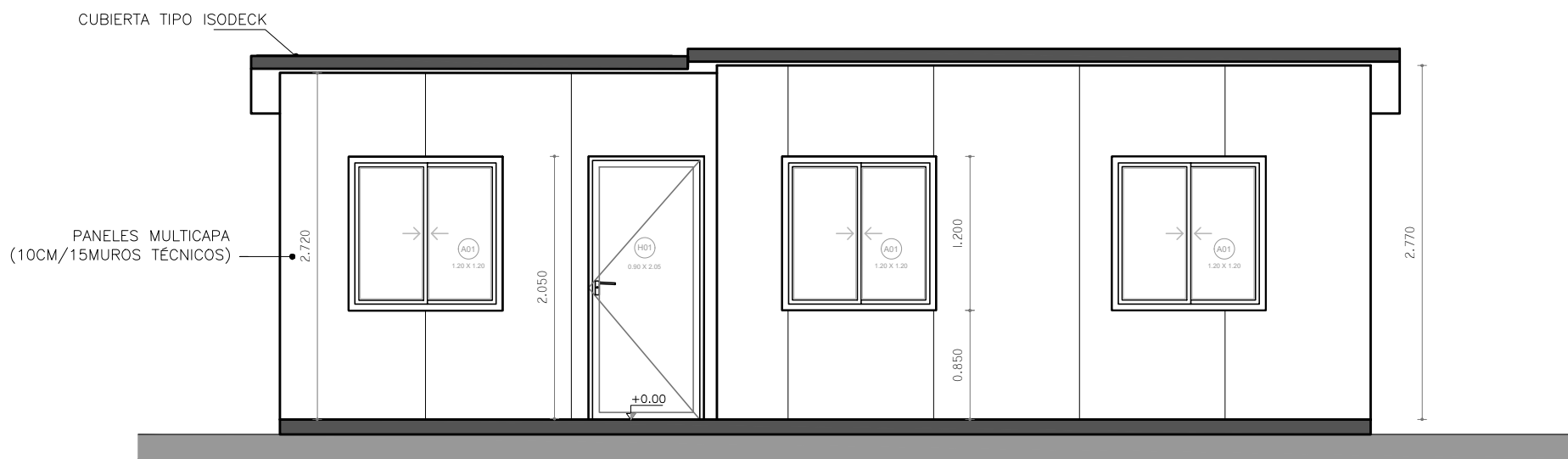
FACHADA PRINCIPAL ESCALA_1/50