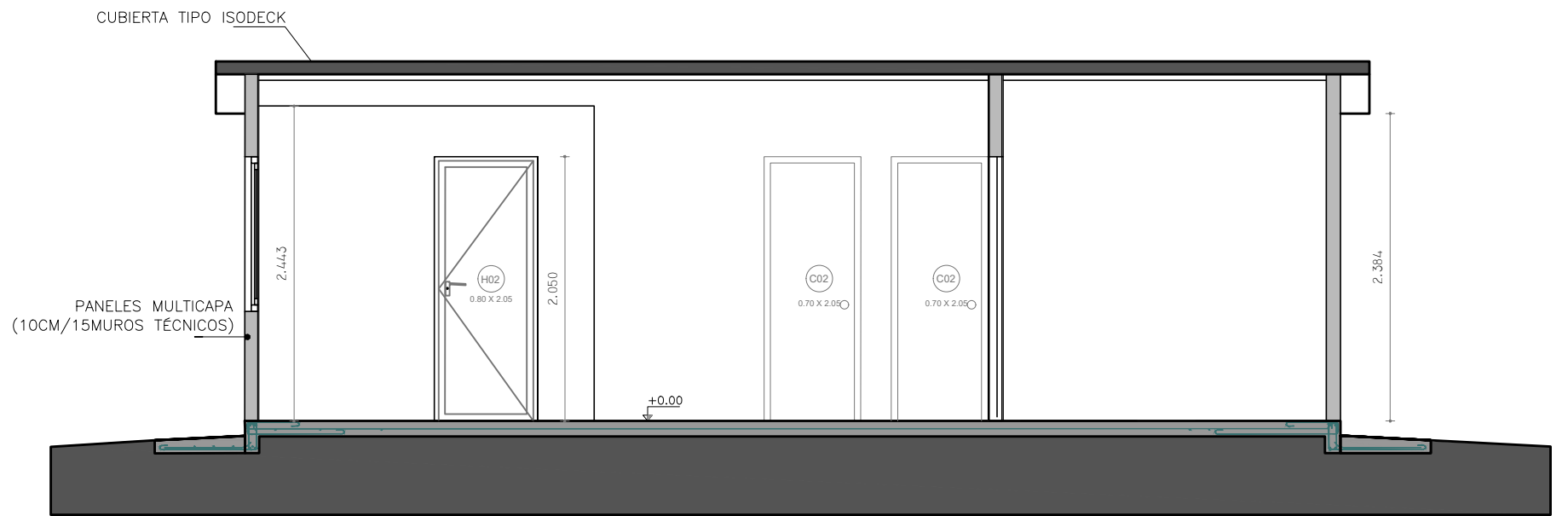
CORTE A - A ESCALA_1/50