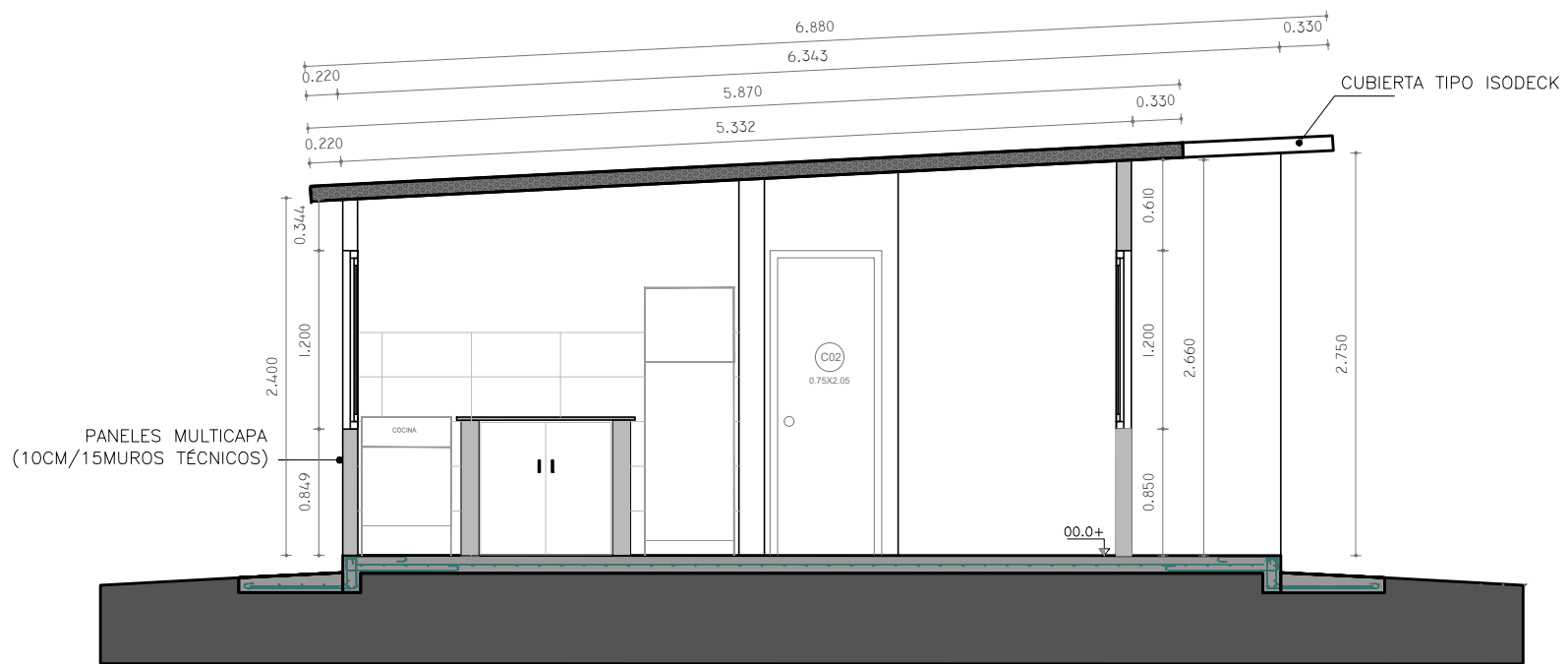
CORTE A - A ESCALA_1/50