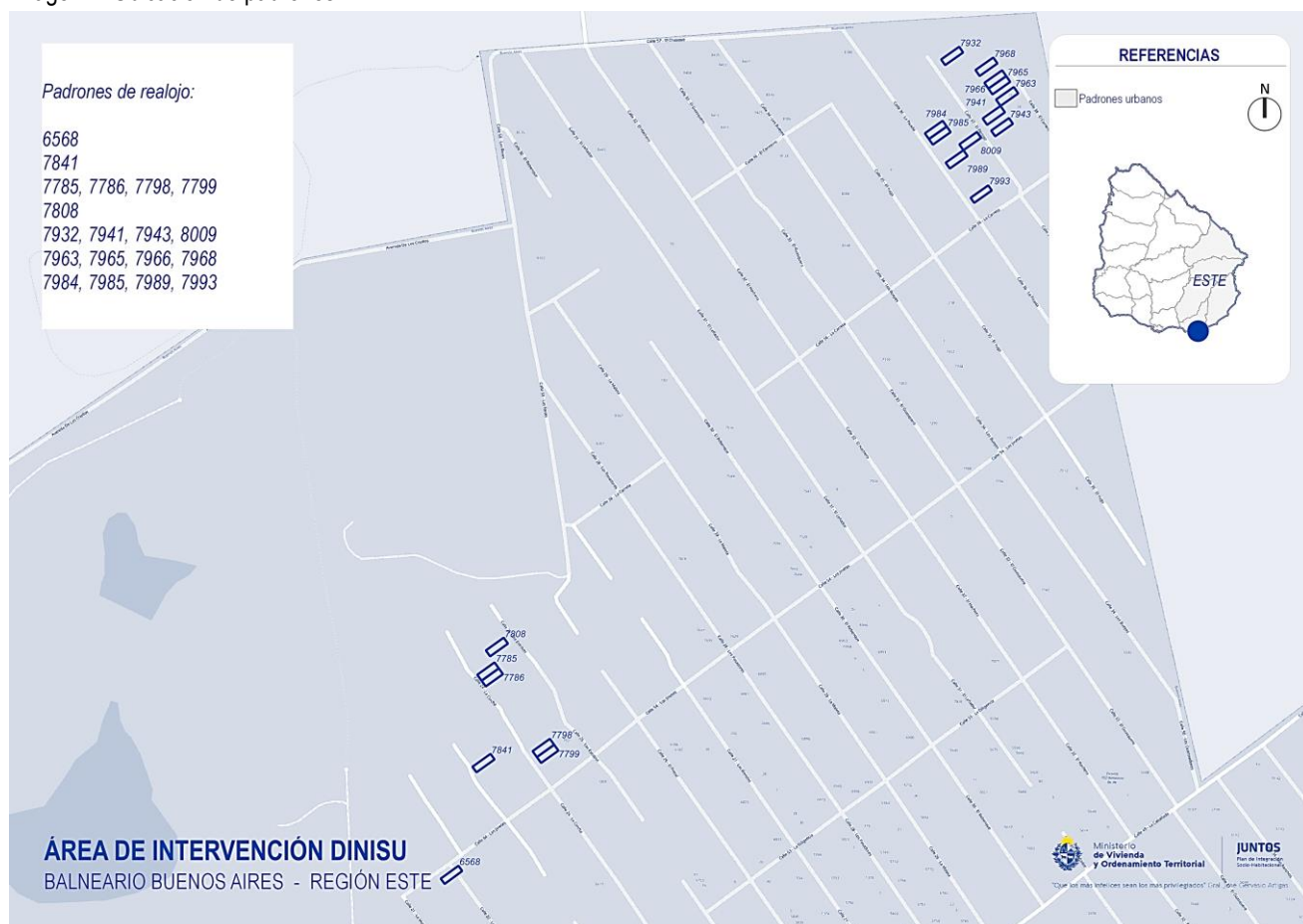
Imagen 1: Ubicación de padrones