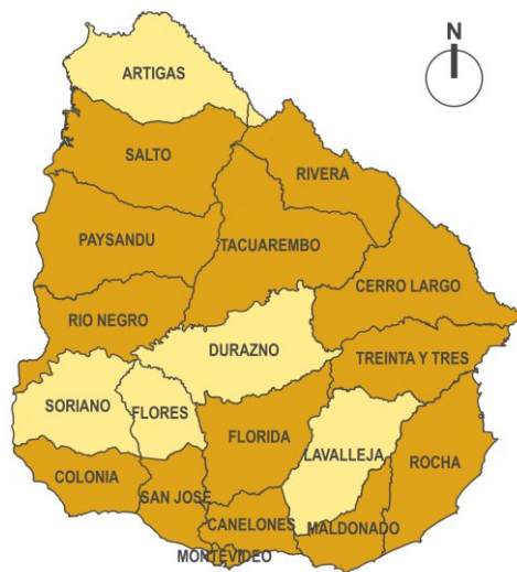
Mapa 1: Departamentos donde interviene el Plan Juntos en el 2018