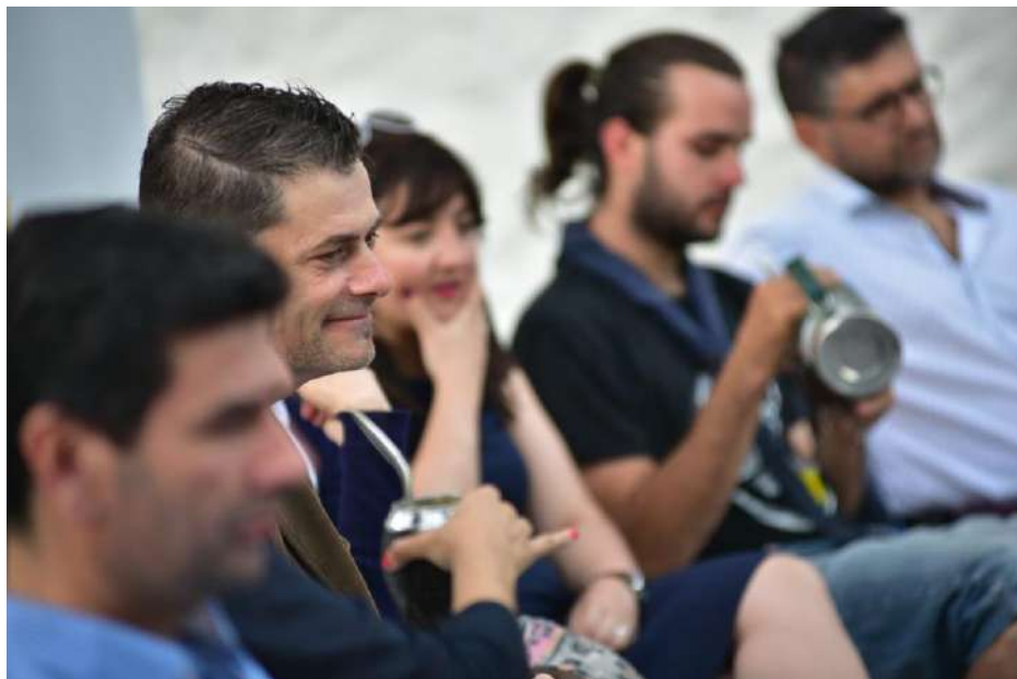
Participantes del taller de DDHH en Colonia

También se hizo énfasis en la participación de las personas mayores en la toma de decisiones a nivel estatal, y promover la inclusión y actividades de orden intergeneracional.