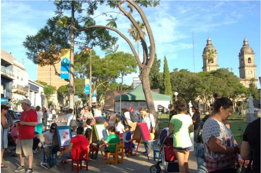
Feria Social durante la mesa de la Paz de Salto, 2018.