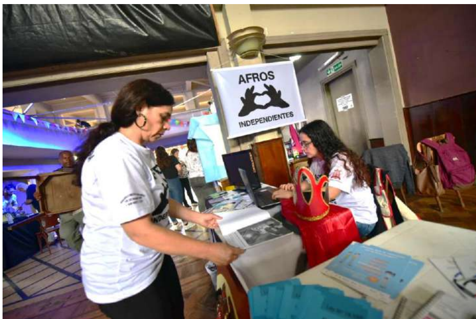
Preparación de stands antes de que comience la actividad.

Poniendo en valor las capacidades locales, se generaron espacios para dar visibilidad a experiencias o instituciones que trabajan en derechos humanos, complementado con el aporte de instituciones nacionales e internacionales. Un efecto emergente en las mesas de 2017, y que en estas al ser evaluado como algo muy positivo fue explícitamente buscado, es el encuentro entre miembros de diferentes organizaciones, que producto de la coincidencia terminan compartiendo anécdotas, experiencias en lugares diferentes, pero que apuntan a lo mismo, la dignidad de las personas.