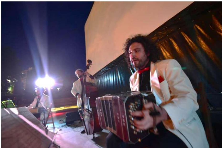
Juana y los Heladeros del Tango.

El día de los Derechos Humanos, 10 de diciembre, se llevó a cabo la Mesa para la paz en la ciudad de Montevideo. El evento fue cerrado con la actuación de la orquesta de tango Juana y los Heladeros, acompañada por bailarines ocasionales que se fueron sumando mientras se desarrollaba el espectáculo y seguidos por la intervención del dj Sonidero Mandinga y la vj Cabe Trust.