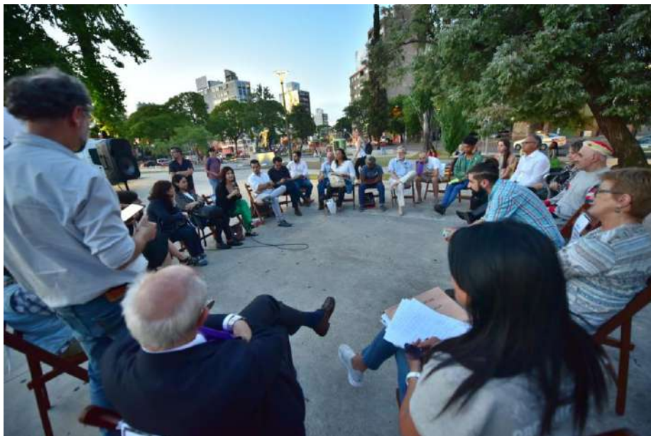
Los conversatorios se articularon en rondas bajo la frondosa vegetación que brindó el fresco necesario en el diciembre montevideano para que la actividad pudiera llevarse a cabo.