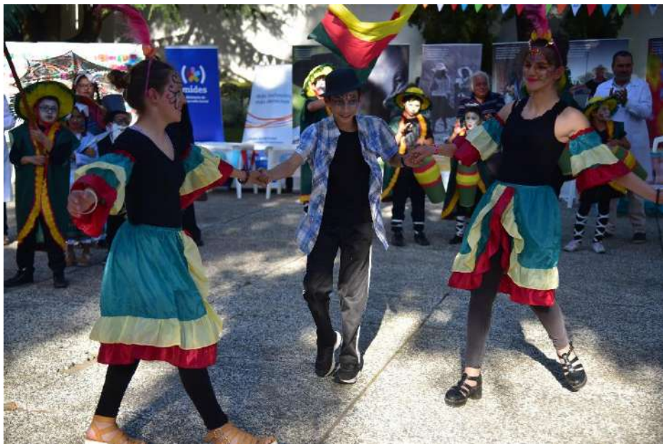
Muestra de candombe en la Ferial Social.

Finalmente, el conversatorio terminó con algunas reflexiones sobre los derechos humanos de las personas con distintos tipos de discapacidad, y se invitó a que cada participante expusiera sus propias prácticas e imaginarios de los principios de igualdad y no discriminación esbozados en la Convención Internacional sobre los derechos de las personas con discapacidad.