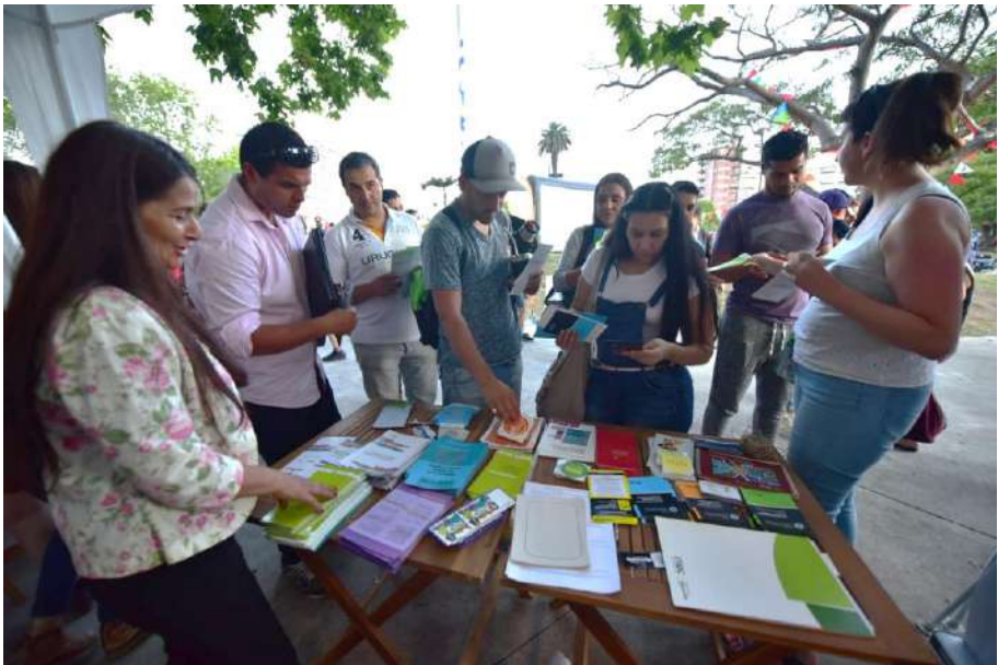
Difusión de material sobre derechos, confeccionado por varias instituciones públicas.