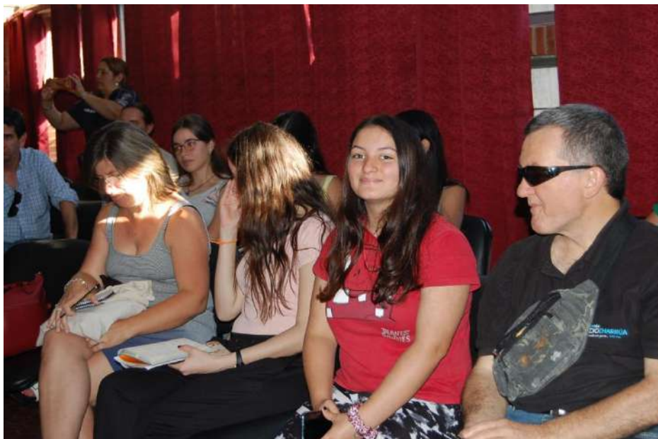
Una nutrida concurrencia, entre ellos varios jóvenes, participaron del taller de Derechos Humanos en Salto.

como para personas con discapacidades. Además, se generó un diálogo sobre la igualdad de oportunidades, que quienes viven en asentamientos, zonas rurales, barrios periféricos, no acceden a la misma educación que quienes viven en el centro de Salto. Los docentes percibieron que, si bien muchos estudiantes de estas zonas acceden a la educación, luego desertan del sistema educativo.