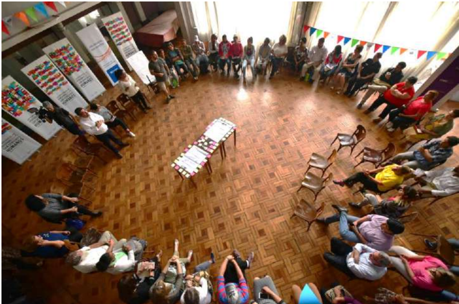
La lluvia obligó a cambiar el lugar donde sería la Mesa para la paz. Un amplio salón techado fue la mejor solución para escapar de las inclemencias climáticas.

Se destacaron las estrategias implementadas por el gobierno departamental y nacional con respecto al uso de energías renovables en la zona.