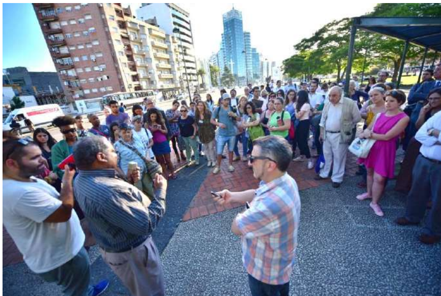
Charla frente al monumento a Ansina.