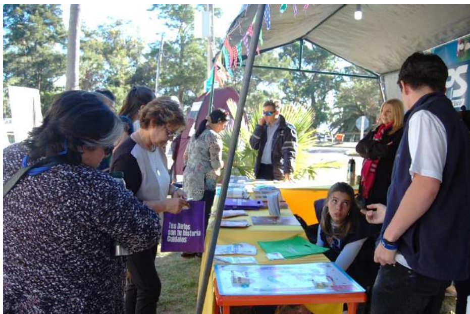
Feria social durante la Mesa de la Paz de Atlántida

Se reconoció como un derecho, en el que hay un avance positivo, la integración y no discriminación de personas afrodescendientes, así como un reconocimiento y aceptación al diferente. Particularmente, se percibe una apertura del municipio de Colonia Nicolich y la alcaldía a generar espacios de reflexión, cuyo eje sea el tema de la sensibilización étnico-racial y, también, aportar al colectivo afrodescendiente en la reconstrucción de su propia historia. Igualmente, algunas personas de otras zonas de Canelones manifestaron que aún perduran prácticas discriminatorias de colectivos minoritarios.