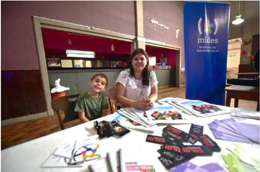
Preparando los materiales para la Mesa de la Paz de Rivera, 2018.