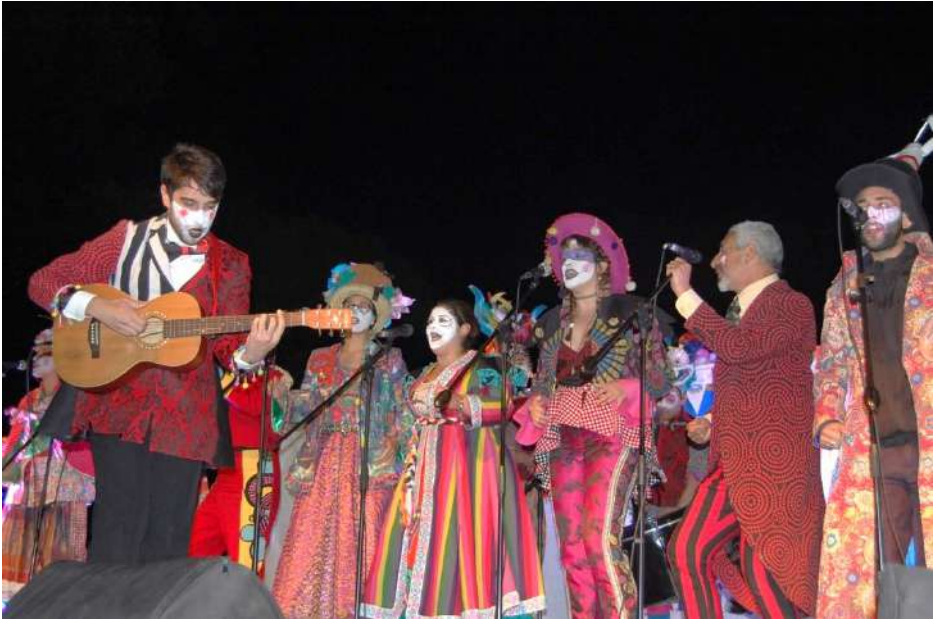
Murga Falta y Resto.