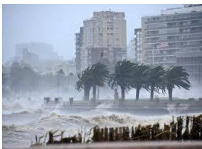
Rambla de Montevideo.

En 2005 un ciclón extratropical con vientos que alcanzaron velocidades de hasta 174 km/h se registró en el sur del país por espacio de diez horas. Afectó severamente al territorio ocasionando la muerte de diez personas, decenas de heridas y cientos de evacuados. Se calcula que las afectaciones económicas alcanzaron los 40 millones de dólares.