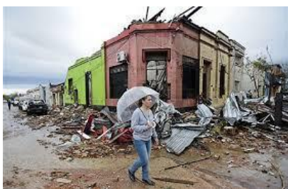
Ciudad de Dolores. Soriano.

En 2016 las condiciones atmosféricas favorecieron la formación de un tornado de categoría F3 que atravesó la ciudad de Dolores. A su paso, dejó 5 personas fallecidas y toda su población sufrió afecciones de carácter psicoafectivo. Los daños ocasionados a nivel de infraestructura se cuantifican en U$S 30 millones y los impactos psicosociales alcanzaron poblaciones cercanas que mantenían vínculo con la ciudad. Este evento operó como refuerzo de la construcción institucional del SinAE y generó la activación de la Junta Nacional de Emergencias y Reducción de Riesgos creada en el 2015.