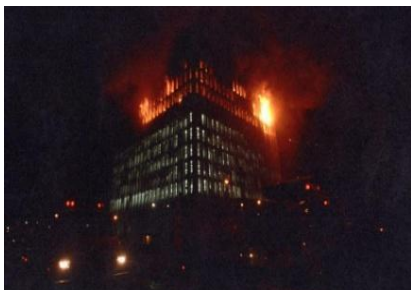
Palacio de la Luz. Montevideo.

En este incendio sucedido en 1993 murieron cinco personas y se destruyeron cuatro pisos. Esto dejó al descubierto carencias tales como fallas en la seguridad de las estructuras, falta de preparación para evacuaciones y ausencia de normativa actualizada. Este evento, dio lugar a la creación del Sistema Nacional de Emergencias (Decreto 103/995), para planificar, coordinar, ejecutar, conducir, evaluar y entender la prevención y las acciones necesarias en todas las situaciones de emergencia, crisis y desastres. La etapa de formación del Sistema se caracterizó en que la mayoría de los esfuerzos se orientaron a la respuesta, enfoque que se mantuvo por aproximadamente diez años debido a la creencia generalizada de que Uruguay es un país libre de riesgos (“en Uruguay no pasa nada”).