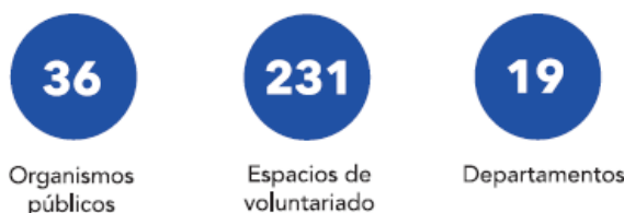
Imagen 3. Ministerio de Desarrollo Social, Mesa Nacional de Diálogo sobre Voluntariado y Compromiso Social. 2018. Manual de gestión y formación del voluntariado, dirigido a instituciones públicas y privadas

Desde el 2016, el SINAE articula con el Programa Nacional de Voluntariado para implementar la capacitación y movilización de personas voluntarias en torno a la gestión integral del riesgo.